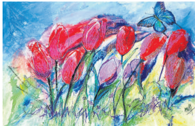
„Rote Tulpen und Himmelsfalter“ von Angelica Kowalewski.

Kontakt: Husarenstall, Mauerstraße 13a, 35781 Weilburg, Edda Bhattacharjee Telefon 0172-7452537, E-Mail an hallo@husarenstall.de .