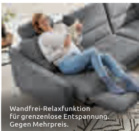
Wandfrei-Relaxfunktion für grenzenlose Entspannung. Gegen Mehrpreis.