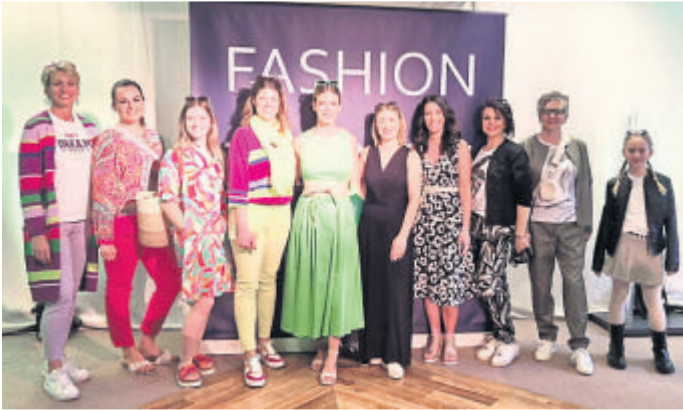
Die Models zeigen die neue Mode.