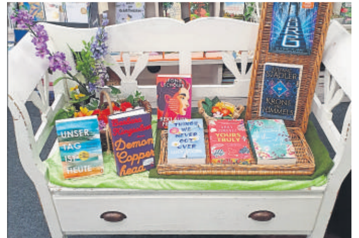
Leseempfehlungen nicht nur für die Ferienzeit.

Kontakt: Residenzbuchhandlung, Langgasse 31 bis 33, 35781 Weilburg, Telefon 06471-30024, www.residenzbuch.buchkatalog.de .