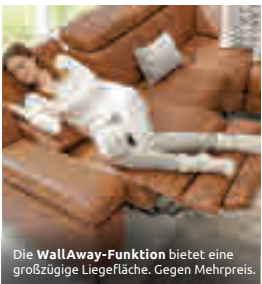
Die WallAway-Funktion bietet eine großzügige Liegefläche. Gegen Mehrpreis.