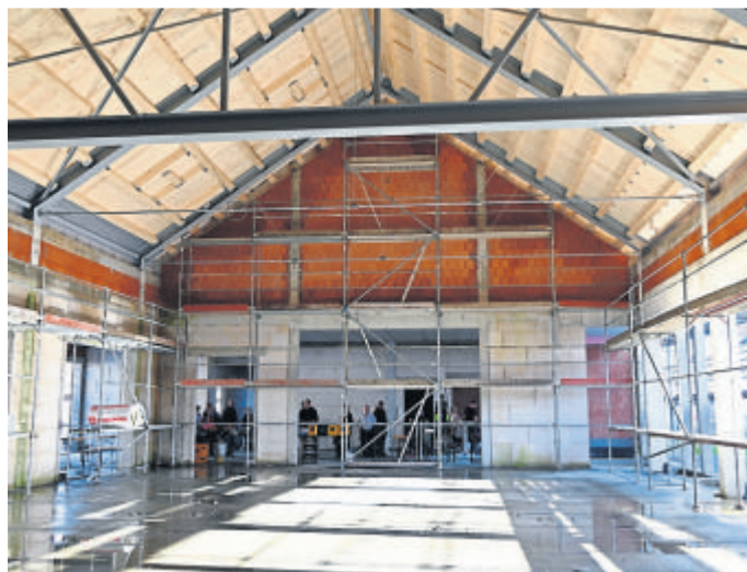
Der neue Saal sieht jetzt schon hell und einladend aus.

Anfangs sei die Gestaltung noch offen gewesen, blickte der Bürgermeister zurück. Und er freue sich sehr, dass das Architekturbüro Ritz