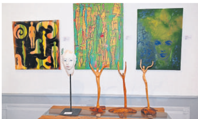
Blick in einen Teil der Galerie.