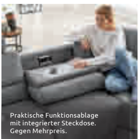
Praktische Funktionsablage mit integrierter Steckdose. Gegen Mehrpreis.