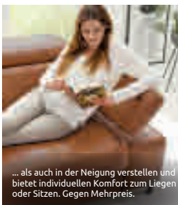
... als auch in der Neigung verstellen und bietet individuellen Komfort zum Liegen oder Sitzen. Gegen Mehrpreis.