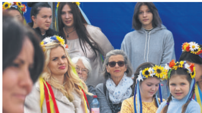
Gäste aus der Ukraine bei einer früheren interkulturellen Woche.

(red). Auch dieses Jahr lautet das Motto der Interkulturellen Woche vom 22. bis 29. September „Neue Räume“. Alle Vereine, Institutionen sowie alle anderen Interessierten, die das diesjährige Programm mit-