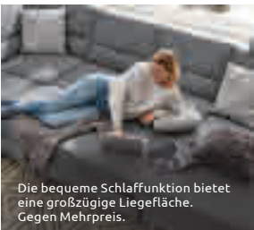
Die bequeme Schlaffunktion bietet eine großzügige Liegefläche. Gegen Mehrpreis.