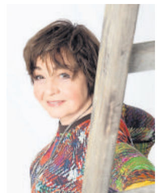
Anka Zink.

Alle Informationen rund um die Saison und Karten gibt es im Büro der Weilburger Schlosskonzerte von Montag bis Freitag von 9 bis 13 Uhr, telefonisch unter 06471-944210 und -11 sowie auf www.weilburger-schlosskonzerte.de .