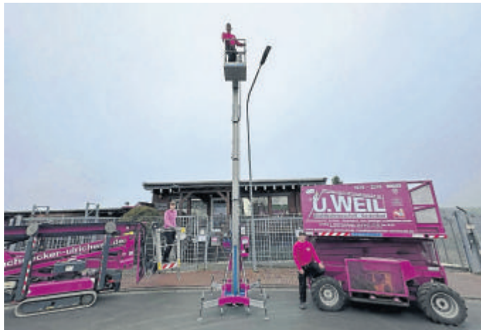
Blick auf einige Arbeitsgeräte.

Kontakt: Ulrich Weil GmbH, Auf Stein 11, 35789 Weilmünster Telefon 06472-7722 oder -2277 oder 06471-508470, www.dachdecker-ulrichweil.de .