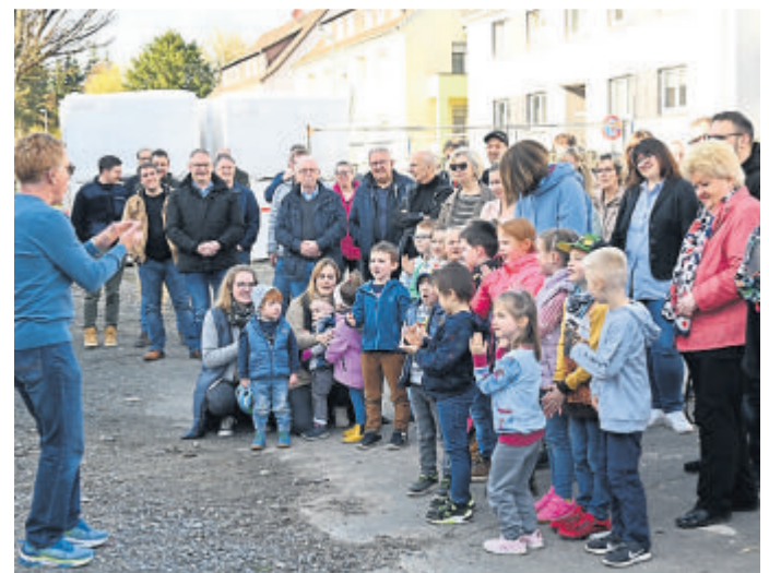
Die Kinder singen ein Lied über das neue Bürgerhaus.