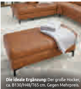
Die ideale Ergänzung: Der große Hocker, ca. B130/H48/T65 cm. Gegen Mehrpreis.

Interliving Sofa Serie 4060 - Eckkombination , Bezug Leder Torro sunset, Metallfuß schwarz, best. aus: 1,5-Sitzer mit Anstellhocker links, Rundecke und 2,5-Sitzer mit Armteil rechts. Inkl. Kopfteilverstellung an allen Elementen. Schenkelmaß ca. 250x285 cm. Ohne Zierkissen und Decke.