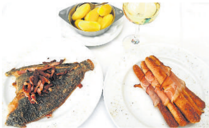
Grissini vom Spargel und Maischolle mit Speck: sie schmecken beide wunderbar.

Kontakt: Gasthaus Neu zum Westerwald, Löhnberger Str. 24, Löhnberg-Niedershausen, Telefon 06471-61233, www.gasthaus-neu.de .