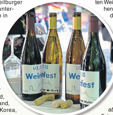
Eigens für das KLA-Weinfest abgefüllte Weinflaschen.

Für das leibliche Wohl sorgen das Team vom „Flammkuchen-Fass“ mit offenem Flammkuchen sowie Marius Wächter aus Hungen mit duftenden Knoblauchbaguettes und Crêpes. Knusprige Pommes, Bratwurst und mehr hat der Imbiss Schliffer aus Weinbach zu bieten.