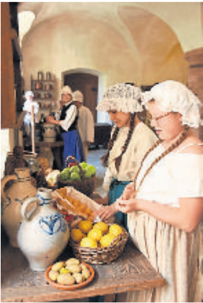
Szene in der Schlossküche.

(red). Die Weilburger Heinrich-von-Gagern-Schule nimmt ihre Besucher wieder am Samstag, 25. Mai, und am Sonntag, 26. Mai, jeweils von 11 bis 16 Uhr (letzter Einlass) mit auf eine historische Zeitreise durch die Geschichte des Weilburger Schlosses. Das museumspädagogische Projekt, welches im nächsten Jahr 20 Jahre alt wird, zeigt wieder Szenen aus den letzten drei Jahrhunderten.