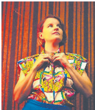
Singer-Songwriterin: Me for queen.