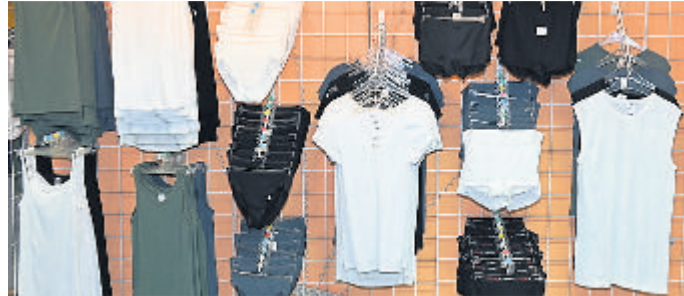
Funktionsunterwäsche in großer Vielfalt

Kontakt: Hermko, Marktstraße 6, 35781 Weilburg, Telefon 06471- 2195.