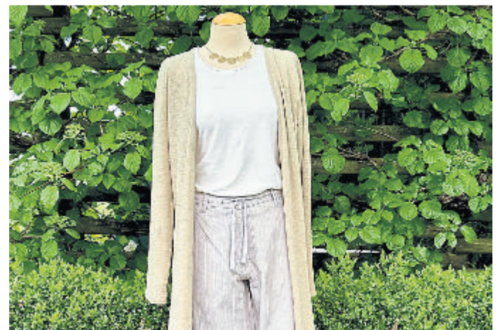
Kleidung aus Hanf.

Kontakt: Weltladen Weilburg ZWEI, Mauerstr. 9, 35781 Weilburg, Telefon 06471-6291450, www.weltladen-weilburg.de.