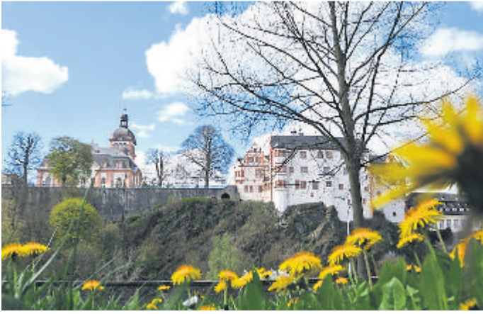
Frühlingsblick auf das Weilburger Schloss.