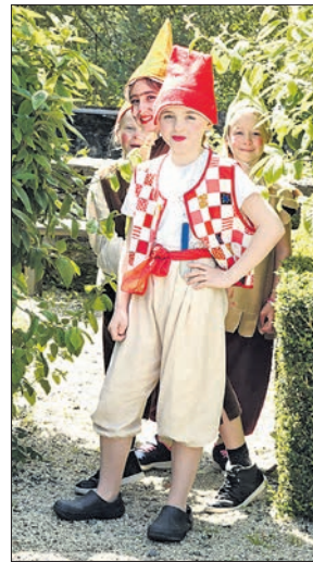
Die Zwerge warten im Altangarten auf Schneewittchen.

Die Kinder waren sich einig: es hat Spaß gemacht, vor und auf der Bühne. fg