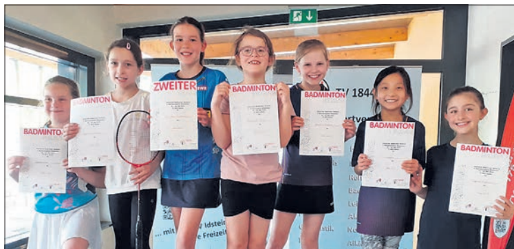
Die U11 Mädchen beim Turnier in Idstein

Im Jungeneinzel U11 ergatterte Adrian Ebert als Dritter einen tollen Platz auf dem Trepp-