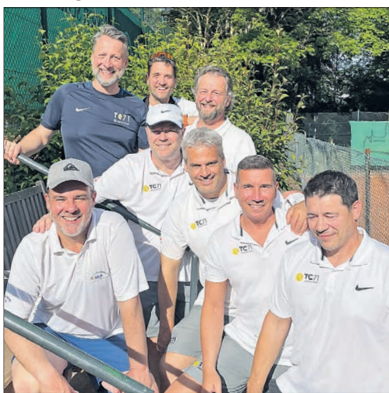
Bestätigten ihre gute Trainingsform: Die Herren 50 lieferten am vergangenen Samstag mit 7:2 gegen TEVC Kronberg II ab.

Mit Ausnahme der Damen 50 , die ihre Erfahrungen im Medenspielbetrieb mit einem 2:4 beim Hofheimer TC weiter ausbauen, lieferten die Erwachsenen-Mannschaften des TC 71 Bremthal am Wochenende einen Sieg nach dem anderen. Die Damen 40 starteten zuhause mit einem starken 4:2 gegen BW Wiesbaden, das die Herren 50 auswärts mit einem 7:2 beim TEVC Kronberg II toppten. Am Sonntag trumpten dann die Herren 40 mit 5:1 gegen die SG Kelkheim und die Herren 30 mit einem fulminanten 6:0 gegen den TC am Bingert/Wiesbaden auf. Auch das Unentschieden der Damen 60 daheim gegen TC Sulzbach II durfte beklachtet werden – bis zum letzten Punkt des zweiten Doppels hätte die Partie noch in eine Niederlage kippen können. Am Mittwoch schon mussten die Herren 65 eine solche gegen TC Niddatal hinnehmen.