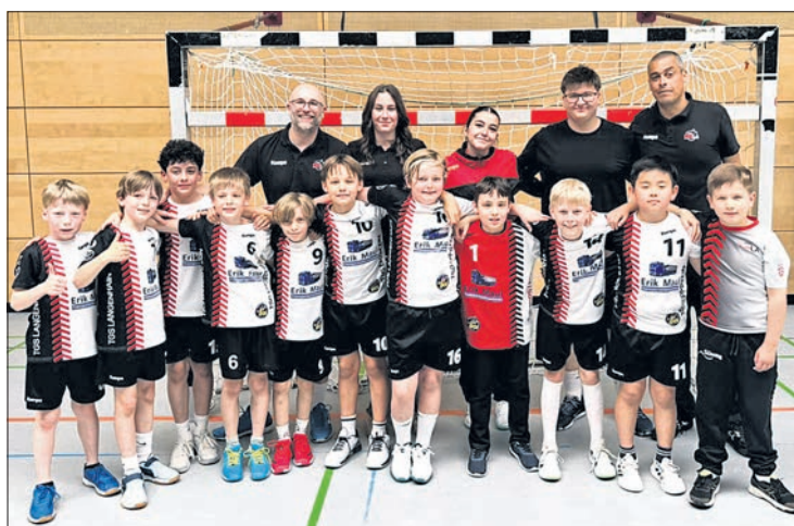
Die Turniersieger von der EppLa-E-Jugend.

Nach dem Ende des Turniers lobten die Trainer den starken Teamgeist, mit dem die Mann-