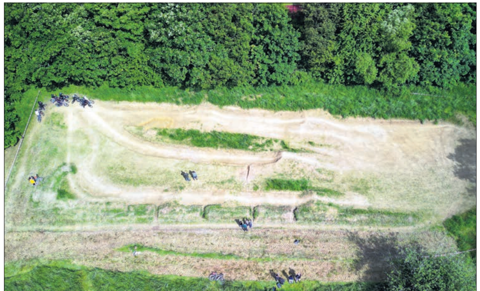
Auf dem Gelände des Bikeparks tummeln sich zur Eröffnung am Starthügel die jugendlichen Mountainbike-Fans.