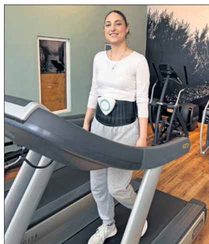
Effizientes Fitnessstraining mit der AirShaper®-Methode.

Nähere Infos und Anmeldung bis 14. Juni 2024 telefonisch unter 06127 7559 oder via Mail: niedernhausen@vitova-fitness.de .