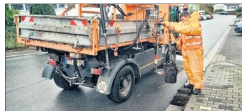
Mit einem mobilen Sinkkastenreiniger ist der Bauhof im Einsatz

Die Stadt Eppstein bittet darum, sich bei Julia Pretsch vom Fachbereich Soziales unter der Rufnummer (061 98) 305-117 oder per E-Mail an julia.pretsch@epstein.de anzumelden. Für die Sprechstunde sollten die eigenen Smartphones oder Tablets in geladenem Zustand mitgebracht werden, da die Schulung am eigenen Gerät am sinnvollsten ist.