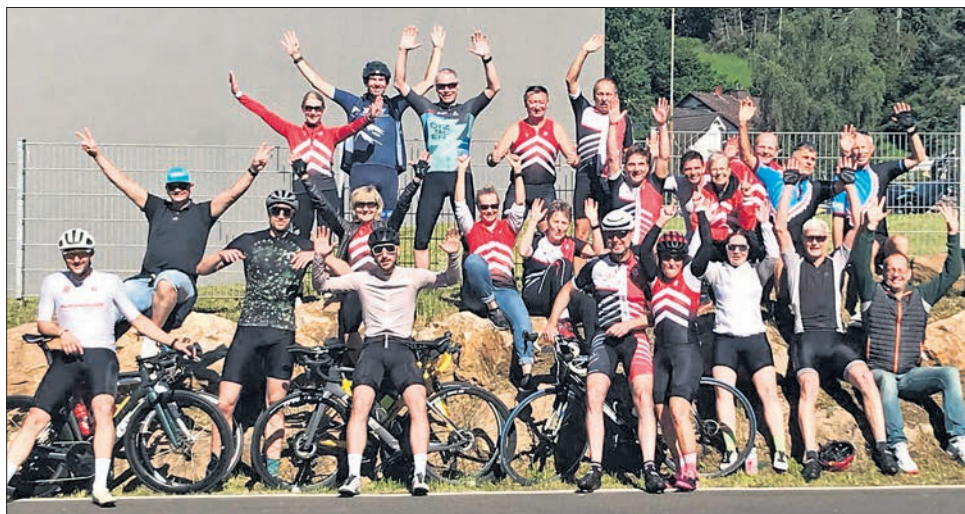
Glückliche Gesichter nach dem Einzelzeitfahren der Eppsteiner Triathleten.