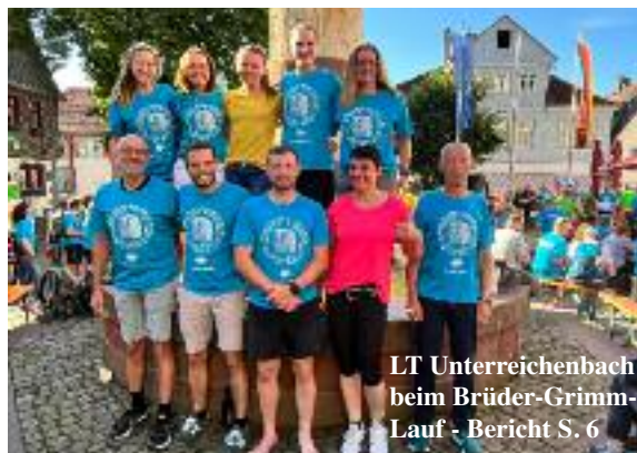
LT Unterreichenbach beim Brüder-Grimm- Lauf - Bericht S. 6