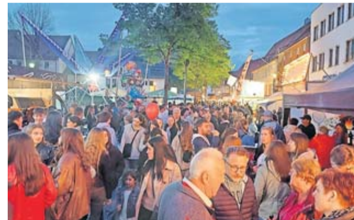
Der Helle Markt lockte mit vielen Ständen und abwechslungsreichem Programm auch in diesem Jahr wieder Tausende Besucherinnen und Besucher nach Schlüchtern.