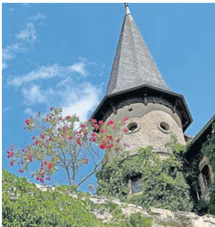
Am Wochenende ist Burgfest.

Am 11. und 12. Mai auf Burg Brandenstein