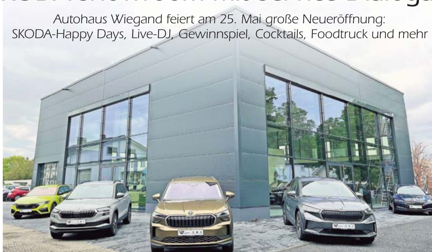
Der Skoda Showroom im neuen Gebäude auf dem Gelände des Autohauses Wiegand am Spitalacker 6.

Modernität und Klasse treffen auf ein zeitloses Design und Nachhaltigkeit: Am 25. Mai eröffnet das Autohaus Wiegand in Gelnhausen offiziell seinen neuen SKODA-Showroom am Spitalacker 6 und investiert einmal mehr in eine gelungene Zukunft. Nicht nur mit ihrer breit aufgestellten Fahrzeugpalette der Marken CUPRA und SEAT punktet das Gelnhäuser Unternehmen künftig – mit einer großen Auswahl an Neu- sowie Gebrauchtwagen kommen SKODA-Fans nun ebenfalls ganz auf ihren Geschmack. Dabei hat das 2019 in die Wiegand-Gruppe integrierte Autohaus keine Kosten gescheut, um Ihnen noch mehr Rundumservice und vor allem Spaß am Fahrerlebnis zu bieten. „Wir freuen uns sehr, dass wir als SKODA-Vertriebspartner unsere Kunden nun vollum-