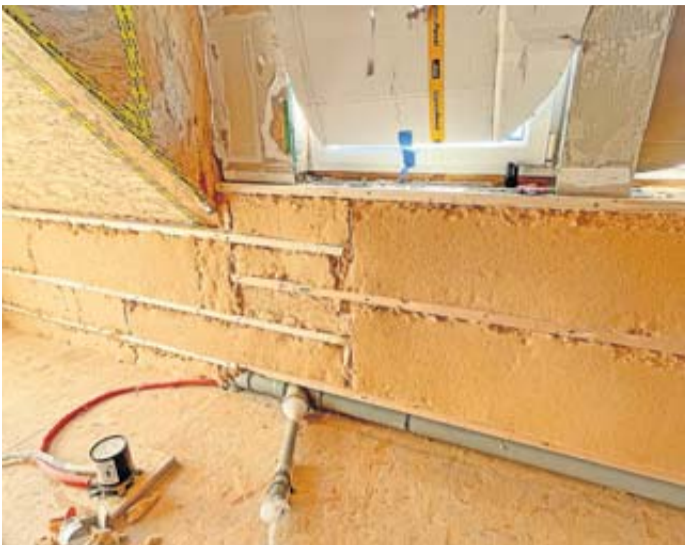
Wird ein Haus energetisch saniert, ist das ein großer Kraftakt. Für Hilfe vom Staat gibt es viele Vorgaben, etwa zu den Eigenschaften einer Wärmedämmung.

Die energetische Sanierung ist nach dem Bau eines Hauses der größte finanzielle Kraftakt für Immobilienbesitzer. Der Staat hilft mit Zuschüssen. Doch die wollen korrekt beantragt sein. Ärgerlich, wenn die Förderung an Formfehlern scheitert. Die Tücken stecken zum einen in den Unterlagen. Zum anderen