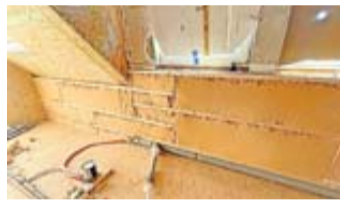
Für Hilfe vom Staat gibt es viele Vorgaben, etwa zu den Eigenschaften einer Wärmedämmung.

Die energetische Sanierung ist nach dem Bau eines Hauses der größte finanzielle Kraftakt für Immobilienbesitzer. Der Staat hilft mit Zuschüssen. Doch die wolle korrekt beantragt sein. Ärgerlich, wenn die Förderung an Formfehlern scheitert. Die Tücken stecken zum einen in den Unterlagen. Zum anderen