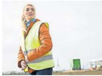
Für zusätzliche Sicherheit und Sichtbarkeit bei Pannen müssen Autofahrer mindestens eine Warnweste an Bord haben.

Viele Warnwesten reflektieren nicht genug. Das zeigt ein Test vom ADAC. Dabei fiel gut jedes dritte von 14 getesteten Modellen durch. Sie reflektieren fast gar nicht, so der Autoclub. Ein Modell wurde vom Hersteller nachgebessert und bestand den Test daraufhin. Über die genannte Anzahl hinaus fielen noch mehrere Westen durch, die sogar eine Norm EN ISO 20471 trugen – sie wurden aber mittlerweile zurückgezogen und fallen nicht ins Gesamtergebnis. Daher rät der Autoclub zwar, beim Kauf auf genau diese Norm EN ISO 20471 zu achten. Aber ein Label mit der aufgedruckten Norm liefere keine 100-prozentige Garantie dafür, dass die Weste auch ordnungsgemäß reflektiert. „Deshalb empfiehlt es sich immer, noch einen Selbsttest zu machen“, rät ADAC-Sprecherin Katja Legner. Dazu können Leuchtquellen wie eine Taschenlampe, eine Smartphone-Taschenlampe oder eine Stirnlampe zum Einsatz kommen. Die richtet man dann direkt neben oder vor den Kopf im Abstand von etwa drei Metern auf die Weste. Die Leuchtstreifen guter Modelle sollten nun strahlend weiß reflektieren.