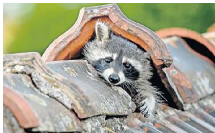
Die steigende Präsenz von Waschbären in Wohngebieten sorgt zunehmend für Unmut bei Anwohnern.

füttern. Einige Gerüche schrecken die Tiere allerdings auch ab – der nach Hund etwa. Das kann man sich zunutze machen und eine viel benutzte Hundedecke an möglichen Zugängen platzieren. Auch Säckchen mit Hundehaaren, die man an Sträuher aufhängt, können Waschbären fernhalten. Den Geruch von Mottenkugeln mögen die Tiere „Vier Pfoten“ zufolge ebenfalls nicht.