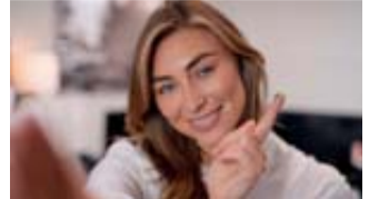
Bekommt man einen Splitter nicht richtig heraus, kann sich ein Eiterherd bilden.