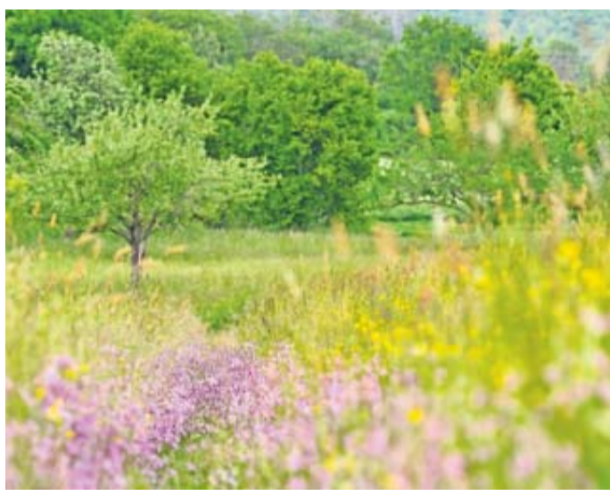
Viele Blumen und Kräuter blühen jetzt. Es ist der perfekte Zeitraum, um sie besser kennenzulernen.

Der Monat Mai ist die perfekte Zeit, um sich mit den blühenden Wiesenpflanzen zu beschäftigen und häufige Vertreter kennenzulernen. Wer sich für Blumen und Kräuter am Wegesrand interessiert, für den ist diese Veranstaltung der ideale Einstieg. Ganz nach dem Motto „Was blüht denn da?“ bietet der Naturschutzfonds Wetterau in Kooperation mit der vhs Wetterau eine Einführung in unsere heimische Pflanzenwelt an. Neben den häufigsten Wiesenpflanzen und deren Lebensräumen wird es auch eine Einführung in die Pflanzenbestimmung per App und mit Büchern geben. Zudem erfahren die Teilnehmerinnen und Teilnehmer, mit welchen Maßnahmen