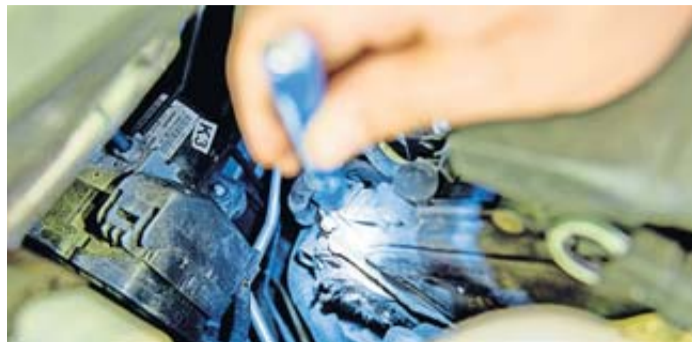
Sieht stark nach Marderbesuch aus. Angefressene Schläuche und Abdeckungen sind stumme Zeugen des nächtlichen Marderwütens im Motorraum.

Marder sind neugierig und erkunden gerne den Motorraum von Autos. Das Problem: Riechen Kabel und Schläuche nach einem Rivalen, wird zugebissen. Wer sein Auto draußen abstellt und öfter woanders parkt, hat schnell Duftmarken am Fahrzeug. Die Biss-Schäden können gravierend sein, vor allem bei Elektroautos, erklärt der Gesamtverband der Deutschen Versicherungswirtschaft (GDV). Im Durchschnitt kostete eine Beißattacke fast 500 Euro. Der TÜV Nord gibt auf seiner Website Tipps, was gegen Marderschäden hilft.