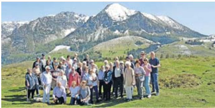
Die Senioren Union Bad Vilbel erkundete das malerische Tennengebirge.

Entdeckungsreise: Senioren erkunden Salzburg, Bad Ischl und Hallstatt