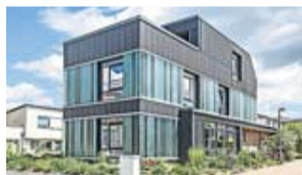
Dieses Haus in Hannover besteht vollständig aus Recyclingmaterialien.

Im Jahr 2020 fielen in Deutschland 60 Millionen Tonnen Bauschutt an. Immerhin: rund 47 Prozent davon wurden wiederverwertet. Das Recycling von Baumaterialien muss noch Fahrt aufnehmen, die Möglichkeiten der Wiederverwendung sind beim Hausbau noch lange nicht ausgeschöpft. Klinkersteine aus alten Dachziegeln, Holzböden aus aufbereitetem Altholz, Markisen und Rollos aus ehemaligen PET-Flaschen – der Markt für Recyclingprodukte boomt. Baufamilien und Modernisierende können mittlerweile auf ein breit gefächertes Angebot