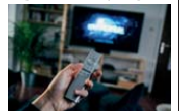
Ab 1. Juli bestimmen Mieter selbst über ihren TV-Anbieter.

www.expert.de/Themenwelten/Wegfall-Nebenkostenprivileg