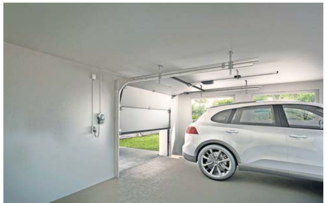
Moderne Garagentorantriebe bringen mit vielfältigen Zusatzfunktionen mehr Sicherheit und Komfort in die Garage.

Moderne Antriebseinheiten für das Garagentor lassen sich