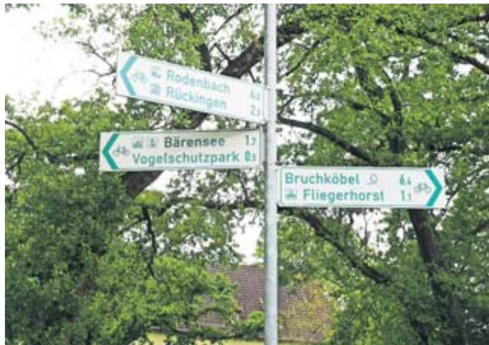
Die neue Radwegebeschilderung im Main-Kinzig-Kreis soll Radfahrenden die Orientierung erleichtern.

Im Westen des Kreises haben Kommunen wie Bruchköbel, Erlensee, Maintal und Hanau die Radwegebeschilderung bereits umgesetzt, die Gemeinde Schöneck ist fast fertig damit. Für den verbleibenden Teil des Main-Kinzig-Kreises übernimmt die Planungsgesellschaft RV-K mbH aus Frankfurt Planung und Umsetzung – und zwar gemeinsam mit den Kommunen. Im Main-Kinzig-Kreis besichtigten Mitarbeitende der RV-K, die Wegweisungssysteme so-