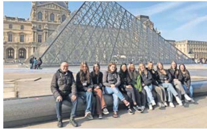
Vor der Glaspypiramide im Innenhof des Louvre.