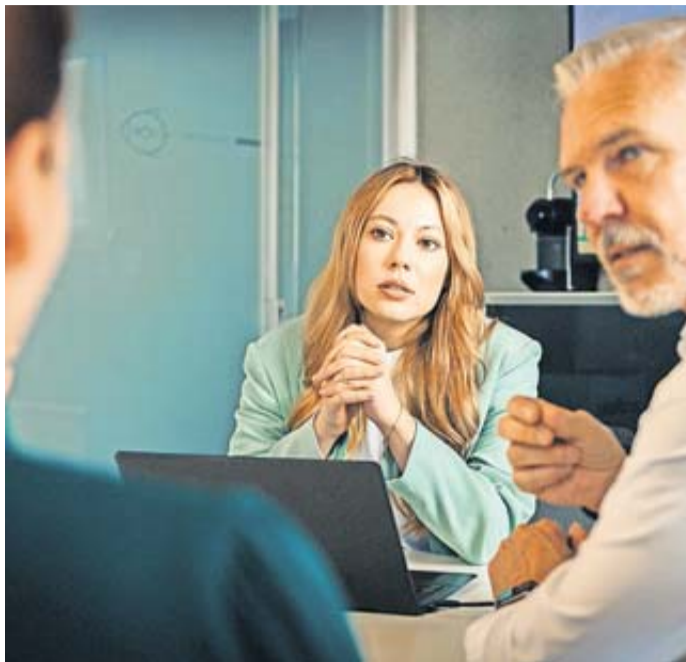
Vor allem Verantwortung schreckt viele Arbeitnehmer.

59 Prozent der Deutschen fürchten sich wöchentlich