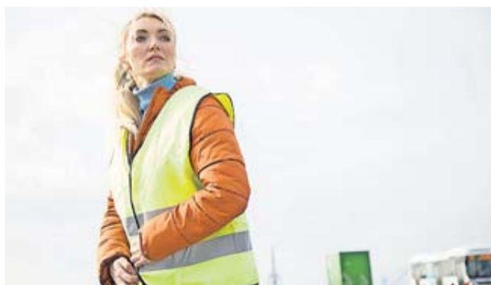
Für zusätzliche Sicherheit und Sichtbarkeit bei Pannen müssen Autofahrer mindestens eine Warnweste an Bord haben.

schreibe die Anzahl der Reflektorstreifen und die Reflexionsstärke vor. Zu finden ist die Angabe entweder auf dem Beipackzettel oder dem Etikett direkt an der Weste. Kleiner Schnelltest, um die Reflexionsfähigkeit der Weste vor dem Kauf vor Ort einschätzen zu können: ein Handyfoto mit Blitz machen. Darauf müssen die Streifen hell leuchten. Das ginge auch, wenn die Weste etwa noch in einer Folie verpackt ist. Der ACE rät, im Auto für jeden Sitzplatz eine Weste parat zu haben – jeweils lieber etwas größer als zu klein, damit sie auch über dickere Kleidung passt.