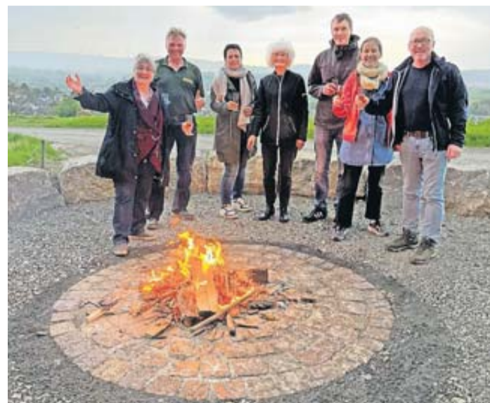
Mitglieder des grünen Ortsverbandes freuen sich über den neu eingerichtete Grill- und Verweilplatz in Flieden.

Bei abwechslungsreichem Wetter und guter Stimmung wurde die gemütliche Feuerstelle eingeweiht, während die