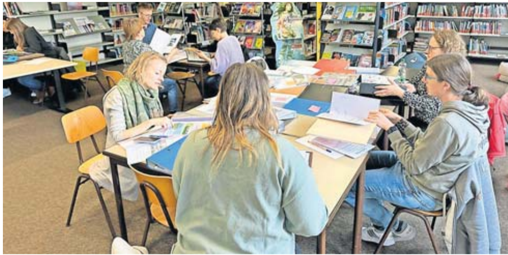
Die Jury, bestehend aus Lehrkräften aller teilnehmenden Schulen, sitzt über fast 150 Berichten und wählt die diesjährigen Preisträgerinnen und -träger aus.