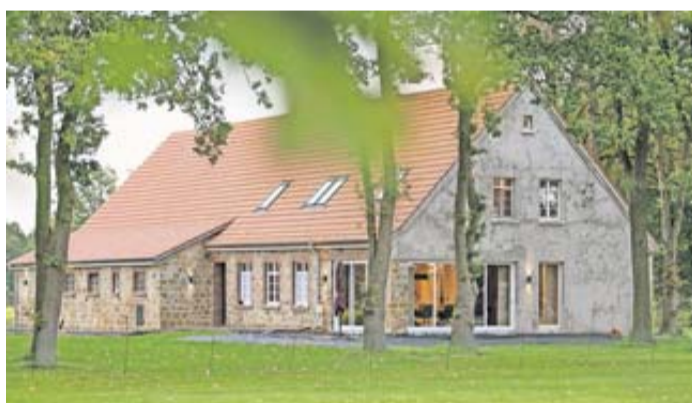
Viele Altbauten sind Schmuckstücke – umso mehr, wenn sie eine gute Energiebilanz haben.