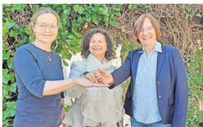
Hand in Hand arbeiten die Johannitergrundschule und die Stadt Münzenberg an der Weiterentwicklung der Kooperation „Schritt für Schritt“, die für den Deutschen Kitapreis 2024 nominiert wurde.

Münzenberg. Das Kooperationsbündnis zwischen den städtischen Kitas und der Johanniterschule hat sich von seinem sperrigen Titel verabschiedet. Aus den eingereichten Namensvorschlägen hat der Vorschlag „Schritt für Schritt“ das Rennen gemacht. Der Name könnte treffender nicht sein, um die Arbeitsweise des Teams im Sinne einer ganzheitlichen Unterstützung von Kindern, Jugendlichen und Familien in Münzenberg zu beschreiben.