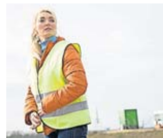
Für zusätzliche Sicherheit und Sichtbarkeit bei Pannen müssen Autofahrer mindestens eine Warnweste an Bord haben.

Warnwesten können im Straßenverkehr für mehr Sicherheit sorgen. Im Auto ist sogar mindestens eine vorgeschrieben. Aber was taugen die Überziehwesten – oft in Neon-gelb mit reflektierenden Streifen – in der Praxis? Denn die preisliche Spannweite ist groß. Diese Frage inspirierte den Auto Club Europa (ACE) und die Prüforganisation GTÜ zu einem gemeinsamen Test. Obwohl die billigste durchfiel: Grundsätzlich lasse sich die Sicherheitswirkung nicht am Preis oder Markennamen erkennen. Aber wichtig: Unbedingt auf die Prüfnorm „DIN EN 20471“ achten. Diese schreibe die Anzahl der Reflektorstreifen und die Reflexionsstärke vor. Zu finden ist die Angabe entweder auf dem Beipackzettel oder dem Etikett direkt an der Weste. Kleiner Schnelltest, um die Reflexionsfähigkeit der Weste vor dem Kauf vor Ort einschätzen zu kön-