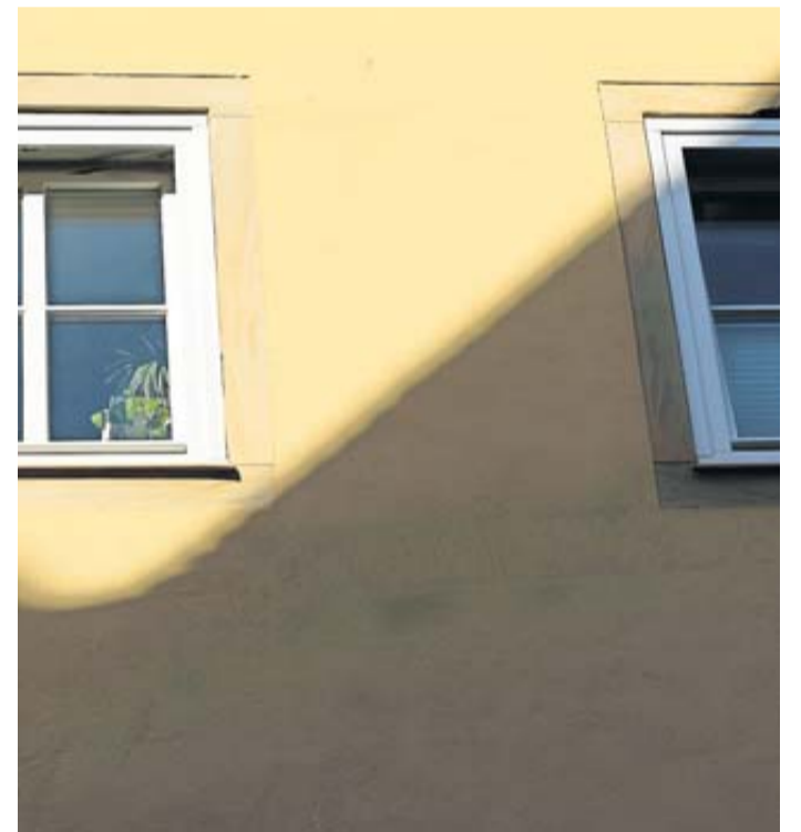
Mit dem Frühling steigen die Temperaturen. Heizungen, die auch das Wasser für den Haushalt erwärmen, können dann in den Sommerbetrieb gehen.

In den diesen Wochen endet die aktuelle Heizsaison. Um Energie zu sparen, sollten Hauseigentümerinnen und Hauseigentümer dann ihre Heizung bis Oktober komplett abschalten. Oder – wenn die Heizung auch das Wasser für Dusche, Küche und Co. erwärmt – deren Sommerbetrieb aktivieren. Dazu rät das Informationsprogramm Zukunft Altbau. Der Grund: Unterschreitet die Außentemperatur etwa in kühleren Nächten einen bestimmten Wert, springt der Öl-, Gas- oder Pelletkessel oder die Wärmepumpe sonst auch im Sommer immer wieder an – und speist trotz heruntergedrehter Thermostate Wärme in den Heizkreislauf. „Ein besseres Beispiel für sinnlosen Verbrauch gibt es nicht, da die Bewohnerinnen und Bewohner die Wärme überhaupt nicht benötigen“, so Frank Hettler von Zukunft Altbau. „Am nächsten Tag wird es ja wieder warm, das Haus kühlt so schnell nicht aus.“