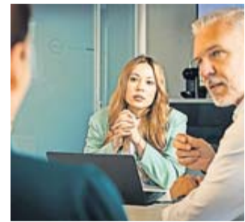
Vor allem Verantwortung schreckt viele Arbeitnehmer.

Über die Hälfte der Arbeitnehmenden in Deutschland (59 Prozent) fürchtet sich mindestens einmal wöchentlich vor der Arbeit. Fast jeder Fünfte (17 Prozent) hat sogar täglich Angst. Das ist das Ergebnis einer repräsentativen Studie, die die Plattform für psychische Gesundheit «Head-space» durchgeführt hat. Jeder Dritte (33 Prozent) verspürt demnach eine extreme tägliche Belastung.