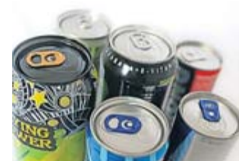
In Energydrinks steckt nicht nur ordentlich Koffein, sondern auch viel Zucker.

Übrigens: Um den Koffeingehalt einer gesamten Energyd-