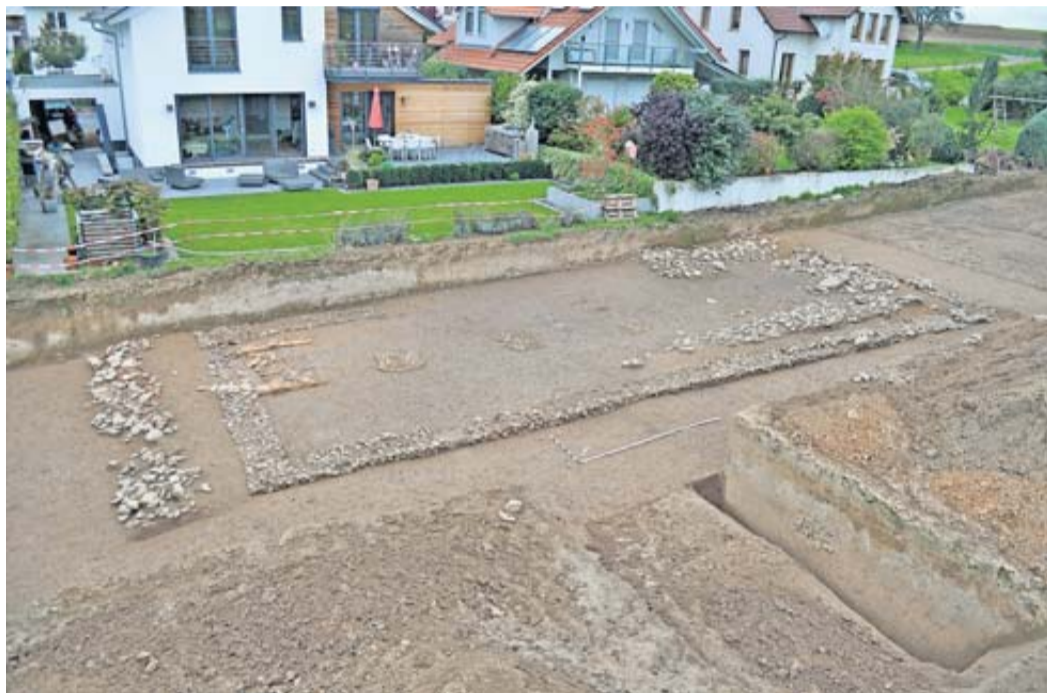
Kulturdenkmäler unter unseren Füßen: Reste einer römischen „Villa Rustica“ 2.-3. Jahrhundert. n. Chr. in Ober-Wöllstadt (Grabung 2014).

Grund hierfür ist die besondere Kombination der verkehrstechnisch zentralen Lage innerhalb Europas mit alten Nord-Süd- und Ost-West-Verbindungen, den überaus fruchtbaren Lössböden, den zahlreichen Wasserläufen und dem größtenteils gemäßigten Klima. „Wie beliebt der Wetteraukreis bis heute ist, zeigt sich nicht zuletzt am prognostizierten Bevölkerungswachstum bis 2050: Der Wetteraukreis wird laut den Experten des statistischen Landesamtes hessenweit am stärksten wachsen“, so der Landrat.