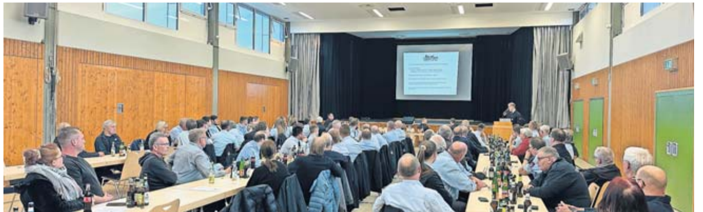
Zahlreiche Mitglieder der Feuerwehr der Gemeinde Wölfersheim treffen sich bei der Jahreshauptversammlung.

89 Einsätze im Jahr 2023 für Feuerwehren der Gemeinde Wölfersheim