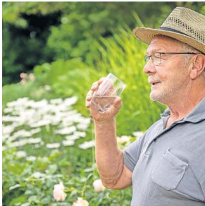
Trinken nicht vergessen! Mit einfachen Tricks wird der regelmäßige Griff zum Wasserglas selbstverständlich.

Was ebenfalls einen Versuch wert ist: das Trinken fest an andere Alltagsgewohnheiten knüpfen. So können wir uns vornehmen: vor jeder Mahlzeit ein Glas Wasser - oder auch morgens direkt nach dem Aufstehen.