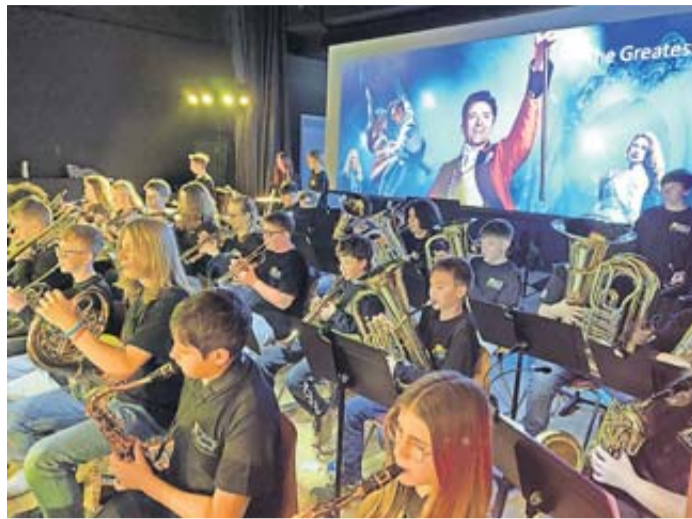
Großes musikalisches Kino versprechen die Bands der Stadtschule Schlüchtern beim Sommerkonzert am Stadtplatz.

Schlüchtern. Die Stadtschule Schlüchtern lädt für Donnerstag, 20. Juni ab 19 Uhr zu ihrem Sommerkonzert auf den neueröffneten Schlüchterner Stadtplatz ein. Die Bläserklassen und Orchester der verschiedenen Jahrgangsstufen werden an diesem Abend auf dem Platz musizieren, während ein Kamerateam die Bilder und Stimmungen live auf die große EM-Leinwand überträgt. So entsteht eine tolle Festivalatmosphäre. Während der Orchesterbeiträge werden professionell er-