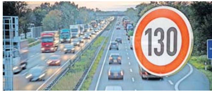
Kaum ein Thema polarisiert in Deutschland mehr als die Diskussion um ein allgemeines Tempolimit auf Autobahnen.

Auch ohne Tempolimit Aufmerksamkeit gefragt