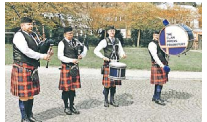
Die „Clan Piper“ freuen sich schon.