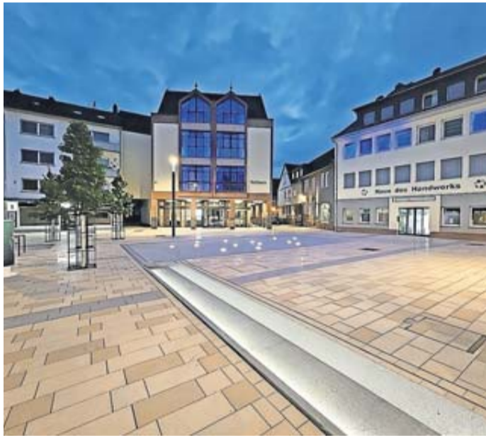
Der neue Schlüchterner Stadtplatz wird mit einem umfangreichen Programm feierlich eröffnet.

Schlüchtern. Die Stadt Schlüchtern feiert die Eröffnung des neuen Stadtplatzes mit einem umfangreichen Programm von Freitag, 14. Juni, bis einschließlich Sonntag, 16. Juni.