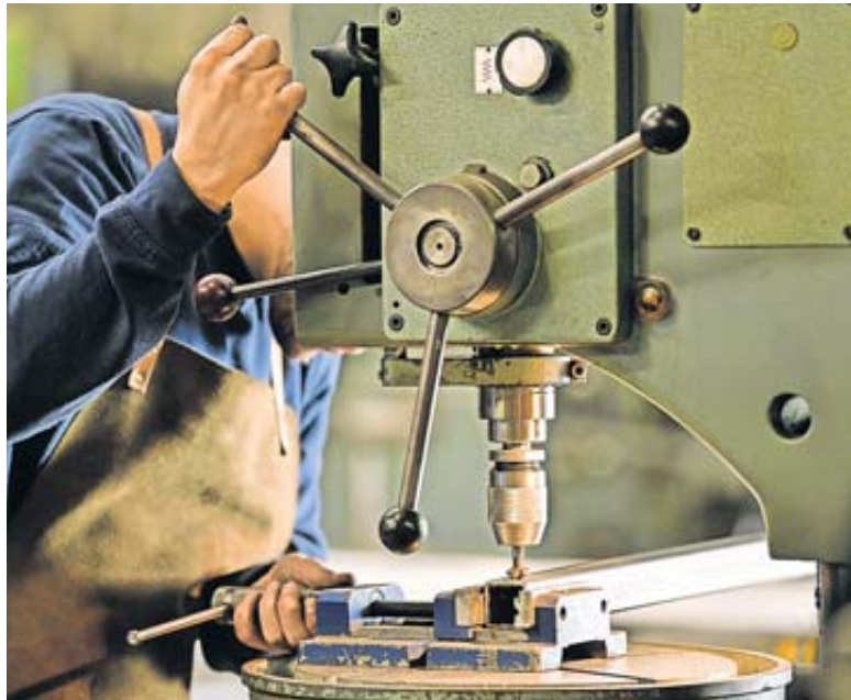
Passen Ausbildungsbetrieb und Azubi wirklich zusammen? Das können beide Seiten in der Probezeit herausfinden.

Nur wenn die Ausbildung während der Probezeit länger unterbrochen wurde, lässt das Bundesarbeitsgericht in Ausnahmefällen eine Verlängerung um die