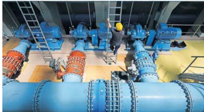
Neue Jobbezeichnung: Fachkräfte für Wasserversorgungstechnik, wie hier in einer Wasserversorgungsanlage in Leipzig, heißen in Zukunft Umwelttechnologen für Wasserversorgung.

Die vier neuen Ausbildungsordnungen treten zum 1. August 2024 in Kraft. Grund für die Modernisierung seien Herausforderungen wie die Digitalisierung, der Klimawandel sowie verän-