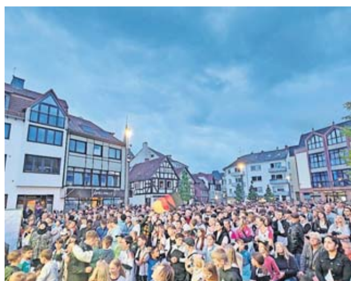
Zahlreiche Fußballfans verfolgten das Eröffnungsspiel auf dem neugestalteten Stadtplatz.