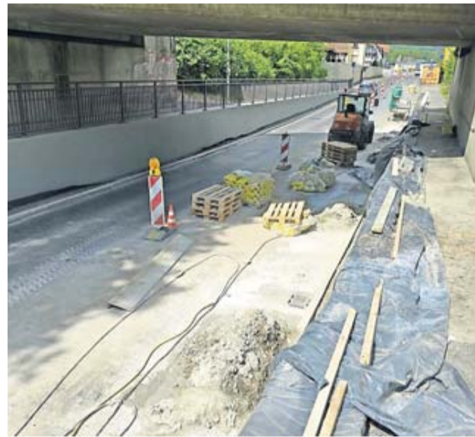
Spessartstraße/L3178 im Bereich der Bahnunterführung, deren Stützwände zuletzt durch HessenMobil saniert wurden.

Die bevorstehenden Arbeiten sind Teil einer Gemeinschaftsmaßnahme der Stadt Bad Soden-Salmünster sowie der Stadtwerke und Hessen Mobil. Im Nachgang an die abgeschlossene Sanierung der Stützwände im Bereich der Bahnunterführung in der Spessartstraße wird nun die Fahrbahn der Landesstraße vom Kreisell Obertor bis zur Ampelanlage an der Autobahnauffahrt grundhaft durch Hessen Mobil erneuert. Weiterhin werden in diesem Bereich die Gehwege und die Beleuchtungsanlage durch die Stadt sowie die Wasser- und Kanalleitungen durch die Stadtwerke erneuert. „Wir freuen uns, dass wir erneut ein Großprojekt in Zusammenarbeit mit Hessen Mobil in Bad Soden-Salmünster umsetzen können. Ganz besonders freut mich,