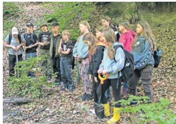
Schülerinnen und Schüler der Klasse G4a.