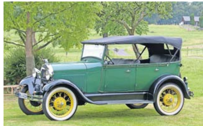
Ein Ford Model A aus dem Jahr 1929.

Bis in die 20er Jahre wurden 15 Millionen T-Modelle gebaut. Ab 1928 kam das neue Model A. In vier Jahren liefen weitere 4,8 Millionen Fahrzeuge vom Band. Das T-Modell war das erste für die breite Bevölkerung erschwingliche Automobil, das für verschiedenste Zwecke des All-