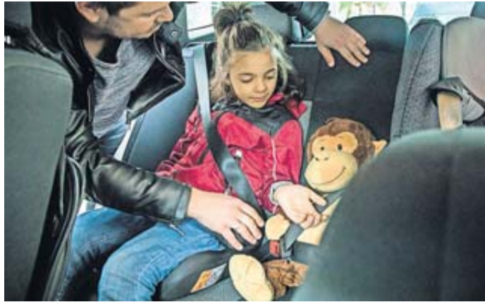
So fährt das Kind sicher im Auto mit – selbst das Kuscheltier ist angeschnallt.

Vor der Abfahrt sollte kontrolliert werden, dass die Kinder ordentlich angeschnallt sind. Passiert das nicht, besteht ein höheres Risiko im Falle eines Unfalls. Außerdem wichtig: Bevor es losgeht, sollte zusätzliches Equipment wie Taschen, Musikinstrumente und Sportklamotten sicher verstaut werden.