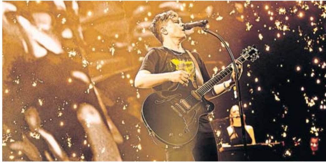
Michael Patrick Kelly

Der charismatische Singer-Songwriter Michael Patrick Kelly setzt seine triumphale B:O:A:T:S-Tour fort, inspiriert von seinem gleichnamigen Erfolgs-Album. Der irisch-amerikanische Künstler spielte 55 Shows quer durch Europa und erreichte 300.000 Besucher im Rahmen dieser Tour. Sein ausverkauftes und umjubeltes Konzert im Sommer 2023 beim Gießener Kultursommer ist vielen noch in guter Erinnerung. Nun wird der erfolgreiche Musiker aufgrund der großen Nachfrage am 11. Juli in Friedberg beim „Friedberg Open Air Sommer“ auftreten. Auf dem Album verarbeitet Michael Patrick Kelly ermutigende Geschichten aus aller Welt in kraft- und gefühlvollen Songs, die durch wahre Begebenheiten inspiriert wurden. Das in mehreren europäischen Ländern mit Gold und Platin prämierte Album erhielt auch die Auszeichnung „Album des Jahres“. Die Zuschauer können sich in der zweieinhalbstündigen Show auf ein Hit-Feuerwerk mit Songs wie „Beautiful Madness“, „Throwback“, „Blurry Eyes“, „Best Bad Friend“ oder