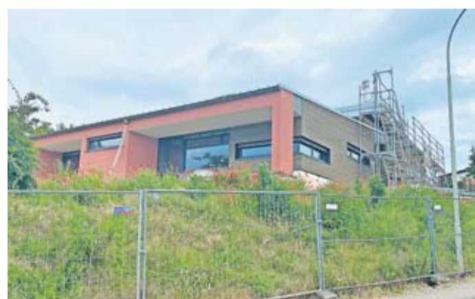
Die Bauarbeiten befinden sich auf der Zielgeraden: Hier entsteht die neue topmoderne Kita in Oppershofen.

Aufgrund seiner optischen Stern-Form könnte man durchaus sagen, dass der frühere Kindergarten in Oppershofen einer der schönsten der Wetterau war. Aber: Nach jahrzehntelanger Nutzung war der Kindergarten in die Jahre gekommen. Gleichzeitig haben sich die gesetzlichen Anforderungen im Bereich der Kinderbetreuung im letzten Jahrzehnt enorm weiterentwickelt. Die logische Folge: Der frühere Kindergarten in Oppershofen entsprach nicht mehr den Normen. Um konkret zu werden, ein paar Beispiele: Die Entwicklung fängt schon beim Namen