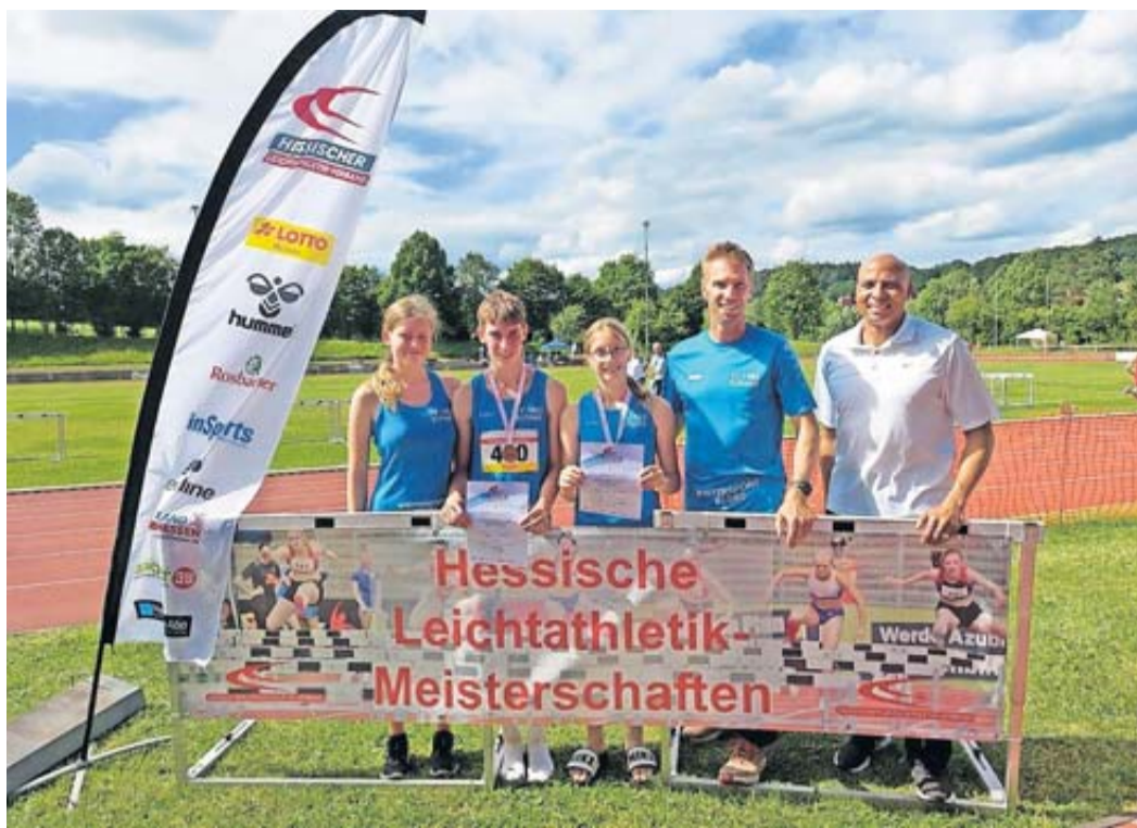
Eine tolle Leistung aller Teilnehmer des TV Echzell.

Hessische Meisterschaften in den Mehrkämpfen