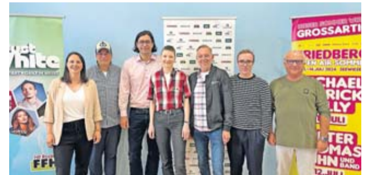
Alle sind sich einig: Auf der Friedberger Seewiese werden Konzerte zu Partys.

Vom 11. bis 13. Juli findet die hochkarätige Fortsetzung der Open-Air-Reihe „Friedberg Open Air Sommer“ statt. Die Stadt Friedberg wird erneut zum musikalischen Hotspot und die Seewiese verwandelt sich in ein Partyareal.