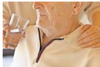
Beschäftigte, die Familienpflegezeit nehmen um Angehörige zu pflegen, können nur mit behördlicher Zustimmung gekündigt werden.

Sobald sie Ihrem Arbeitgeber die Freistellung nach dem Familienpflegezeitgesetz melden, frühestens aber 12 Wochen vor dem angekündigten Termin, darf der Arbeitgeber das Beschäftigungsverhältnis bis zum Ende der Familienpflegezeit nur in besonderen Ausnahmefällen und mit be-