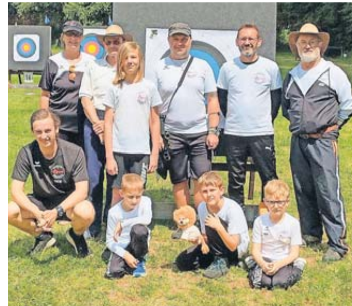
Die Teilnehmer und Betreuer vom BSC-Gronau e.V.

Bogensützen aus dem Bezirk Wetterau an. Dieser hatte zusammen mit dem befreundeten Bezirk Hanau zur diesjährigen Bezirksmeisterschaft Bogen im Freien eingeladen. Der Schießplatz auf dem Vereinsgelände der Bogenschützen des SV Blau-Gelb Hanau ist riesig groß, wie ein Fußballfeld, daher hatten alle Schützen der beiden Bezirke zugleich Platz, so dass die Bezirksmeisterschaft beider Bezirke mit nur einer Veranstaltung durchgeführt werden konnte. Die Wertung erfolgte getrennt nach Bezirken.