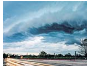
Wann gilt ein Tempolimit „bei Nässe“?

Wann ein Verkehrsschild „bei Nässe“ gilt