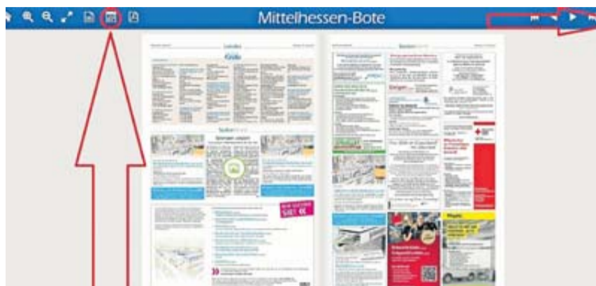
Das E-Paper des BOTEN hat viel zu bieten, wie den Zugriff auf alte Ausgaben über das Kalendersymbol oder die Volltextsuche.

Das funktioniert übrigens nicht nur mit der aktuellen BOTE-Ausgabe, sondern auch mit Seiten aus unserem Archiv: Über das Kalendersymbol können Sie die Ausgaben nach Erscheinungsdatum wählen und so auch Ver-