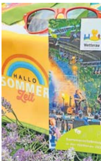
Veranstaltungen in kompakten Flyer zusammengefasst.

Wetteraukreis. Die Wetterau mit Ihren vielen engagierten Menschen lädt zu einer Fülle von Sommererlebnissen ein. Die vielfältigen Veranstaltungshighlights von Mitte Juni bis September sind in einem kompakten Flyer zusammengefasst. Dieser ist in den Tourist-Informationen der Städte, in vielen Rathäusern und an vielen touristischen Anlaufpunkten kostenlos erhältlich. Außerdem finden Sie die Veranstaltungsübersicht auf der Website der TourismusRegion unter tourismus.wetterau.de .