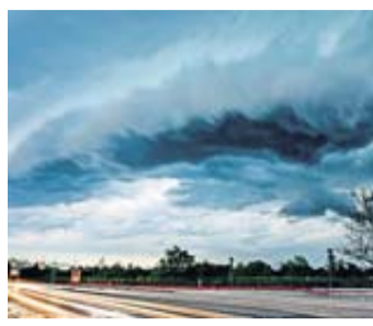
Wann gilt ein Tempolimit „bei Nässe“?

Was heißt nass? Komische Frage? Nein, denn bei Verkehrsschildern wie etwa einem Tempolimit gibt es manchmal ein Zusatzschild: „Bei Nässe“. So gilt das Verkehrszeichen nur dann. Aber wann genau ist eine Straße nass? Unter „nass“ wird nach allgemeiner Rechtsauslegung eine Fahrbahn verstanden, die erkennbar mit einem –