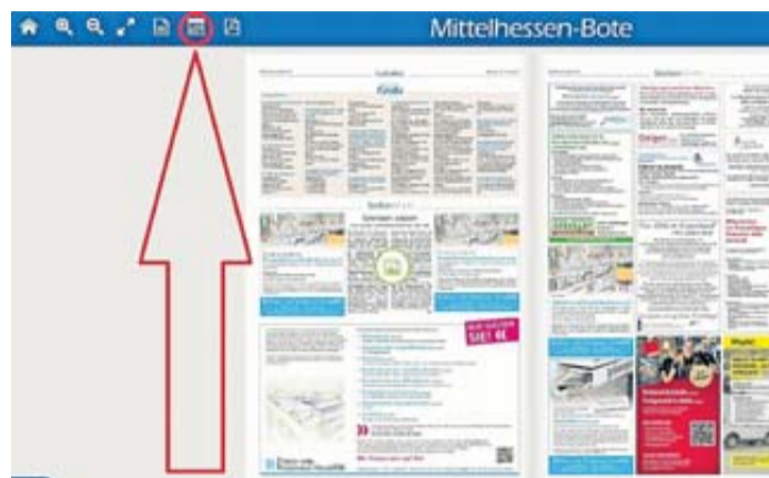
Das E-Paper des BOTEN hat viel zu bieten, wie den Zugriff auf alte Ausgaben über das Kalendersymbol oder die Volltextsuche.