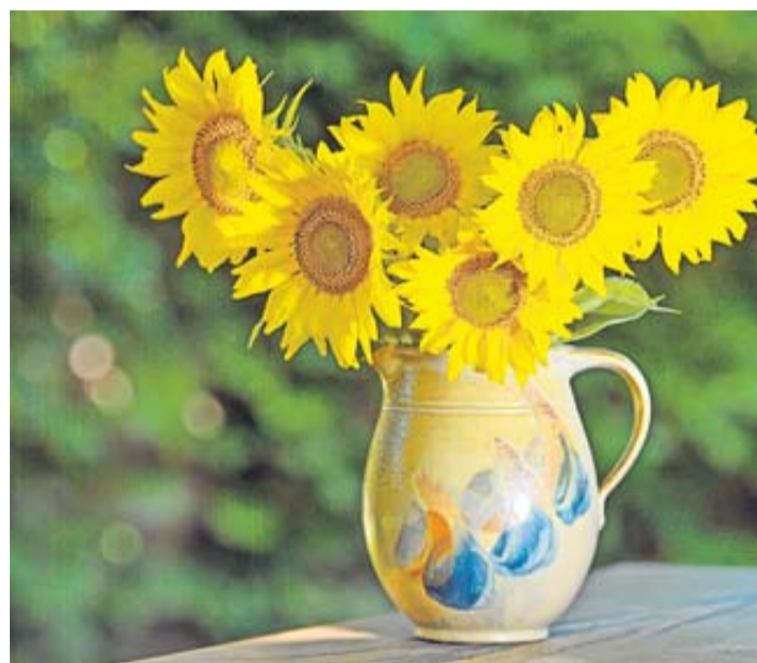
Werden die Stiele der Sonnenblumen nach dem Schnitt kurz in heißes Wasser getaucht, schließen sich die Schnittstellen schneller – und die Blumen halten länger.