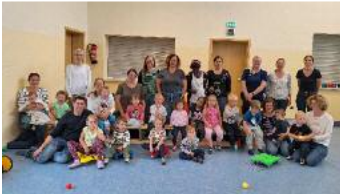
Dort wurden viele Spiele wie Wurf- und Geschicklichkeitsspiele etc. gemacht. Ein Parcours war aufgebaut und war wie immer sehr beliebt.

Am 3.7. fand das Sommerfest des SKC Sotzbach statt. Aufgrund des Dauerregens am Nachmittag wurde das Fest ins DGH Untersotzbach verlegt.