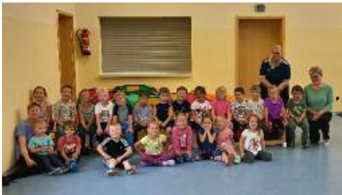
Für die Kleinen gab es ein Bällebad und die Großen übten sich im Stelzen laufen und Rollbrett oder Pedalo fahren. Zur Stärkung zwischendurch hatte der Sport- und Kulturclub mit Obst und Knabberien gesorgt. Vielen lieben Dank geht an die engagierten Damen, die solche Feste ermöglichen. Das Kinderturnen macht jetzt Sommerpause und findet erst wieder nach den Ferien am 28. August statt.