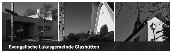
Evangelische Lukasgemeinde Glashütten