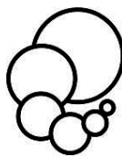
Kulturkreis Glashütten e. V.