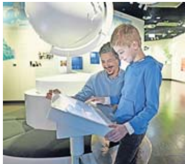
Wissen ist Macht und unbezahlbar: Alles rund um die Finanzen erfährt man beim Besuch des Geldmuseums.

Der Bereich Geldpolitik vermittelt Grundlagenwissen zu den Themen Inflation und Deflation und beantwortet die Frage, warum ein stabiler Geldwert so wichtig ist. Im Bereich Geld global wird das Geld weltweit in den Blick genommen. Wie bilden sich Wechselkurse, seit wann gibt es Finanzkrisen und was bedeutet der Big-Mac-Index sind nur einige der hier behandelten Fragen.