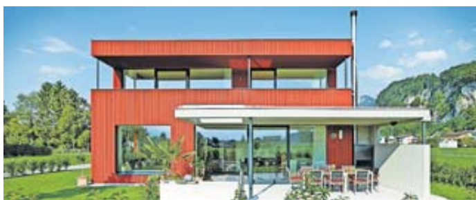
Nicht jede Fassadenfarbe ist überall erlaubt.

Umwelt zu schützen. Pastell- und Naturtöne sind heute für Hausfassaden sehr beliebt. Doch nicht nur das Design des Anstrichs ist wichtig, auch die Qualität der Fassaden-