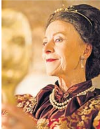
Frau Königin erwartet euch.