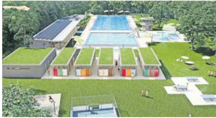
So soll sich das Schlüchterner Freibad ab dem Jahr 2026 seinen Gästen präsentieren, im Vordergrund die bunten Mietkabinen.

Die aktuellen Kosten für die einzelnen Teilbereiche wurden in den vergangenen Monaten sorgfältig ermittelt und belaufen sich demnach regulär auf rund 20 Millionen Euro – eine enorme Summe, die aber nicht in Stein gemeißelt sein dürfe. Der erste Schritt zur Planung einer modernen Badewassertechnik sei bereits erfolgreich von der Stuttgarter Fachfirma IWTI vorgenommen worden. Das Unternehmen werde nun auch den Bau der verschiedenen Becken und vom Keller des Technikgebäudes organisieren. Dieser Schritt sei die Basis für das gesamte Bauvorhaben, betont Möller. Für alles, was dann folgt, sei noch einmal deutlich