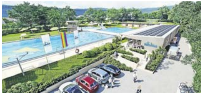
Der Eingangsbereich der Einrichtung wird künftig komplett barrierefrei.

Nach derzeitiger Planung werden die Schwimmbecken bis Sommer 2025 fertiggestellt sein, so dass sie im Herbst erstmals gefüllt werden können. Im Frühjahr 2026 startet ein notwendiger Probetrieb, der im Sommer des Jahres dann abgeschlossen sein soll. „Stand jetzt gehe ich immer noch davon aus, dass wir unser Schlüchterner Freibad für rund 15 Millionen Euro komplett erneuern“, gibt sich der Bürgermeister optimistisch. Es werde ein hartes Stück Arbeit, aber er vertraue auf das Wissen der Partner und seines Teams. Das Ziel sei und bleibe es, das neue Freibad Schlüchtern zu einem besonderen Ort der Erholung und Aktivität für Familien, Kinder und Sportbegeisterte zu machen.