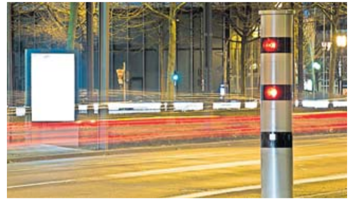
Bei Rot über die Ampel gefahren und geblitzt - das ist gefährlich und kann teuer werden. In schweren Fällen ist auch ein Fahrverbot möglich.

Darf die Behörde kein Fahrverbot mehr verhängen, kann sie aber nicht als Ausgleich das dazugehörige Geldbuße einfach erhöhen. Das zumindest lässt sich aus einem Urteil des Oberlandesgerichts Karlsruhe ableiten (Az.: 1 Rb 36 Ss 778/22). Dazu berichtet die Arbeitsgemeinschaft Verkehrsrecht des Deutschen Anwaltvereins (DAV). Mit einem