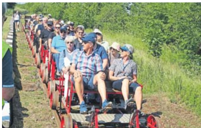
Eine Fahrt mit der Draisine auf einer stillgelegten Bahnstrecke mit allen Mitreisenden.

Förderverein für die Städtepartnerschaften der Stadt Schlüchtern