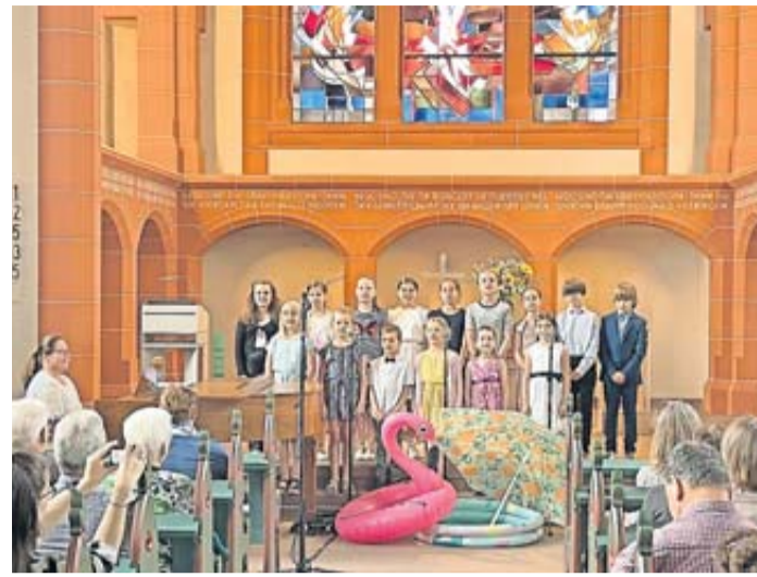
Sommer in der Kirche.

Bad Soden-Salmünster. Mit einem 90-minütigen musikalischen Programm begeisterten die Kinder und Jugendlichen im Alter zwischen 5 und 16 Jahren ihre Gäste in der evangelischen Versöhnungskirche in Salmünster. Die jungen Talente entführten die Zuhörer an Strand und Meer, an absurde genauso wie ganz klassisch mit Johann Strauß' „Donau Walzer“ an bekannte Orte. Die Chorschule – bestehend aus einem Kinder- und einem Jugendchor – lud die Gäste zunächst gesanglich auf ein Eis ein, besang die Ferien oder von Käfern gefürchtete Fledermäuse. Die jeweiligen Chorgruppen hatten aber auch eigene Lieder. Der Kinderchor sang von Sommerhitze oder dem Schaukeln, während die Jugendlichen unter anderem spirituelle englischen Lieder vortrugen. „Die Kinder haben lange und konzentriert für diesen Auftritt geprobt“, berichtet Chorleiterin und Musiklehrerin