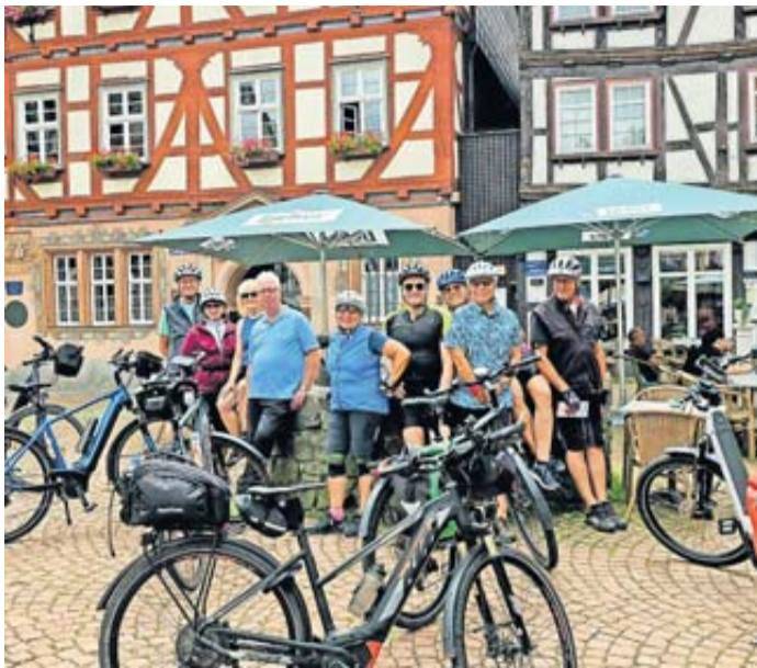
Die Radler der Tour.