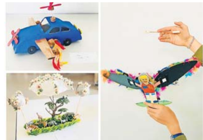
Ein geflügeltes Auto mit Propellerantrieb, eine Barke mit ballonähnlichen Auftriebskörpern und eine geflügelte Figur, die noch die größte Ähnlichkeit mit dem Ikarus-Motiv aufweist: Das Thema „Fliegen“ motivierte die Schülerinnen und Schüler des Jahrgangs 6 zu außergewöhnlicher Kreativität.

achtzig „fantastische Flugobjekte“. Die Freiheit, der eigenen Fantasie freien Lauf zu lassen, stand im Mittelpunkt dieses Projekts. Jedes Produkt ist ein Unikat, das die individuellen Ideen der Lernenden widerspiegelt: Von kunstvoll gestalteten, futuristischen Designs wie schwebenden Schuhen, Betten und Archon bis hin zu kriegerischen Luftschiffen oder in der Dunkelheit leuchtenden Ballons reicherten die Ideen der Sechstklässler. Ausgeklügelte Mechanismen wie solarbetriebene Propeller oder flatternde Federflügel zeugen von einem hohen Engagement im Experimentieren mit handwerklichen Fähigkeiten und einer lebendigen Auseinandersetzung mit wissenschaftlichen Konzepten. Die Flugobjekte konnten am Schuljahresende in einer