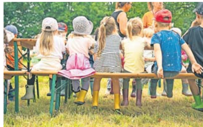
Ein tolles Erlebnis für die Kita-Kinder.

Beim Sackhüpfen, Kartoffellauf, Seifenblasenpusten und Kreidemalen verging die Zeit