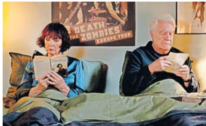
Schauen Sie die Komödie noch vor dem offiziellen Kinostart.

Côte d'Azur. Mit herrlichen Pointen entfaltet Regisseur Ivan Calbérac („Frühstück bei Monsieur Henri“) eine grandiose und sehr romantische Komödie über den dritten und den vierten Frühling im Leben. Eine Revanche à trois voller Situationskomik, die mit viel Humor zeigt, dass kein Alter vor frischer Verliebtheit und später Rache schützt. Der Film startet eigentlich erst am 1. August in den Kinos und kann im Rahmen des Seniorenkinos schon vorab gesehen werden. Der Eintritt zum Seniorenkino beträgt 7 Euro, ein Glas Sekt zur Begrüßung ist darin inbegriffen. Die Tickets sind an der Kasse des Cinepark Karben, Robert-Bosch-Straße 62, erhältlich.