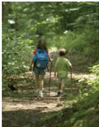
Eine lebenswerte Zukunft braucht effektiven Klimaschutz.

Eine lebenswerte Zukunft braucht effektiven Klimaschutz. Das gilt auch im Blick auf ökologische Nachhaltigkeit. Mit dem Klimabildungsprojekt „Wir und der Wald“ werden Schüler/-innen durch einen spielerischen, praxisorientierten Umgang mit dem Wald, dessen Wert für unser Leben verdeutlicht und anhand alltagstauglicher Beispiele aktiver Klimaschutz sowie die Notwendigkeit zum gemeinsamen Handeln nähergebracht. In vier aufeinanderfolgenden Schulstunden beschäftigen sie sich mit spannenden Fragestellungen rund um den Wald. Begleitet werden sie dabei von lokal ansässigen, unabhängigen und durch die Schutzgemeinschaft Deutscher Wald e. V. (SDW) geschulten Waldpädagoginnen