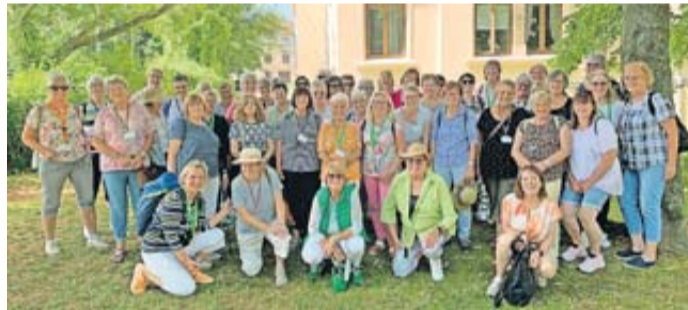
Landfrauen in Wismar.

Anschließend stärkten sich die Teilnehmerinnen am Hafen von Wismar. Mit Blick auf die Hafenanlagen und die vielen Boote ließen sie sich Fischbrötchen schmecken. Bei der folgenden Führung durch die Innenstadt mit seinen monumentalen Kirchen,