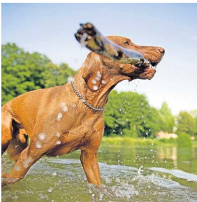
Bietet man dem Hund beim Apportieren ein Stückchen Futter oder eine andere Belohnung als Tausch an, wird er einem das Stückchen gerne überlassen.