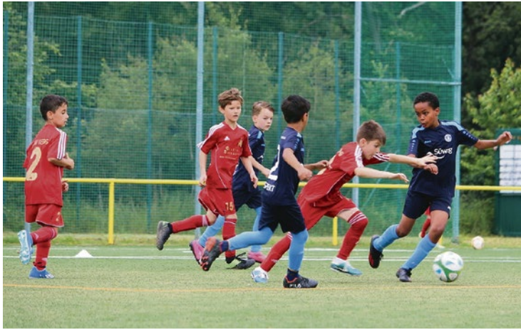
Beim diesjährigen „KickMit-07-Cup“ erlebten die Zuschauer viele spannende Spiele mit vielen Toren.