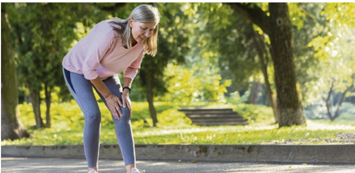
Wenn beim Gehen oder Laufen die Knie schmerzen, kann das die Lebensqualität deutlich einschränken.

aufgesucht werden. Zur Linderung akuter Schmerzen und Entzündungen haben sich nichtsteroidale Antirheumatika (NSAR) wie Ibuprofen bewährt. Genauso wirksam wie Tabletten, aber besser verträglich ist bei entzündungsbedingten Gelenkschmerzen die lokale Anwendung zum Beispiel mit doc Ibuprofen Schmerzgel – mehr Informationen dazu gibt es unter www.doc-gegen-schmerzen.de .