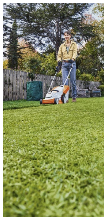
Noch einmal mähen und düngen: So erhält der Rasen die passende Vorbereitung, um gesund durch Herbst und Winter zu kommen.