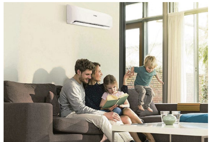
Kühlen Kopf bewahren auch an heißen Tag: Split-Klimageräte sorgen für ein angenehmes Raumklima.

Warentest neben der Kühlfunktion auch die Heizleistung geprüft und eine Außentemperatur zwischen -15 und +12 Grad Celsius simuliert. In diesem Fall benötigte der Testsieger lediglich siebeneinhalb Minuten, um den 25 Quadratmeter großen Prüfraum von 15 auf 20 Grad aufzuheizen. Damit ist die Technik eine gute Wahl, zum Beispiel auch für die Übergangsmonate.