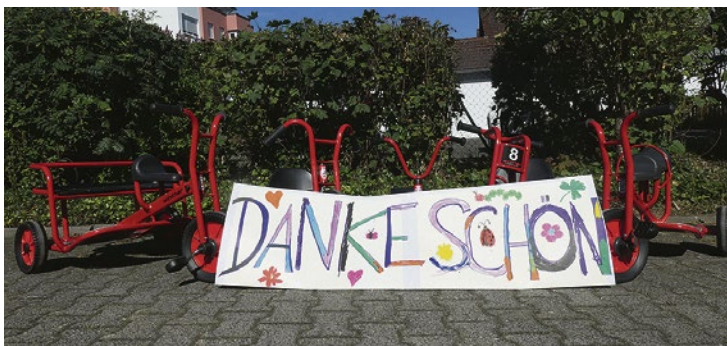
Die neuen "roten Renner" der Kita "Arche Noah" in Wehen.