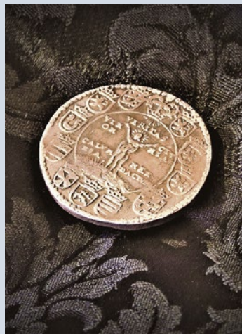
Der Braunschweiger „Wahrheitstaler“ war Teil des Henkerslohns.