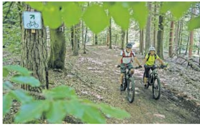
E-Biker im Spessart.

Zu jeder Tour sind die entsprechenden E-Bike-Ladestationen von „Wald erfahren“ gelistet und auch in den Karten verzeichnet. Alle 100 Ladesta-