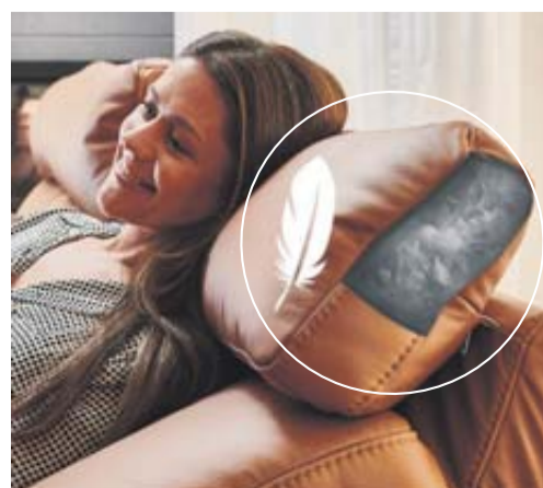
Federleichter Luxuskomfort für Kopf, Wirbelsäule und Rücken

Selbstverständlich. Sich zurücklehnen und die Seele baumeln lassen, dabei können sich unsere Kunden von vielen Komfortfunktionen für maximales Wohlbefinden unterstützen lassen. Unsere Sessel und Sofas können z.B. mit Komfort-Kopfkissen mit Polsterdaune und Topperauflage ausgestattet werden, die den Kopf und Körper sanft umschließen und für ein unvergessliches Gefühl der Geborgenheit sorgen.