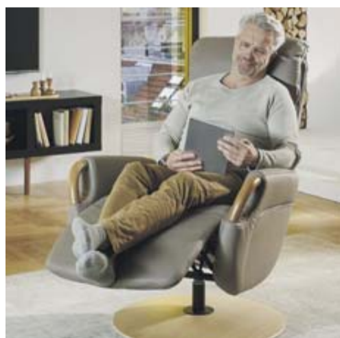
Ganz schön Relaxed: Orthopädika Relaxsessel bieten die perfekte Sitzposition

Eine hochwertige Matratze ist gut, eine individuell perfekte Schlafumgebung ist besser. Wenn maximale Erholung für den Körper das Ziel ist, sollte man auf eine Analyse durch Experten nicht verzichten. Wer gesunden Schlaf sucht, dem helfen Standards nicht weiter. Auf Basis dieser Erkenntnisse lässt sich im Beratungsgespräch bei Polster Aktuell eine Lösung finden, z.B. die Herz-Waage-Funktion ist ein absoluter Gesundheits-Vorteil und schon das Herz sowie den Kreislauf.