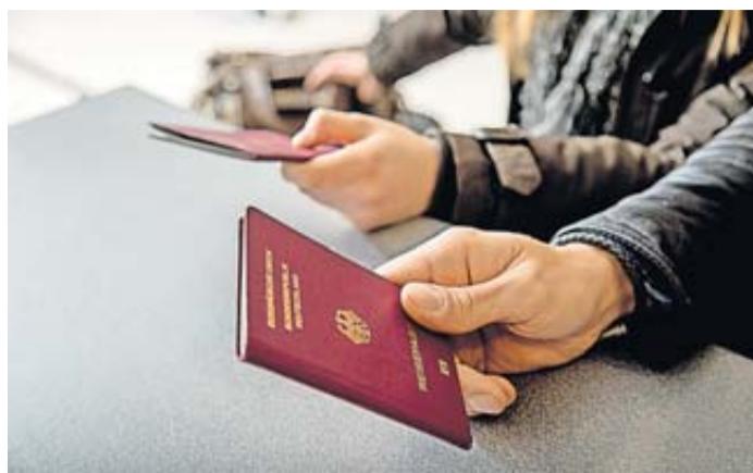
Achten Sie auf die Passnummer! Verwechslungen zwischen O und 0 könnten zu Problemen bei der Einreise oder beim Boarding führen.

O oder 0? Beim Abtippen der Passnummer etwa für eine Einreisegenehmigung oder beim Online-Check-in für den Flug bringen Urlauber das schnell mal durcheinander. Womöglich wird dann der Buchstabe statt der Zahl eingetippt. Doch das ist ein wichtiges Detail, das korrekt sein sollte. Denn sonst könne schlimmstenfalls die Einreise oder das Boarding am Flughafen verweigert werden, warnt die Verbraucherzentrale Nordrhein-Westfalen. Damit das gar nicht erst passiert, können Urlauber sich Folgendes merken: Der Buchstabe O ist wie einige andere - unter anderem A, E oder S - nie Bestandteil einer Passnummer. Gut zu wissen: Bei der Aus-