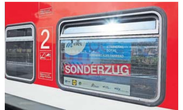
Bei M-net Kinzigal Total kommen wieder mehrere Sonderzüge zum Einsatz. Für den Ein- und Ausstieg sowie in den Zügen selbst werden noch ehrenamtliche Helfer gesucht.

Von der Quelle bis zur Mündung der Kinzig sind dann am „Radlersonntag“ wieder viele tausend Menschen auf dem Fahrrad unterwegs, auf Inlineskates und einige weitere umweltschonende und gesundheitsfördernde Alternativen zum Auto. Eine Traditionsveranstaltung dieser Dimension ist ohne das Engagement von ehrenamtlichen Kräften seit jeher nicht zu stemmen. Neben den teilnehmenden Vereinen und Verbänden, die für Unterhaltung, Bewirtung und Betreuung entlang der Strecke sorgen, sind es auch die Helfer an den Bahnhöfen und in den Zügen, die eine Mit- und Weiterfahrt erleichtern. Der Fachbereich Sport bittet daher wieder um möglichst viele Meldungen.