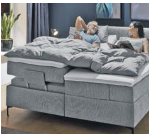
Gesundheits-Vorteil: Die Herz-Waage-Funktion sorgt für maximale Entspannung

Im Idealfall gehen Sie mit dem Wissen nach Hause, dass sie ihrem Körper auch beim Entspannen zuhause viel Gutes tun können. Weil es Möbel gibt, die von Wissenschaftlern, Ingenieuren und Designern genau dafür entwickelt werden. Auf unserer Gesundheitsmesse können unsere Gäste in entspannter Atmosphäre eine Analyse und Beratung durch unsere Experten nutzen. Und dabei unsere aktuellen Innovationen kennenlernen.