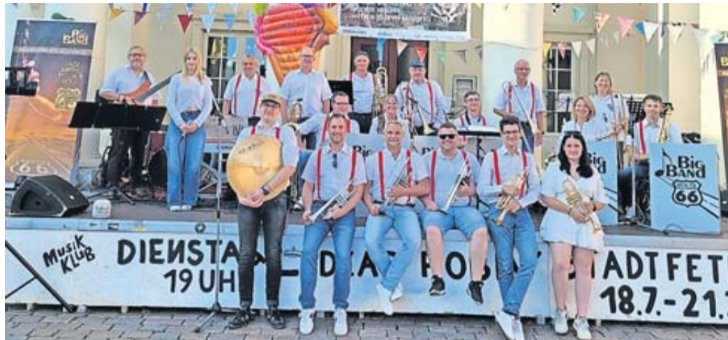
Die Big Band in Schwerin.

Route 66 eine Woche lang auf Sommertournee