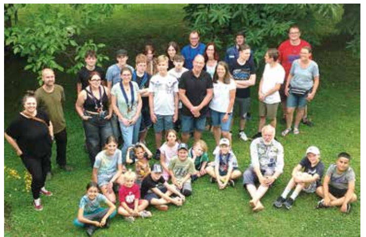
„Endlich Ferien!“ – das musste natürlich gefeiert werden. Die evangelische Pfadfinder-Familie Wächtersbach versammelte sich dazu im „Pfadfinder-Garten“ in der Friedrich-Wilhelm-Straße, der schon viele Spiele-Runden und Kindergeschrei kennt. Diesmal erfüllte zusätzlich der Duft nach Gegrilltem und der Rauch eines zünftigen Lagerfeuers den Garten. Pfadfinder, Betreuerinnen und Betreuer und die Eltern genossen die Sonnenpause nach den vielen Regentagen, spielten, aßen und tranken und tauschten sich aus. Mit einem gemeinsamen großen Abschlusskreis und dem gesungenen: „Nehmt Abschied, Brüder, ungewiss ist alle Wiederkehr“ wurden alle in die schönen schulfreien Wochen des Jahres entlassen.