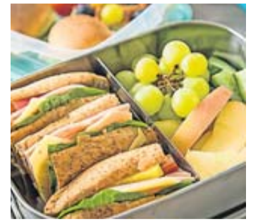
Der perfekte Reiseproviant sollte einfach zu essen sein.

Einen Frische-Kick von Innen versprechen Obst- oder Gemüseportionen. Dafür taugen Schnitze von Äpfel und Birnen oder Weintrauben und Heidel-