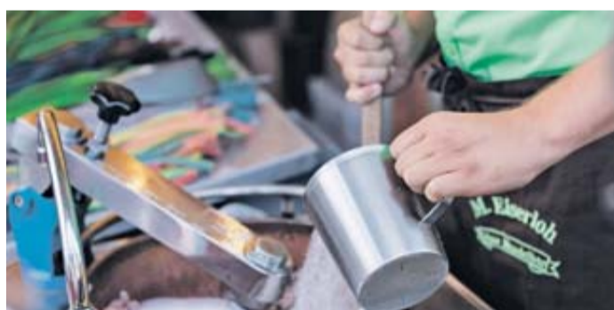
Eine Kunst für sich: Mandelbrennen und Popcornzubereitung bei der Familie Eiserloh.

Es blinkt, es leuchtet, es riecht lecker nach allerlei Köstlichkeiten und die Getränke sind schön kühl. Dazu spielt Musik, die Karussells drehen sich und man hört fröhliches Lachen. All das verbindet Menschen mit Jahrmärkten und Volksfesten. Aber wie sieht das Ganze eigentlich hinter den Kulissen aus? wNach der gelungenen Premiere im vergangenen Jahr