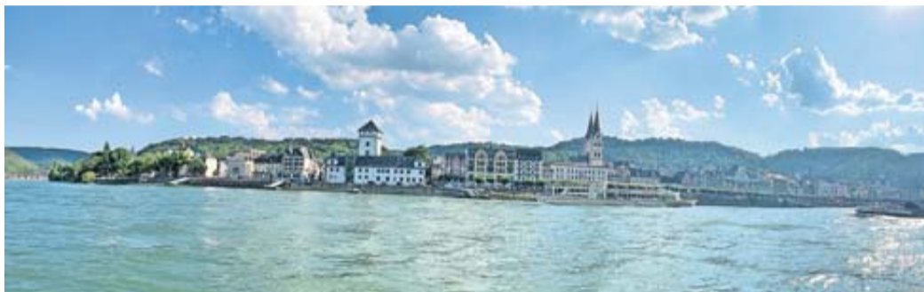
Auf diese Ansicht können sich die Teilnehmer vom Rhein aus freuen. Boppard ist das Ziel der diesjährigen Seniorenfahrt.

Seniorenfahrt am 5. September führt zum Rhein