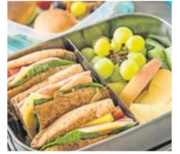
Der perfekte Reiseproviant sollte einfach zu essen sein.

Einen Frische-Kick von Innen versprechen Obst- oder Gemüseportionen. Dafür taugen Schnitze von Äpfel und Birnen oder Weintrauben und Heidel-