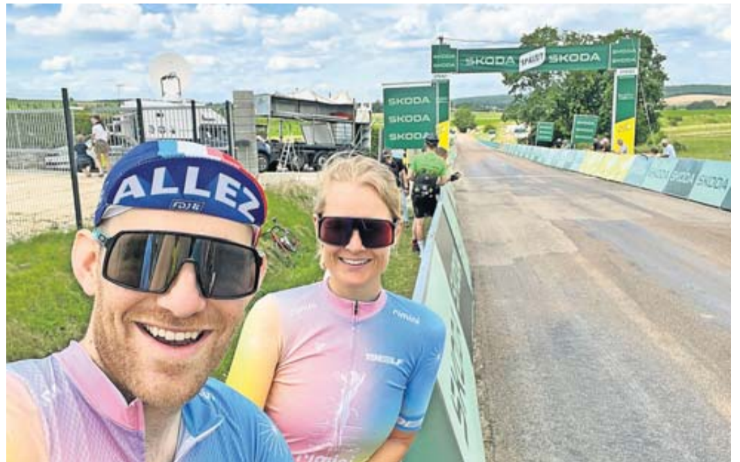
Die zwei Rennradler Radsportvereins 1911 Rosbach.

Dijon kamen noch das Einzelzeitfahren an Tag 7, eine Flachetappe an Tag 8 und die mit Gravelpassagen gespickte Etappe 9 hinzu.