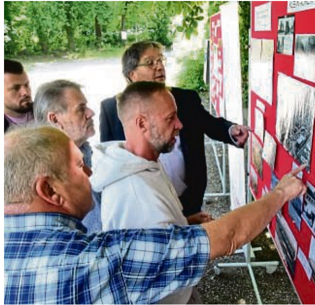
Anhand historischer Bilder wurde die Entstehung nachgezeichnet.

Einige Mieter leben seit der Fertigstellung in den Wohnungen, die Fluktuation sei sehr gering, informierte das Vorstandsmitglied, und Kündigungen aufgrund von Eigenbedarf seien ausgeschlossen. Die Arbeit des Führungsgremiums habe das Ziel, „einen lebendigen Stadtteil“ mitzugestalten, Geschichte und Moderne in einem Ort mit Tradition zu verbinden und keinen Sanierungsstau entstehen zu lassen. Leiterin