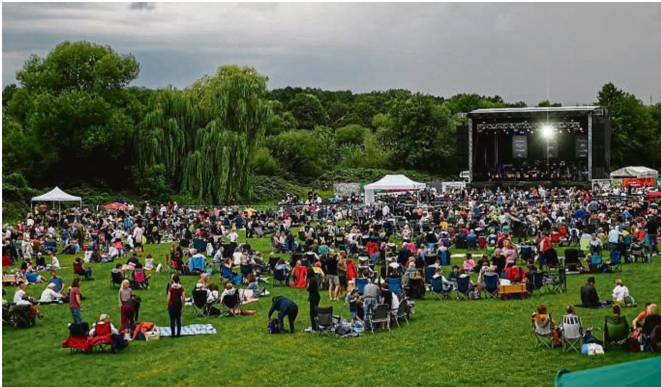
Im vergangenen Jahr fand die Sommernacht erstmals auf den Mainwiesen unterhalb von Schloss Philippsruhe statt. Auch 2024 wird die beliebte Veranstaltung wieder dort gefeiert, mit hoffentlich besserem Wetter.