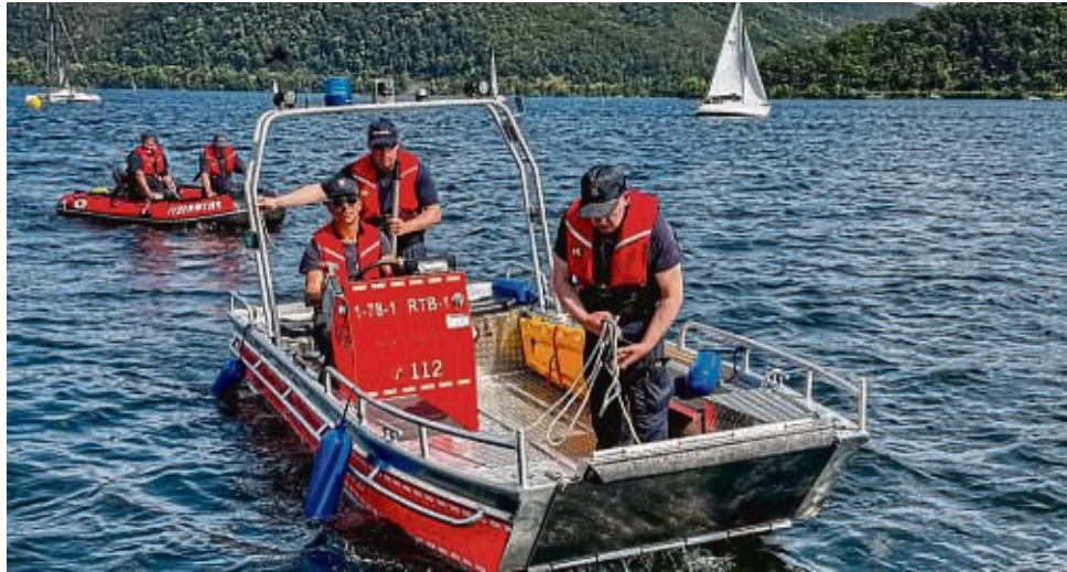
Bei einem ersten Termin konnten auf dem Edersee bereits zahlreiche Bootsführer der Selbolder Wehr in die Technik der neuen Boote eingewiesen werden.

Das Ergebnis der Überlegungen sind zwei Boote mit unterschiedlichen Einsatzzwecken. Zum einen ein Luftkielboot mit tragbarem Außenbordmotor mit fünf PS