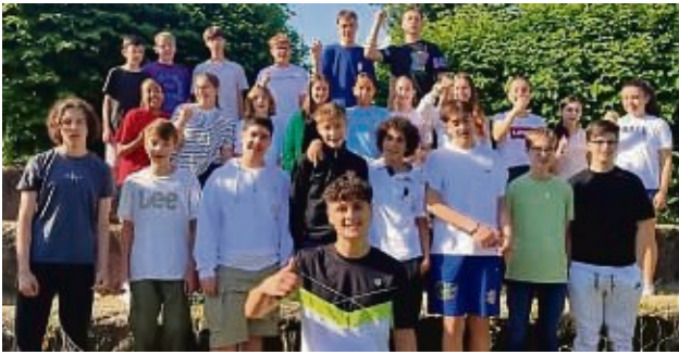
Die Schüler der Spanischklasse 8Ga der „Otto“ haben ein Rap-Video gedreht.