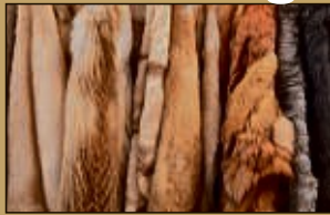
Pelze aller Art

Gerne übernehmen wir Ihre Spritkosten bis €50,-