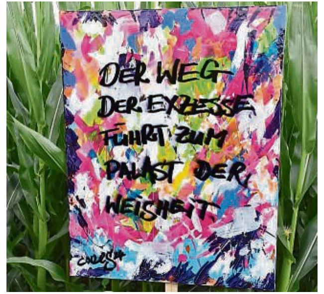
Das Team der Kinder- und Jugendförderung der Stadt zeigt Kunstwerke von Jugendlichen. Sie demonstrieren so ihre Solidarität mit Menschen, die unter Gewalt oder Diskriminierung leiden. Auf einem Bild ist der Spruch zu lesen: „Der Weg der Exzesse führt zum Palast der Weisheit.“