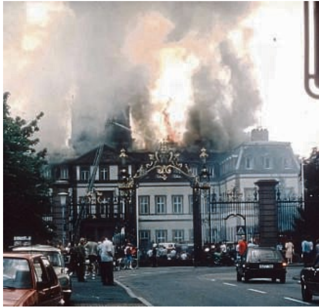
Weithin sichtbar ist am 7. August 1984 die schwarze Rauchfahne über dem Schloss Philippsruhe. Bei dem Feuer entstanden Schäden in Millionenhöhe.

40 Jahre nach dem verhängnisvollen Ereignis erinnern die Städtischen Museen Hanau mit einem Filmabend am Mittwoch, 7. August, an Brand und Wiederaufbau. Gezeigt werden Aufnahmen, die die Hanauer Dr. Helmut