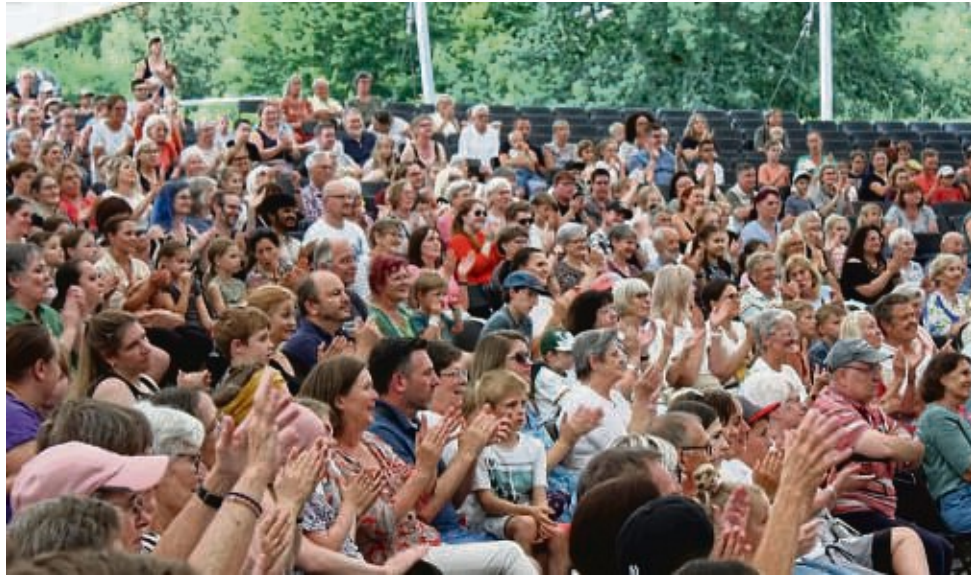
Mit wedelnden Händen applaudieren die gehörlosen Zuschauer dem Ensemble und den Gebärdendolmetscherinnen.