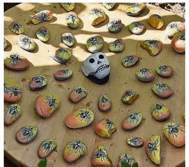
Die Installation „Bee loved“ von Christoph Goy wendet sich gegen das Bienensterben.

Weitere Veranstaltungen des Freundeskreises Hof Buchwald sind der „Bunte Markt“ am 11. August und das Open-Air-Kino am 24. August um 20.15 Uhr (Start mit dem Film „Barbie“ und um 22.30 Uhr mit „Bohemian Rhapsody“). Am 7. September ist eine „Nacht im Labyrinth“ geplant. Das Mais-Labyrinth ist bis 8. September geöffnet. Der Eintritt ist frei. gia