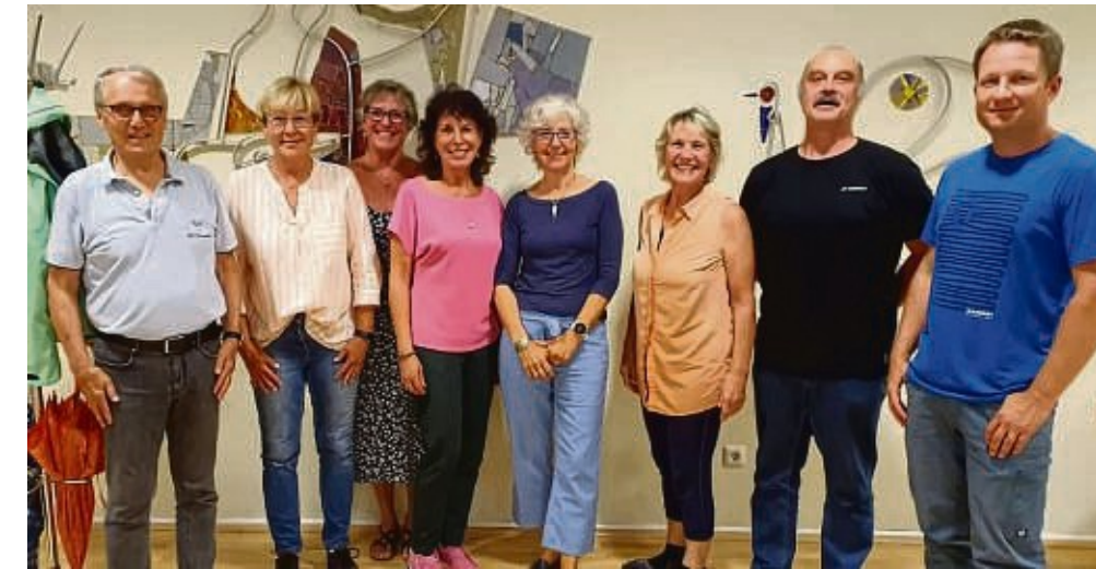
Darf optimistisch nach vorn blicken: der neugewählte Vorstand des TV Hochstadt.

Zwischenzeitlich müssen einige Gruppen sogar Warteliste führen. Und der Verein sucht immer qualifizierte