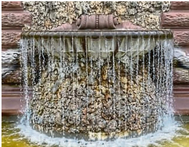
Beliebtes Fotomotiv: Der Brunnen an der Parkseite von Schloss Philippsruhe stammt aus dem Jahr 1879.

Landgraf Friedrich Wilhelm II. von Hessen-Kassel-Rumpenheim und seine Gemahlin Anna, eine geborene Prinzessin von Preußen, starteten 1875 eine große Umbau- und Modernisierungsphase für ihre Residenz Schloss Philippsruhe. Federführend war der führende dänische Architekt des Historismus, Ferdinand Meldahl (1827-1908). Auch die Parkseite des Gebäudes wurde umgestaltet. An der Substruktions-