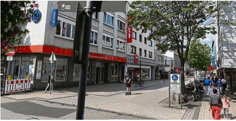
Ein versenkbarer Poller soll in der Nürnberger Straße auf Höhe der Hirschstraße installiert werden. Bislang gibt es zwei dieser Anlagen in der Innenstadt.