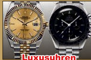
Luxusuhren aller Art