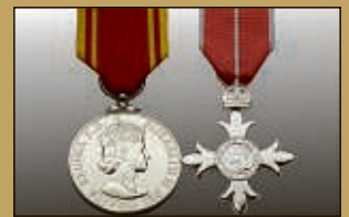
Medaillen / Orden

Kostenlose Begutachtung und Bewertung von: Schmuck und Edelsteinen