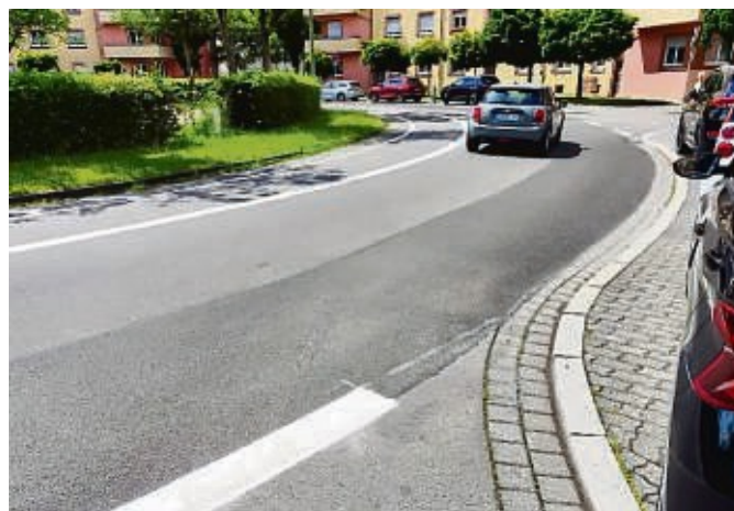
Die neue Markierung am Beethovenkreislauf und der weggefrästene Schutzstreifen für Radfahrer.

Weshalb aber der Schutzstreifen für Radfahrer deswegen geopfert werden musste, erschließt sich erst durch die