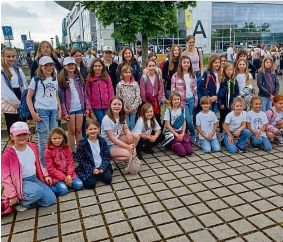
Tolles Erlebnis: Die Tönchen und Teenie Singers des Volkschors Langenselbold haben in Mannheim an der Konzertveranstaltung „6K United“ teilgenommen.

17.30 Uhr mit Zuhörern füllte, hatten die Kinder Gelegenheit, sich etwas zu stärken oder auch zu versuchen, ein Autogramm von den anwesenden Musikern zu erhaschen. Pünktlich um 19 Uhr startete das Konzert. Auf dem