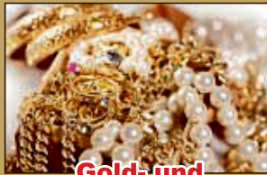
Gold- und Silberschmuck