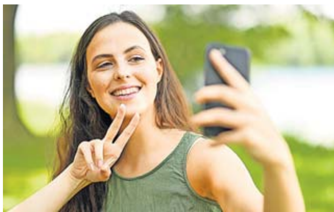
Digitale Urlaubsgrüße: Knapp die Hälfte der Befragten nutzt dafür Social Media wie Instagram oder Facebook.