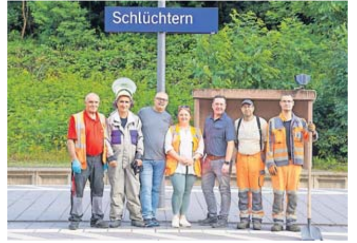
Putzaktion am Schlüchterner Bahnhof.