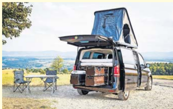
Fast schon wie ein richtiges Wohnmobil: Die flexiblen Campingmodule lassen sich zwar je nach Geldbeutel umfangreich gestalten, aber für den Alltagsbetrieb wieder ausbauen.