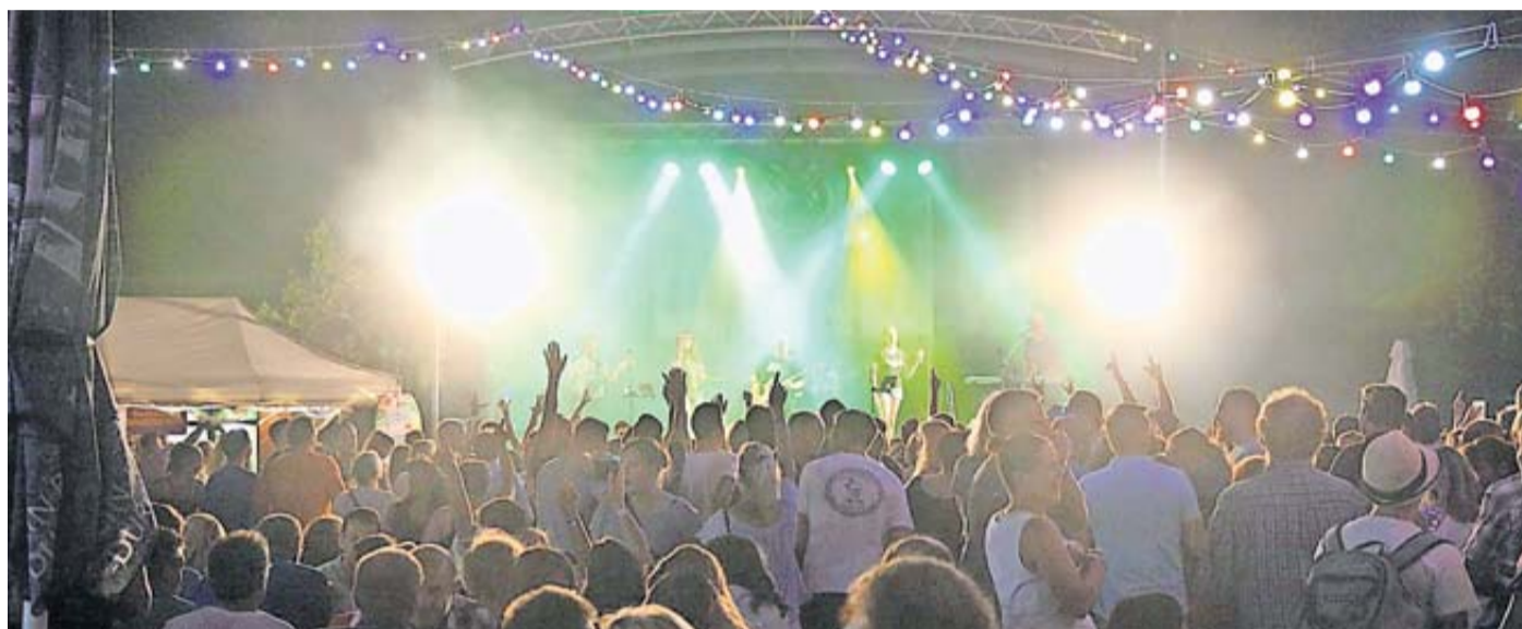
Bald ist endlich wieder soweit: Rosbach feiert sein traditionelles Schwimmbadfest.

Rosbach. In diesem Jahr ist es nun endlich wieder soweit: Rosbach feiert sein traditionelles Schwimmbadfest in altbewährter Form am letzten Wochenende der Sommerferien! Der Magistrat der Stadt Rosbach v. d. Höhe veranstaltet zusammen mit den Rodheimer Weihnachtsmännern und der Tanzgarde Rodheim ein buntes, spaßiges Schwimmbadfest im neu renovierten Freibad in Rodheim. Ab 11 Uhr können sich Groß und Klein am Samstag, den