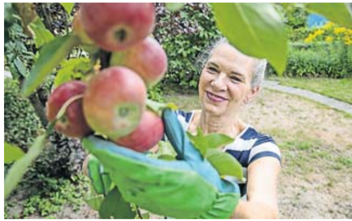
Frühäpfel können nicht lange gelagert werden, also lieber schnell ernten und essen.

Kartoffeln keimen schnell, daher ist laut Gottfried Röll eine dunkle und kühle Lagerung ideal - aber nicht unter 4 Grad Celsius. Das Knollengemüse mag es eher trocken. Verletzte Kartoffeln neigen zu Schimmelbildung, daher sollten Ernte und Transport vorsichtig er-