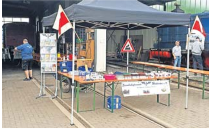
Die EFW möchte, am Tag der offenen Tür, Besuchern den Verein näherbringen, über die Arbeiten informieren und sie kulinarisch verwöhnen.

Einen kurzen Einblick in die Historie: Ende der 1970er Jahre war die Modellbahnanlage im neuen Vereinsheim in Bad Nauheim bald Opfer einer Zerstörung Opfer, sodass anschließend nur noch wenig gefahren wurde und die Idee eines Museumszuges wuchs. Um die Resonanz auf einen solchen Zug auszuprobieren wurde in Kooperation mit der Museums-Eisenbahn Darm-