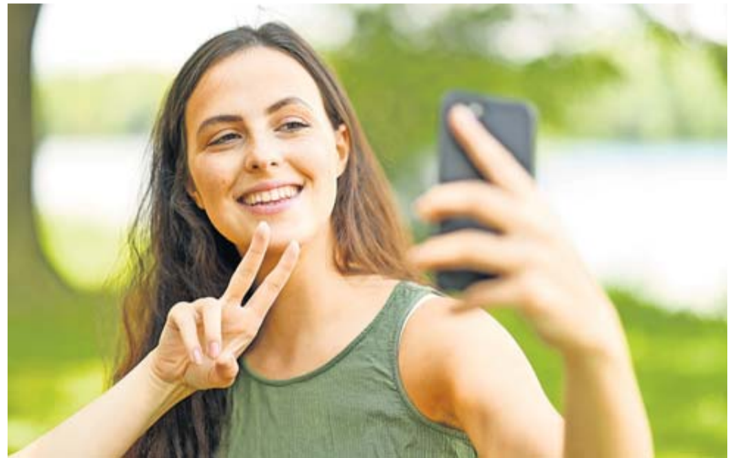
Digitale Urlaubsgrüße: Knapp die Hälfte der Befragten nutzt dafür Social Media wie Instagram oder Facebook.

Viele melden sich bei ihren Liebsten aus dem Urlaub. In diesen Sommer greift die Mehrheit in Deutschland dafür zum Hörer. Jeweils 70 Prozent der Menschen über 16 Jahren, die einen Urlaub planen, rufen dafür aus den Ferien an. Oder sie schicken eine Nachricht via Messenger. Das geht zumindest aus einer repräsentativen Umfrage von Bitkom Research hervor.