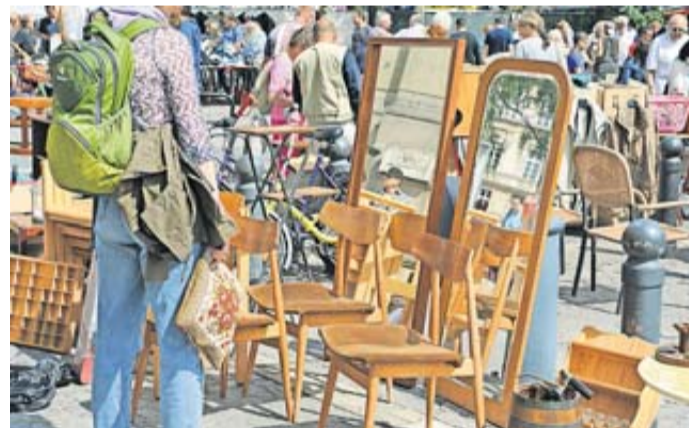
Der Vorteil auf dem Flohmarkt: Sie können sich das Möbelstück direkt ansehen – und oft auch den Preis verhandeln.