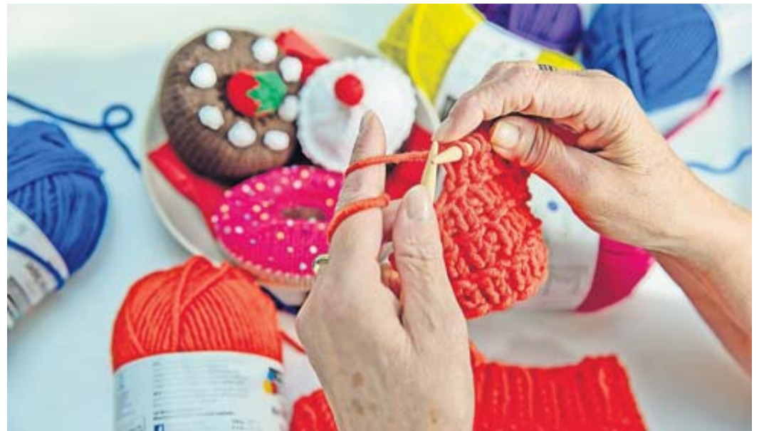
Hobbys fördern die körperliche, geistige und soziale Beweglichkeit.

Drei Gründe, warum Hobbys im Alter gut tun