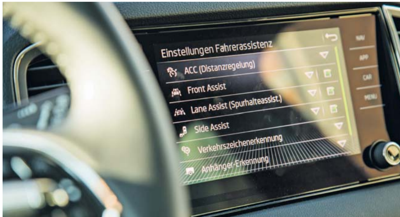
Moderne Fahrzeugsysteme erhöhen die Sicherheit im Straßenverkehr. (zu dpa: „Schon bei Probefahrt auf Assistenzsysteme achten“)

Doch in bisherigen Tests hat der ADAC auch regelmäßig Schwächen solcher Systeme festgestellt. Blind verlassen sollte man sich daher nicht auf sie. So berichtet der Autoclub, dass etwa Spurhaltesysteme in manchen Situationen gegen den Wunsch des Fahrers arbeiten oder