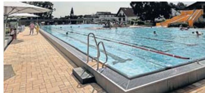
Das Rodheimer Freibad.

meister Steffen Maar. „Die Entscheidung ist uns leichtgefallen, denn die Wetterbedingungen sind perfekt und die Nachfrage nach der Verlängerung ist groß.“ Die Stadt lädt alle Bürger herzlich ein, die verlängerte Freibadsaison zu nutzen und noch ein paar erholsame Stunden im Wasser zu verbringen.