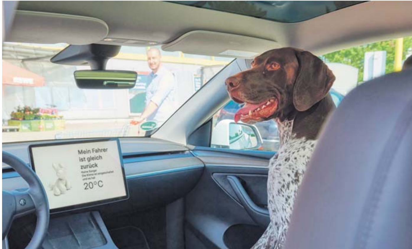
Im Testlabor haben die Experten des ADAC-Technikzentrums getestet, wie gut der spezielle Klimaanlagenmodus in der Praxis funktioniert.

An Sommertagen im aufgeheizten Auto warten - das kann ziemlich schnell unangenehm werden. Und schlimmstenfalls gefährlich. Gerade auch für Hunde, die immer wieder im Auto gelassen werden, wenn ihre Besitzer kurz was besorgen müssen. Elektroautos haben hier einen Vorteil: Dem ADAC zufolge haben fast alle eine Standklimatisierung und lassen sich deshalb auch im abgestellten Zustand temperieren. Hersteller wie Tesla, Smart oder Nio gehen sogar noch weiter und erweitern die Klimaanlage um einen sogenannten Haustier- oder Hundemodus. Das abgestellte Fahrzeug hält laut dem ADAC dann nicht nur die Temperatur, sondern informiert Passantinnen und Passanten über eine Anzeige auf dem großen Zentraldisplay darüber, dass das Tier in einem klimatisierten Auto sitzt - so dass sie nicht die Polizei rufen oder kurzerhand die Scheibe einschlagen. Keine Frage: Für Menschen mit Hund, die nur kurz einen Einkauf erledigen wollen, kann diese Klimaanlage