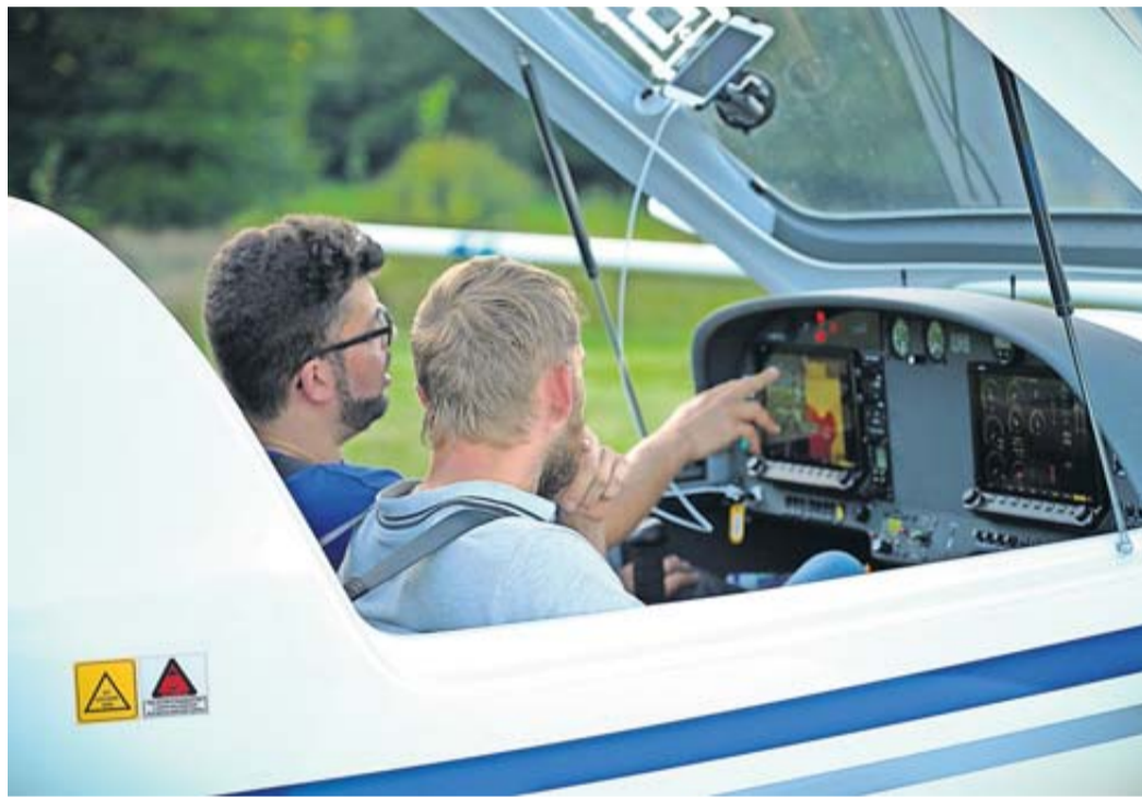
Der Aero-Club Butzbach lädt zum Infotag ein – am 8. September.

Butzbach. Einmal dem Himmel näher kommen, selbst ein Flugzeug in die Luft und wieder sicher zu Boden bringen – wer kann sich dieser Faszination aus Kindertagen entziehen? Neben einer (für viele unerreichbaren) beruflichen Karriere bei einer Airline bieten Luftsportvereine wie der Aero-Club Butzbach die Möglichkeit, sich den Traum vom Fliegen – und dem eigenen Pilotenschein – zu erfüllen. Bereits ab 13 Jahren ist es möglich, mit dem Erwerb der eigenen Segelflugglizenz zu beginnen. Diese ist für viele junge Menschen jedes Jahr der Einstieg in die Fliegerei und ermöglicht später einen einfachen, fließenden Übergang in die Motorfliegerei – sofern gewünscht, denn viele lässt die Faszination des „Fliegens ohne Motor“ nicht mehr los. Auch die Bandbreite motorgetriebener Luftfahrzeuge ist in Flugvereinen wie dem Aero-Club Butzbach groß: Neben Motorseglern stehen auch Ultraleicht- und Leichtflugzeuge verschiedenen Typs zur Verfügung, deren Nutzung unterschiedlicher Pilotenlizenzen bedarf.