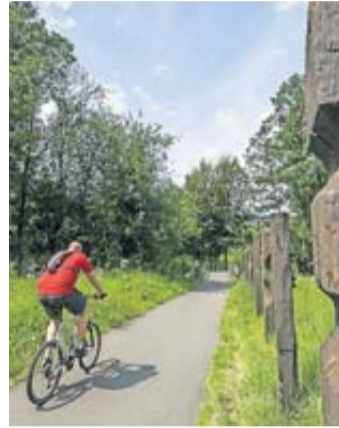
Radfahren im Wetteraukreis.

Auf dem Programm stehen beispielsweise fachliche Vorträge zu den Themen „Entwicklung des Radverkehrs im Wetteraukreis“ (Fachstelle Strukturförderung des Wetteraukreises), „Radwegeplanungen des Bundes und des Landes“ (HessenMobil) oder „Umsetzung von Radverkehrsfördermöglichkeiten“ (Stadt Butzbach). Abgerundet wird die Konferenz wie gewohnt durch den „Regionalen Marktplatz“, an dem sich die Besucher über verschiedene Themen zur nachhaltigen, sicheren und intelligenten Mobilität informieren und mit den Referentinnen und Referenten austauschen können.