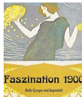
„Faszination 1900 - Belle Époque und Jugendstil“.

Besucherinnen und Besucher erlebbar. Die Ausstellung ist vom 7. September bis 27. Juli 2025 jeweils von Dienstag bis Sonntag in der Zeit von 13.30 bis 17.30 Uhr geöffnet (außer am ersten Wochenende im Monat, Freitag bis Sonntag).