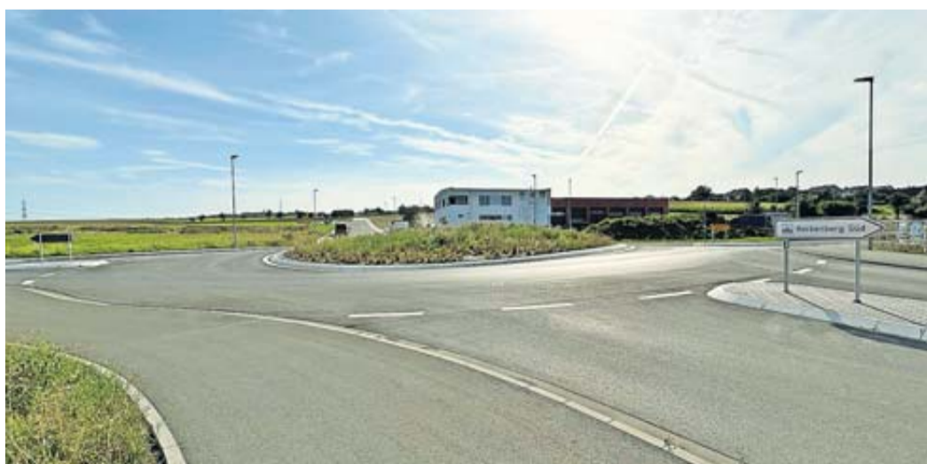
Der neue Kreisverkehrsplatz zwischen Rockenberg und Oppershofen heißt künftig „Sandrosenkreisel“.

Der neue „Sandrosenkreisel“ zwischen Rockenberg und Oppershofen