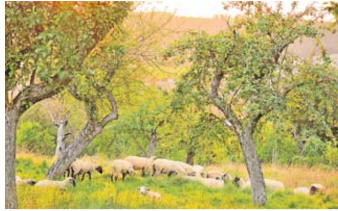
Die traditionelle Beweidung mit Schafen trägt zur Pflege der artenreichen Streuobstwiesen bei und fördert die biologische Vielfalt im Wetteraukreis.

Interessierte sind eingeladen, sich auf eine Entdeckungsreise durch das Naturschutzgebiet zu begeben und dabei mehr über die verschiedenen Aspekte des Naturschutzes und der traditionellen Landnutzung zu erfahren. Die Teilnehmerinnen und Teilnehmer erhalten einen umfassenden Überblick über die Besonderheit des Gebiets, darunter die wunderschönen Streuobstwiesen, die artenreichen Magerrasen und die traditionelle Schafbeweidung. Streuobstwiesen, kombiniert mit artenreichem Grünland zu Füßen