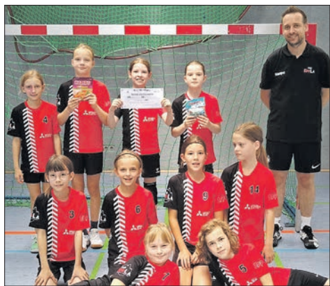
Die Mädchen der E1-Jugend beim Hexencup.

Am kommenden Samstag, 7. September, darf das Team der weiblichen E-Jugend im Finale der Mini-Handball-Championships in Wallau gegen die sieben besten Teams aus Hessen antreten und freut sich auf viel Unterstützung.