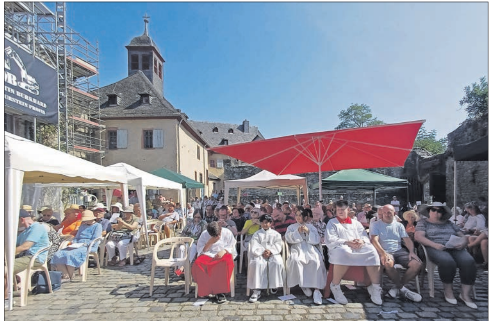
Bei strahlendem Sonnenschein feierten Katholiken aus Eppstein, Hofheim und Kriftel gemeinsam ihre Pfarreimesse in den geschichtsträchtigen Mauern der Burg.

Sonntag: Um 10 Uhr beginnt das große Kinderfest in der Altstadt im Rahmen des Weinfestes. Um 10.30 Uhr startet die SPD Eppstein zur Genuss-Radtour an der Aulthalle in Niederhausen. Angebote zum Tag des offenen Denkmals: Herbstmarkt auf der Burg (12 bis 17 Uhr) mit Kräuternernte. Von 13 bis 18 Uhr öffnet der Heimatverein Bremthal das Backhaus und backt Kuchen. Um 15 und 17 Uhr Führung in der St. Michael-Kirche Ehlhalten . Abschluss um 18 Uhr mit Dämmerchoppen an der Kirche.