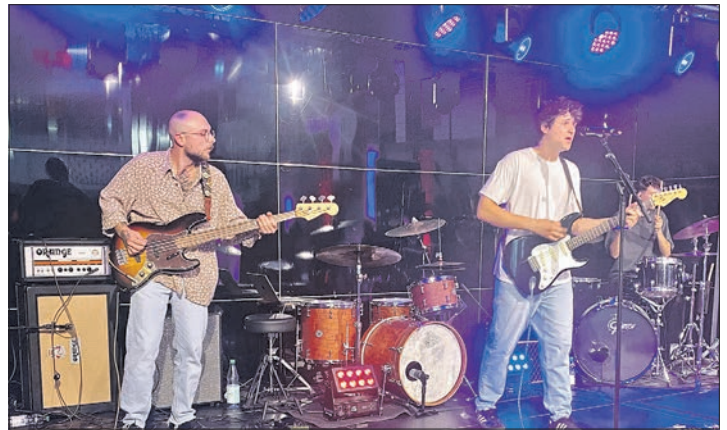
Die Band Cloudcastle aus Königstein trat auch beim ersten Indi-Pop-Festival in Bremthal auf.

Das Festival wollte ein Zeichen für mehr Vielfalt und Liebe setzen und war ein klares Bekenntnis gegen Diskriminierung und Ausgrenzung. Die Slogans waren auch auf den zahlreichen Transparenten, die im großen Veranstaltungssaal auf „Botanical“ aufgehängt waren, zu lesen. Das Team von „Botanical“ bot neben kühlen Getränken an diesem sehr warmen Abend auch Verpflegung zu fairen Preisen an: Curry- und Bratwurst, Potato Wedges und Hamburger und Veggie Burger standen auf