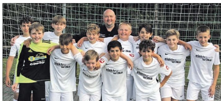
Die D1-Jugend-Fußballer der JSG Bremthal/Niederjosbach freuen sich über Platz 3 im Turnier.

Am kommenden Wochenende, kurz vor dem ersten Ligaspiel, veranstaltet die D1 der JSG Bremthal/Niederjosbach ein Trainingslager in Oberreifenberg. „Hier bleibt noch etwas Zeit für Nachbesserungen“, analysiert das Trainerteam Beyler/Wagner.