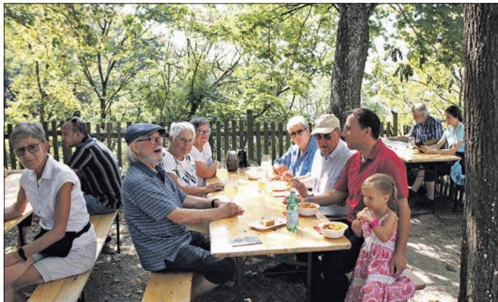
Unter den Bäumen am Kaisertempel ließ es sich am Sonntag gut aushalten.

Etliche Stammesbesucher und Neu-Eppsteiner sowie Wandergruppen verschlug es an diesem Sonntag nicht zufällig an dieses Plätzchen. Dennoch kritisierte Sabine Stieglitz aus Lenzhahn: „Leider wurde nicht genügend Werbung