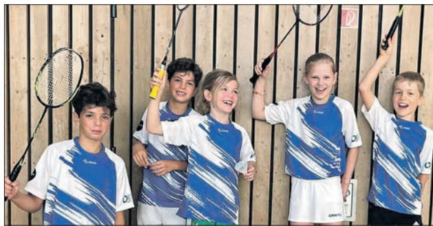
Die U11-Mannschaft nach ihrem 6:0-Auftaktieg