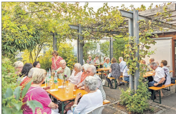
Unter der mit Reben bewachsenen Pergola am Emmaus-Gemeindezentrum ließ es sich gut aushalten.

Das Sommerfest der Emmausstiftung hat sich zu einem festen Ort der Begegnung entwickelt, an dem Gemeindemitglieder, Stifterinnen und Stifter sowie Freunde und Nachbarn der Gemeinde feiern – über alle Altersgruppen