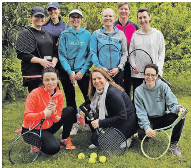
Den Aufstieg frühzeitig fest gemacht: Die Damen 40 des TC 71 spielen in der kommenden Saison in der Bezirksoberliga.