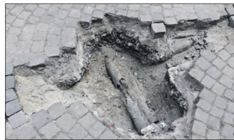
Bis auf das Loch mit der gekappten Leitung haben die Glasfaser-Arbeiter das Pflaster der Hintergasse wiederhergestellt.