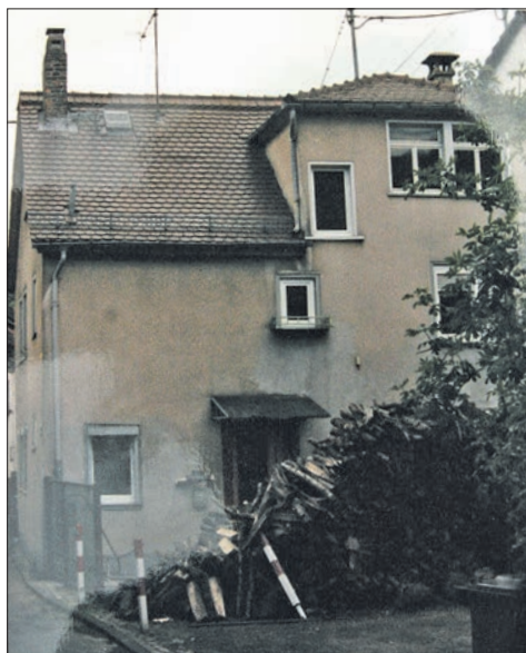
Die Hintergasse 8 um 1993.