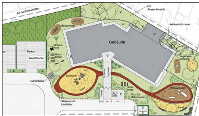
Entwurf zur Freifläche Kita An der Embsmühle und Ausschnitt des Planes. Stadt Eppstein

Die Planung sieht auch Flächen vor für etwa 28 Parkplätze neben und vor der Kita sowie Fahrradabstellflächen – mehr als nach der Stellplatzsatzung hergestellt werden müssten, betont Simon, der zugleich Baudezernent ist. Die Spielflächen werden den geltenden Regeln entsprechend für die Gruppen unter und über drei Jahre getrennt. Bei der Ausstattung des Außengeländes soll die Historie des Gebietes