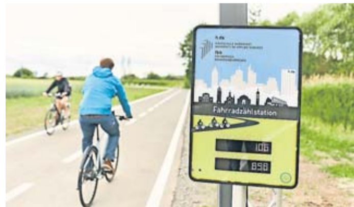
Insgesamt 25 Zählstellen wurden 2022 im Wetteraukreis installiert.

Fünfundzwanzig dieser Zählstellen liegen im Wetteraukreis. Die Spannweite der jährlich gezählten vorbeifah-