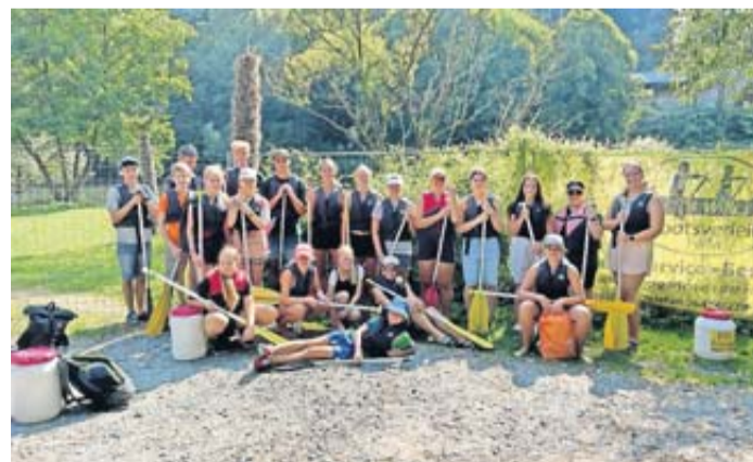
DLRG Jugend Dorheim bereit für ein Abenteuer auf dem Wasser, mit Paddeln in der Hand und Sonne im Gesicht.

Friedberg. Am vergangenen Wochenende erlebte die DLRG Jugend Dorheim ein aufregendes Abenteuer auf der Lahn. Bei bestem Wetter und guter Laune starteten die jungen Teilnehmer ihre lang ersehnte Kanutour, die ihnen noch lange in Erinnerung bleiben wird. Bereits am frühen Morgen versammelten sich die Jugendlichen am Friedberger Bahnhof, um mit Bus und Bahn an die Lahn zu starten. Nach einer kurzen Einführung in die Sicherheitsvorkehrungen und einer Demonstration der Paddeltechniken ging es endlich los. Die Kanus glitten sanft über das Wasser und die Teilnehmer konnten die idyllische Landschaft und die friedliche Atmosphäre genießen, die ab und zu von einer Wasserschlacht durchbrochen wurde.