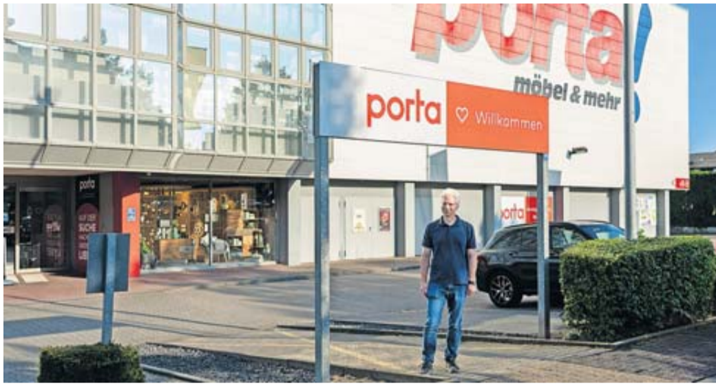
Die Neuausrichtung des Standorts ist eine Antwort auf die zunehmenden Herausforderungen des stationären Einzelhandels.

Porta plant, die Attraktivität des Standortes durch moderne Warenpräsentation und die Ergänzung mit verschiedenen Fachmärkten sowie gastronomischen Einrichtungen zu steigern. Zu den geplanten Einzelhandelsangeboten gehören unter anderem ein Lebensmittel-discounter, ein Zoofachmarkt und entweder ein Einrichtungsfachmarkt oder ein Fahrradfach-