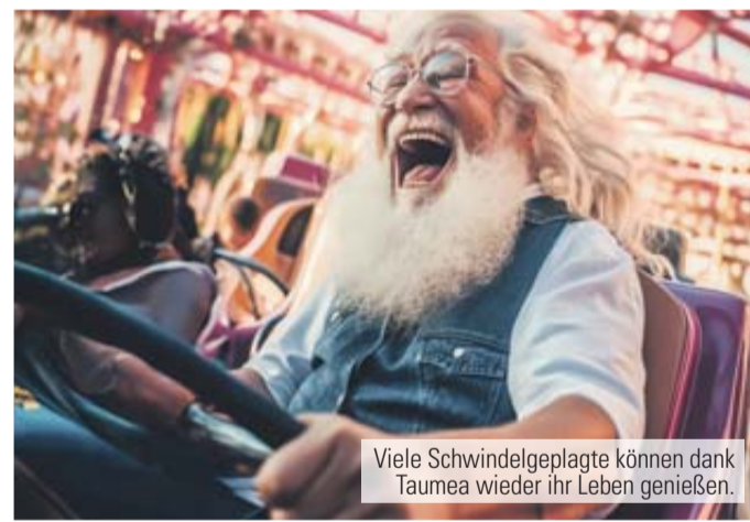
Viele Schwindelgeplagte können dank Taumea wieder ihr Leben genießen.

Immer wieder scheint sich alles zu drehen oder zu schwanken? Bei Schwindelbeschwerden im Alter kann ein rezeptfreies Arzneimittel namens Taumea wirksam helfen.