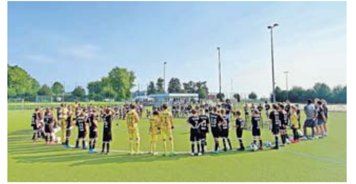
Auch 2025 ist wieder ein Fußballcamp geplant.

gahemspiel der Hamburger schon fünften Mal Mannschaften ein unvergessliches Wochenende im hohen Norden verbringen. Höhepunkt war jeweils das Einlaufen an der Hand der Profis in dem Kultstadion der zweiten Liga – dem Millerntor. In der kommenden Saison wird dies nun erstmalig beim Erstbundesligisten FC St. Pauli möglich sein – die Vorbereitungen hierfür laufen bereits.