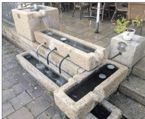
Der Brunnen am Dorfplatz sprudelt wieder.