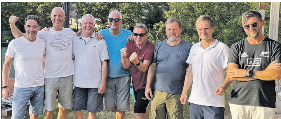
Die Herren 50 II des TC Eppstein haben Grund zu jubeln: Sie steigen in die Bezirksliga A auf.