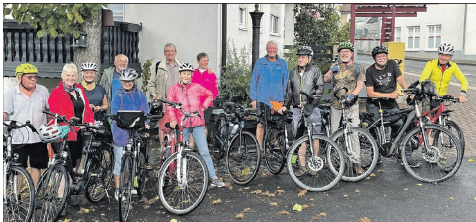
Wackere Radfahrer trotzten dem Regen und fuhren durchs Idsteiner Land – vier Radler ohne E-Unterstützung waren dabei.

Die Parteien berichten – Berichte der in die Eppsteiner Gremien gewählten Parteien und Wählergruppen sind namentlich gekennzeichnet. Für den Inhalt sind die Verfasser/Parteien verantwortlich.