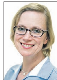
Satirikerin Pia Rolfs

Wer die Nachrichtenredakteurin, Glossenschreiberin, Satirikerin, Autorin und Lehrbeauftragte erleben möchte, kann dies am Samstag, 28. September, um 19.30 Uhr im Blauen Saal des Rathaus I in der Hauptstraße 99 in Vockenhäusen. Eintrittskarten zum Preis von 8 Euro gibt es im Vorverkauf im Bürgerbüro der Stadt, Am Stadtbahnhof 1, oder an der Abendkasse ab 19 Uhr. Veranstalter sind der Kulturkreis und die Stadt Eppstein. Weitere Informationen sind im Flyer, der im Bürgerbüro ausliegt, oder unter www.kk-eppstein.de nachzulesen.