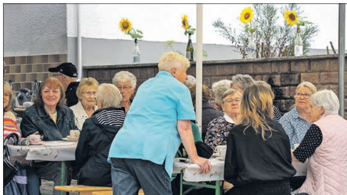
Nach dem Regen füllten sich die Tische und Bänke in der Bornstraße schnell.

Die rund vierstündige Veranstaltung könnte also langfristig das schöne Denkmal, das „Backes“, und wortwörtlich Geschichte wieder aufleben lassen. Die Stimmung war auf jeden Fall sowohl beim Heimat- und Geschichtsverein, als auch bei den Besuchern bestens und das Interesse an dem denkmalgeschützten Gebäude ist alles andere, als „ausgeglüht“. JS