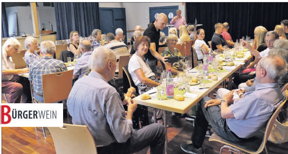
Bei der Stiferversammlung wird jedes Jahr der Eppsteiner Bürgerwein gewählt. Diesmal ist es ein spritziger Weißburgunder aus der Pfalz.