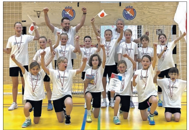
Die E-Jugend-Handballerinnen der HSG EppLa jubeln über Platz 2 beim Mini Handball Championship.

Ungeschlagen in der Gruppenphase ging es nun in die Finalrunde um die Platzierungen, in der Japan im Finalspiel um Platz 1 auf einen