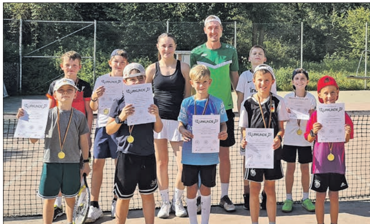
Der Tennis-Nachwuchs vom Ehlhaltener TC legte mit viel Spaß das DTB-Tennis-Sportabzeichen ab.