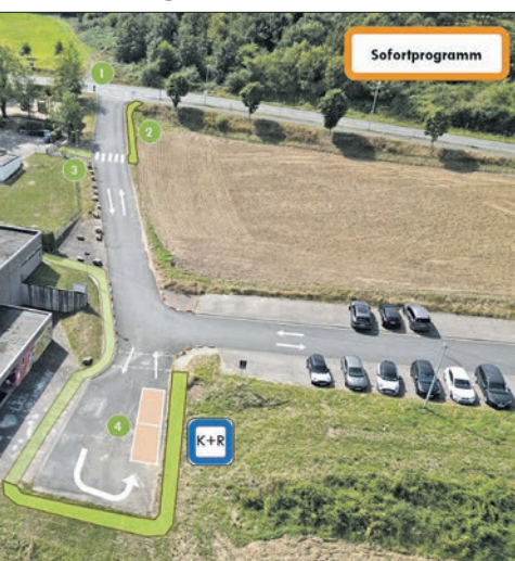
Die SPD schlägt als „Sofortprogramm“ zur Schulwegsicherung die Einrichtung einer „Kiss&Ride“-Zone vor der Comenius-Halle vor.

Als optimale Variante für einen späteren Ausbau schlägt die SPD eine Erweiterung der vorhandenen Parkfläche und eine neue Stichstraße als Ausfahrt Richtung Kreisstraße 792 vor. So könne die gesamte Zufahrt zum Parkplatz als Einbahnstraße ausgewiesen werden. Außerdem schlägt die SPD vor, dass ein neuer Fußweg aus Niederjosbach entlang der neuen Stichstraße und der Parkflächen gebaut werden solle. So müssten die Schüler aus Niederjosbach keine der beiden Zufahrten überqueren.