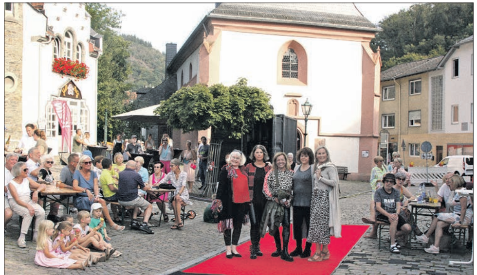
Fünf Eppsteiner Frauen präsentierten auf dem roten Teppich die aktuelle Herbstmode.

Sonntag: Der Naturpark Taunus lädt zu einer Überraschungs-Wandertour ein. Start ist um 12 Uhr am Stadtbahnhof ( naturpark-taunus.de/veranstaltungen/wanderungen/sonntags-in-eppstein/ ). Um 15 Uhr fällt der Startschuss zum 8. Bobbycar-Rennen der Talkirchengemeinde in der Rossertstraße.