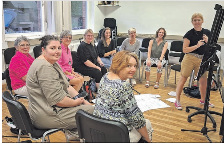
Konzentriert bei der Namensfindung – Frauen vom Liederkranz.

„Perfekt, besser kann man unseren Frauenchor nicht beschreiben“, so der einstimmige Tenor der Arbeitsgruppe. Wer die Sängerinnen vom Frauenchor „Melomanie“ im Mai bei ihrem Konzert im Bürgerhaus in Eppstein erlebt hat, wird sicherlich zustimmen. Auch Chorleiter Ulrich Diehl gefällt der Name und er freut sich auf die Chorproben und künftigen Konzerte. Melomanie probt alle 14 Tage montags von 19 bis 20.30 Uhr in der Alten Schule, Alte Schulstraße 2, in Bremthal.