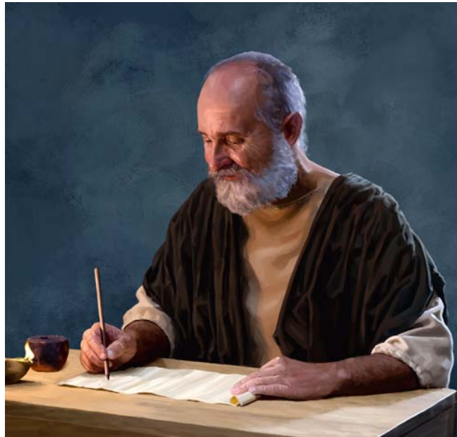
Unter dem Einfluss des heiligen Geistes schrieb Paulus einen Brief, in dem er die Korinther aufforderte, den reuelosen Sünder aus der Versammlung zu entfernen (Siehe Absatz 5)

5. Wozu forderte Paulus die Versammlung auf, und was meinte er damit? (1. Korinther 5:13). (Siehe auch das Bild.)