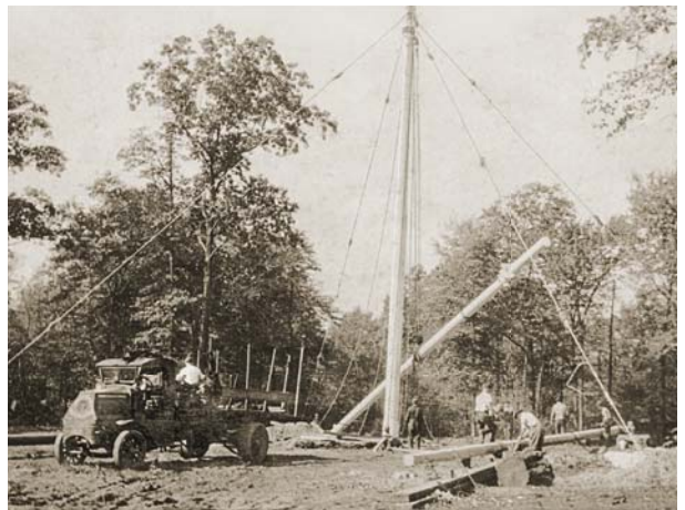
Einer der Masten für die WBBR-Antenne wird aufgerichtet