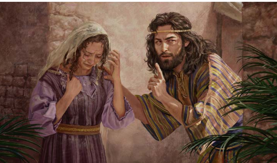
Absalom übte aus Wut Rache, als er erfuhr, was man seiner Schwester Tamar angetan hatte (Siehe Absatz 6)

7. Was lösten Ungerechtigkeiten bei einem Psalmenschareiber aus?