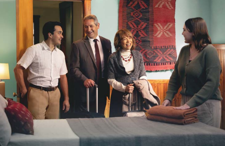
Ein gastfreundliches Ehepaar nimmt einen reisenden Aufseher und seine Frau bei sich zu Hause auf (Siehe Absatz 6)

lung, weil sein Verhalten einwandfrei ist. Er muss aber auch „bei Außenstehenden einen guten Ruf haben“ . Es kann natürlich sein, dass sie seine Glaubensansichten kritisieren, aber sie sollten keinen berechtigten Grund haben, an seiner Ehrlichkeit oder seinem guten Verhalten zu zweifeln (Dan. 6:4, 5). Frag dich: Stehe ich innerhalb und außerhalb der Versammlung in einem guten Ruf?