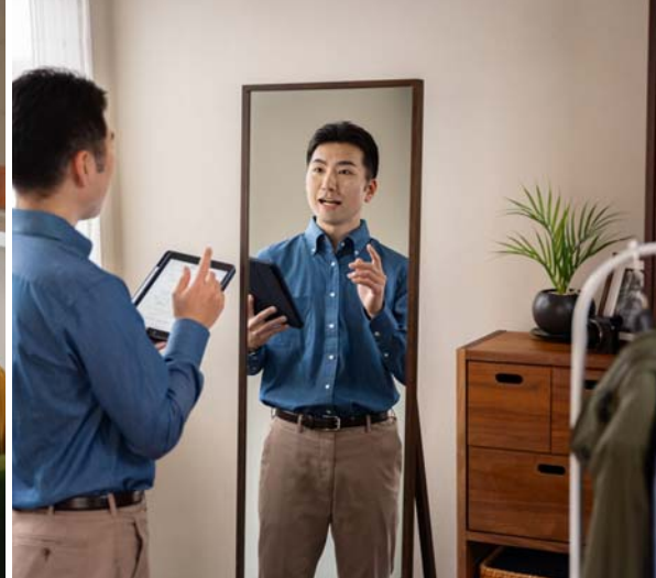
Ein Dienstadtgehilfe, der einen erfahrenen Ältesten begleitet, lernt mit der Bibel zu lehren. Außerdem übt er vor dem Spiegel einen Vortrag (Siehe Absatz 16)

Prinzipien hältst und die Anweisungen seiner Organisation befolgst (1. Tim. 4:15).