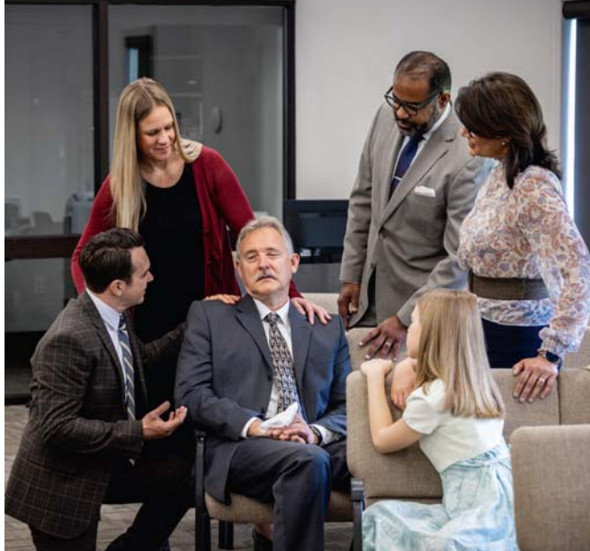
Wir können durch unsere Brüder und Schwestern getröstet werden (Siehe Absatz 8-9)

7. Wie fühlte sich Hanna, nachdem sie Jehova ihr Herz ausgeschüttet hatte?