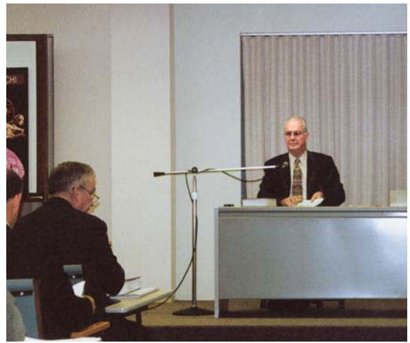
Beim Leiten einer Schule für Versammlungsälteste

gefunden hätte, mit dem ich die Bibel studieren könnte. Ich hielt kurz inne und fragte ihn dann: „Wärst du bereit, mit mir die Bibel zu studieren?“ Er überlegte kurz und sagte: „Eigentlich spricht nichts dagegen.“ Also wurde mein Vater mein erster Bibelschüler. Für mich war das etwas ganz Besonderes!