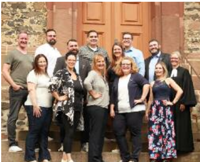
Oben: die Silbernen Konfirmanden