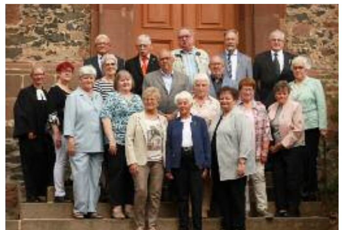
Oben: die Diamantenen Konfirmanden