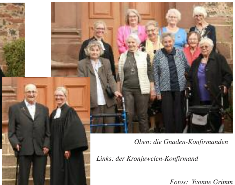
Oben: die Gnaden-Konfirmanden