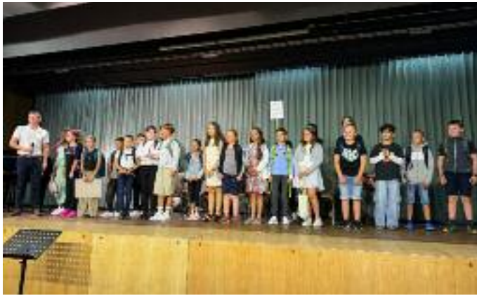
Aufnahme der neuen Fünftklässler/innen der Friedrich-August-Genth-Schule - Bericht linke Seite.