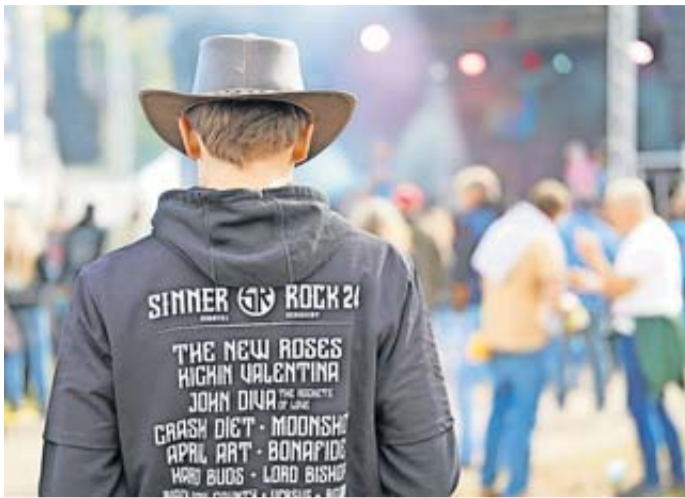
Das Line-up des Sinner-Rock-Festivals konnte sich auch diesmal wieder sehen lassen.

Sinntal. Es war ein Festival-Wochenende der Superlative: Die siebte Auflage des Sinner Rock im Sinntaler Ortsteil Altengronau ist vorüber. Und es war ein absoluter Erfolg für die Veranstalter und die Besucherinnen und Besucher. Der Kartenvorverkauf für nächstes Jahr beginnt schon in Kürze.