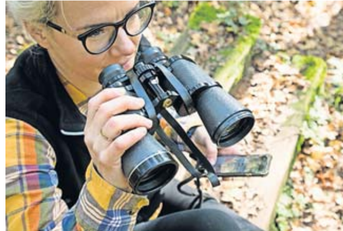
Nicht sicher, welcher Vogel da zwitschert? Die App Merlin Bird ID hilft.