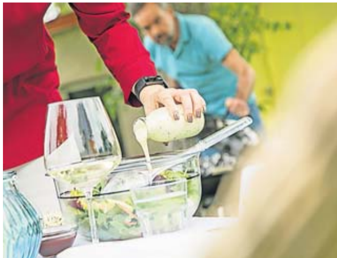
Küchenreste clever nutzen: Stiele von Kräutern, das Grün von Karotten und Co. sind perfekt für ein sommerfrisches Salatdressing. Einfach mit Öl, Essig und Zitronensaft pürieren.