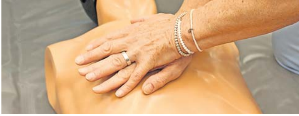
„Damit das Lebensretter-Netz dichter wird“: Wer über Kenntnisse in Erster Hilfe verfügt, kann sich als Corhelper registrieren lassen.