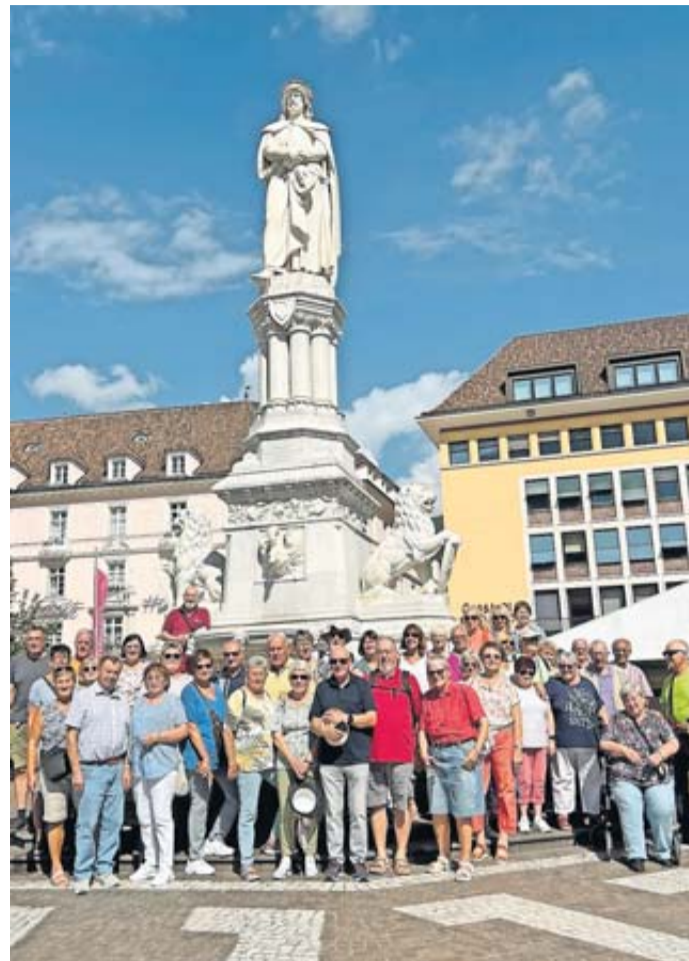
Reisegruppe des VSG Schlüchtern vor dem Walther-von-der-Vogelweide-Denkmal in Bozen.