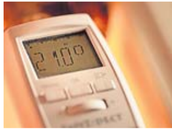
Wer Heizkosten sparen möchte, sollte über smarte Thermostate nachdenken.

Wer im Winter etwas sparen möchte, kann über programmierbare Thermostate nachdenken. Damit kann komfortabel eingestellt werden, zu welchen Zeiten geheizt werden soll. Zum Beispiel so, dass das Bad morgens und abends für eine Stunde warm ist, heißt es von der gemeinnützigen Beratungsgesellschaft co2online. Das ist auch dann praktisch, wenn Sie mal vergessen sollten, die Heizung herunterzulegen, wenn Sie das Haus oder die Wohnung verlassen. Für ein durchschnittliches Einfamilienhaus mit zwölf Heizkörpern kosten solche Thermostate in einfacher Ausführung laut co2online im Schnitt 180 Euro, also ungefähr 15 Euro pro Stück. Bei einer Wohnungsgröße von 110 Quadratmetern könne man mit ihnen die Heizkosten um durchschnittlich 190 Euro im Jahr senken. So ließen sich mit wenig Aufwand rund zehn