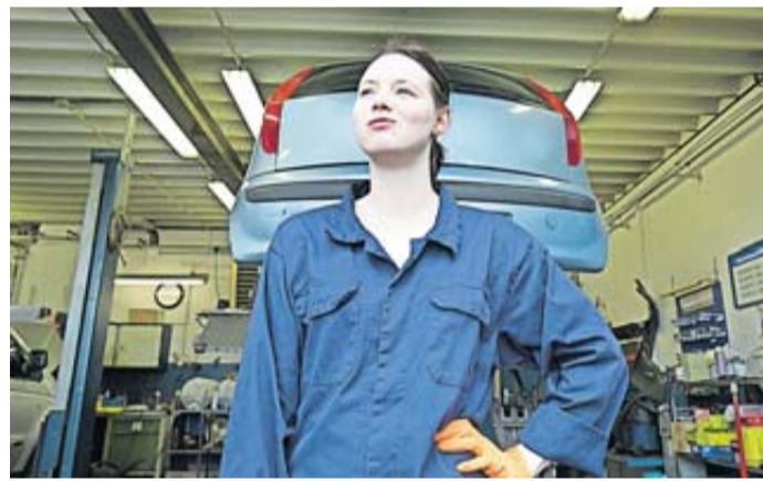
Azubis können Stunden reduzieren - wenn der Ausbildungsbetrieb einverstanden ist.

hin vorliegen musste, wie etwa Pflege Tätigkeit, Leistungssport oder Kindererziehung, fällt seitdem weg. Stellen mit reduzierter Stundenzahl werden aber so gut wie gar nicht ausgeschrieben. Deshalb gibt es nur eine Möglichkeit: nachfragen.“ Auch während der Vollzeit-Ausbildung können sich Azubis noch entscheiden, Stunden zu reduzieren: „Eine Ausbildung in Teilzeit ist eine Vereinbarung zwischen Arbeitgeber und Arbeitnehmer. Sind sie sich einig, können die Stunden jederzeit reduziert werden. Allerdings nur im gegenseitigen Einverständnis“, so der Fach-