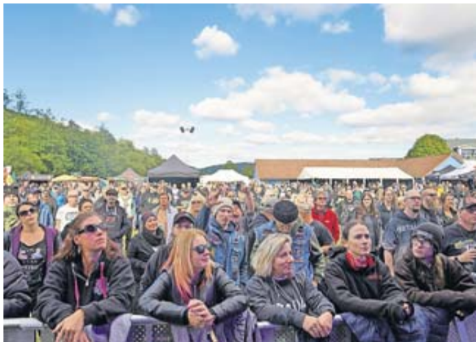
Das Sinner Rock 2024 war so gut besucht wie noch nie. Der Kartenvorverkauf für 2025 startet in Kürze.

Sinner Rock lockt mehr als 2000 Gäste an / Kartenvorverkauf für 2025 startet