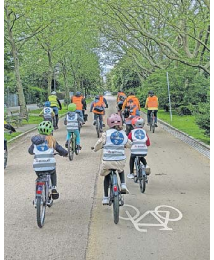
Schulkinder und begleitende Erwachsene im Bicibus.

rollen. Aus dem recht neuen Wohngebiet Sang fährt der Bus sicher und klimafreundlich zur Kapersburgschule. Die Vorbereitungen laufen. Die Strecke ist koordiniert und wird in Kürze gekennzeichnet. Ebenso werden die Eltern eingebunden. Sogar an eine Telefonnummer für die Dauer des Events ist gedacht. Das Wohngebiet Sang wurde als Startpunkt gewählt, da der Weg zur Kapersburgschule recht lange ist und viele dort wohnende Familien erst mit dem Bezug ihres neuen Heimes nach Rosbach kamen. Viele mögliche Wege zur Schule sind eventuell noch nicht so bekannt und werden deshalb nicht genutzt. Der Arbeitskreis Radgerechtes Rosbach (AKRR), der diese Aktion organisiert, freut sich über eine rege Teilnahme der Schulkinder und deren Eltern am ersten Rosbacher Bicibus.