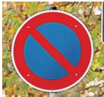
Hier sind maximal drei Minuten erlaubt, und längeres Halten ist nur in Ausnahmefällen möglich.

Erst wer sein Auto verlässt oder länger als drei Minuten hält, der parkt. Auf diese Regel in der Straßenverkehrs-Ordnung (StVO) weist die Prüfgesellschaft Dekra hin. Zeigt das runde Schild mit einem roten Balken quer durchs Blau ein eingeschränktes Halteverbot an, ist kurzes Halten somit erlaubt. Und es darf manchmal sogar länger dauern: Ausnahmen von der Drei-Minuten-Regel sind im eingeschränkten Hal-