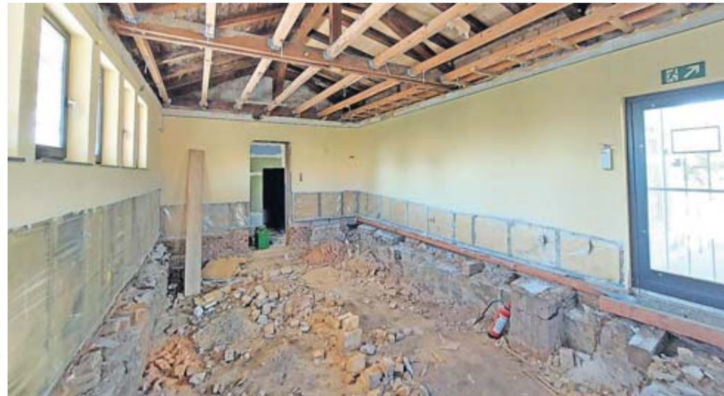
Der aktuelle Zustand im Rosbacher Jugendzentrum.

Wie bei vielen Bauprojekten gibt es auch beim Umbau