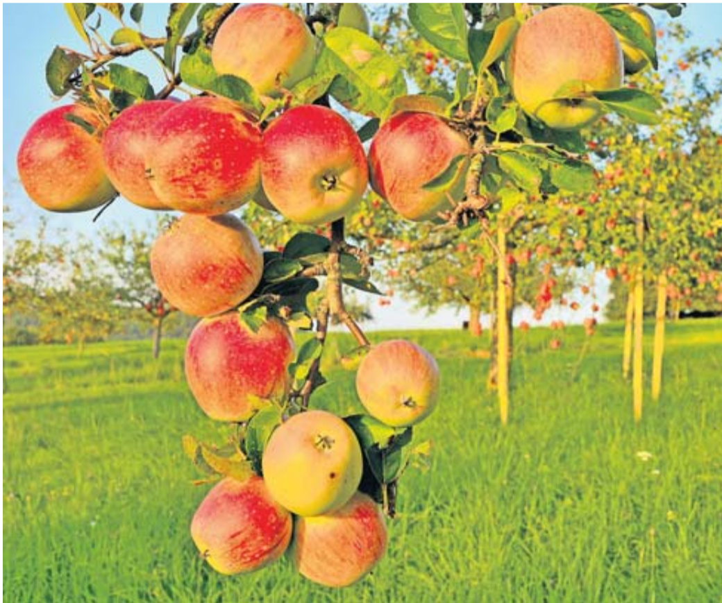
Reichliche Ernte auf den Streuobstwiesen – gelb markierte Bäume weisen auf die Erntefreigabe hin, sprich: Hier darf jeder pflücken..

In den beteiligten Städten und Gemeinden wurden Streuobstbäume mit einer gelben Markierung versehen, um die Erntefreigabe zu signalisieren. Diese Früchte können direkt vom Baum genossen oder zuhause weiterverarbeitet werden, zum Beispiel zu Saft, Kuchen oder Marmeladen. „Unsere Streuobstwiesen sind ein lebendiges Erbe, das von Generationen vor uns gepflanzt und gepflegt wurde. Ziel des Projekts ist es, stärker für die Bedeutung der Streuobstwiesen und ihrer Früchte zu sensibilisieren und gleichzeitig dafür zu sorgen, dass die Obstbäume auf kommunalen Flächen nicht ungenutzt bleiben. Eine Win-Win-Situation für Mensch und Lebensraum“, sagt Landrat