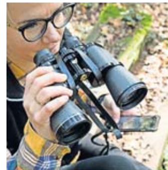
Welcher Vogel zwitschert da? Die App Merlin Bird ID hilft.

Wer sitzt da und trällert so schön? Mit dieser App wird die Vogelbestimmung zum Kinderspiel. Merlin Bird ID kann Vögel anhand von Fotos, Gesängen oder anderen Merkmalen schnell und präzise identifizieren - und ist damit nicht nur etwas für Hobby-Ornithologen. Die Anwendung ist kostenlos und läuft auf iOS- und Android-Geräten. Entwickelt wurde Merlin Bird ID vom Cornell Lab of Ornithology, einer Non-Profit-Organisation der Cornell University in New York. Deren Macaulay Library, ein wissenschaftliches Archiv mit mehr als 14 Millionen naturkundlichen Audio-, Video- und Fotoaufnahmen, bildet die Datengrundlage zur Identifikation der Vögel.