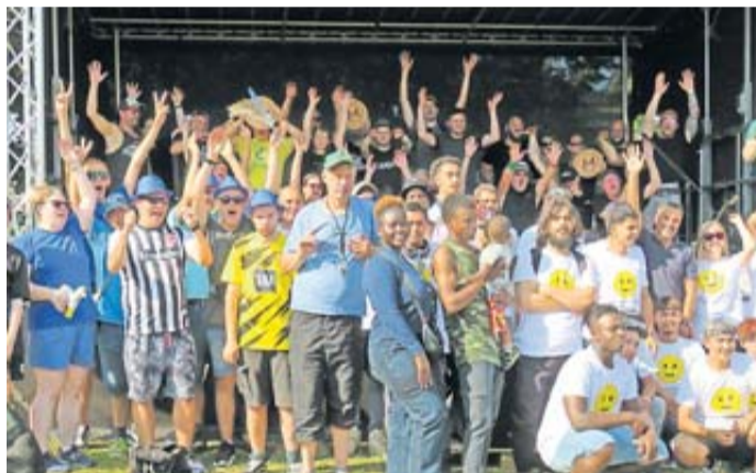
Vor der Bühne feiern nochmal alle gemeinsam das schöne „Menschenkicker“-Turnier.

Manchmal ist ja auch das gute Wetter „zu viel des Guten“, aber trotz der hohen Temperaturen ließen sich wohl nur wenige Menschen davon abhalten, zum gemeinsamen Feiern auf die Seewiese zu kommen. Das interkulturelle Fest, organisiert vom Internationalen Zentrum Friedberg e.V. (IZF), brachte erneut ein tolles Programm auf den Platz und auf die Bühne: Gleich der erste Beitrag, ein musikalisches Theaterstück der Kapersburgschule Rosbach mit der Geschichte vom kleinen Biber, der in die Welt hinaus geht, dabei viel Unterstützung erhält und Kraft schöpft, rief dem Publikum in der letzten Strophe ein „Na klar, liebe Leute, ihr schafft das!“ den Mut zu, Probleme fair und gemeinsam zu lösen. Damit trafen die Schüler genau den Punkt, der schon in