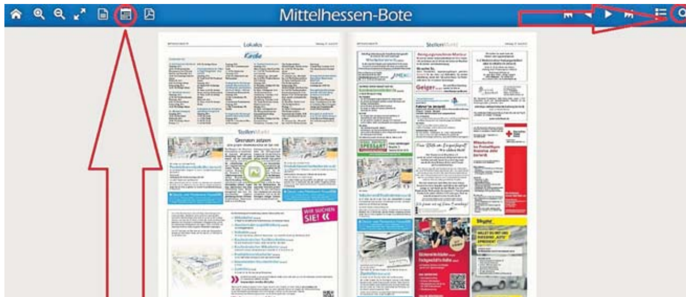
Das E-Paper des BOTEN hat viel zu bieten, wie den Zugriff auf alte Ausgaben über das Kalendersymbol oder die Volltextsuche.

Wie Sie von der E-Paper-Ausgabe profitieren können