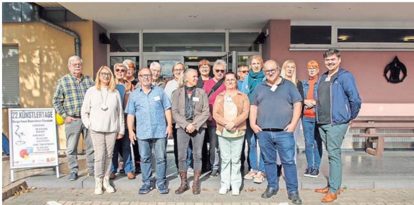
Die ausstellenden Künstler freuen sich schon.

Künstlertage der Kraniche vom 11. bis 13. Oktober