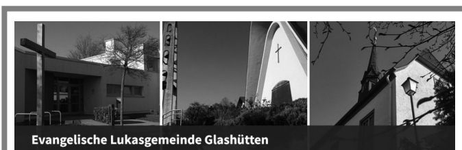
Evangelische Lukasgemeinde Glashütten