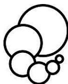
Kulturkreis Glashütten e. V.

Ein großartiges kammermusikalisches Feuerwerk bekamen die Besucher dieses Konzertes zu hören, und wie immer kann der Rezensent nur empfehlen, sich solche Abende in Glashütten nicht entgehen zu lassen. Dem Amelio-Trio steht mit Sicherheit eine bemerkenswerte Karriere bevor, man wird es noch auf weit bedeutenderen Podien erleben!