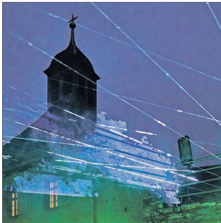
Laserstrahlen weben ein Netz aus Licht über dem Burghof.