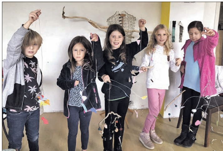
Die jungen Workshop-Teilnehmer zeigten ihre Mobilés.