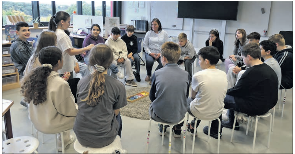
Ein Stuhlkreis zur Begrüßung hilft den Schülern, sich auf den Unterricht einzustellen.

Solche Plätze für eigenverantwortliches Lernen passen gut ins Konzept nach dem soge-