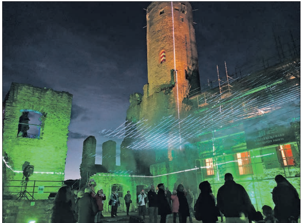
Der Burghof ganz ungewöhnlich in Licht und leuchtende, wabernde Nebel getaucht.

Sonntag, 27. Oktober: Von 10 bis 17 Uhr Hobby-Künstlermarkt im Vereinssaal Niederjosbach. Um 15 Uhr lädt der Kulturkreis zum Kindertheater „Furzipups der Knatterdrache“ in den Bürgersaal in Eppstein ein.