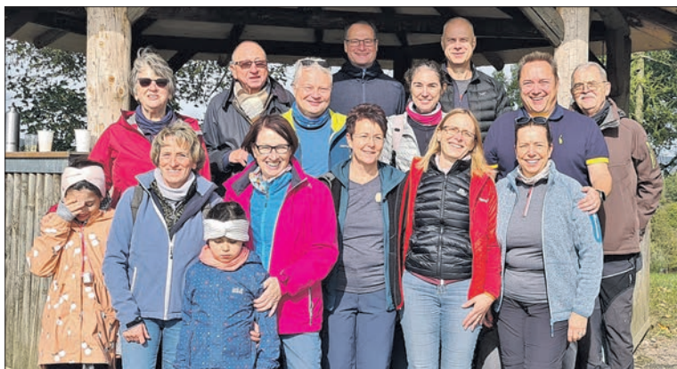
Kampf gegen Wildwuchs und danach traditionelle Herbstwanderung beim TC Ehlhalten.

Das Ziel: Die Plätze von wuchernden Kräutern zu befreien und zu schützen. Mit Eifer machten sich die Helfer ans Jäten. Ausgerüstet mit