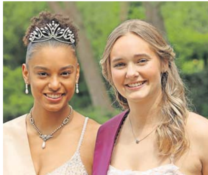
Die neue Blütenkönigin kann sich ganz sicher auf ein spannendes Jahr mit vielen interessanten Veranstaltungen freuen.

Netzschkau im Dezember begleiten. Jedes Jahr bietet neue, interessante Veranstaltungen und so darf sich die neue Blütenkönigin ebenfalls wieder auf ein spannendes Jahr freuen und aussuchen, welche Veranstaltungen sie, als Repräsentantin der Stadt, gerne besuchen möchte. Neben der Kleiderausstattung und den Fahrtkosten erhält die neue Repräsentantin der Stadt auch ein Tablet oder Handy – je nach Wunsch. Interessentinnen können sich ab sofort mit einem kurzen Schreiben unter kultur@rosbach-hessen.de bewerben oder sich unter Tel 06003/822212 vorstellen.