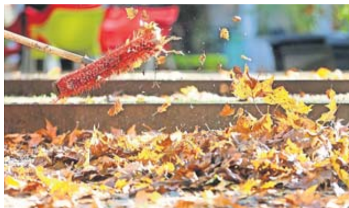
Auf Gehwegen sollte Laub wegen der Rutschgefahr nicht liegen bleiben.

Blätter bieten hier einen Schutzmantel. Regnet es stark, bleiben der Verbraucherzentrale NRW zufolge mehr Mineralien in der Erde. Aus dem übrigen Laub kann man in einer Ecke des Gartens einen Laubhaufen bauen. Der bietet Igel und Co. einen Unterschlupf für den Winter. Nur auf dem Rasen sollte keine dicke Schicht Laub liegen bleiben. Denn Gras kann auch im Winter weiterwachsen, wenn auch langsamer. Fehlen ihm dann Nährstoffe und Licht, wird der Rasen gelb. Am besten räumen Sie die Blätter also mit dem Rechen auf den Laubhaufen oder