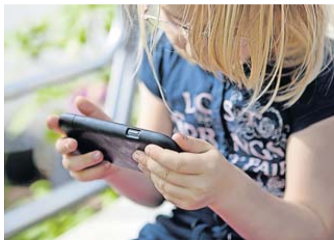
Die Augen nur auf dem Bildschirm: Auch auf die Lernleistung kann sich laut der Studie ein Smartphone-Verbot positiv auswirken.