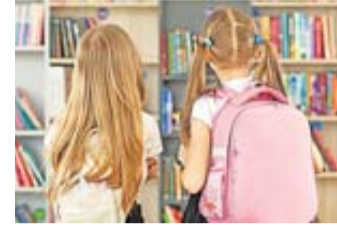
Vorbeischaun lohnt sich.

„Wir freuen uns auf zahlreiche Besucher und auf eine bunte Auswahl an Büchern, die bestimmt ihre neuen Besitzer finden werden“, so das Bücherei-Team.