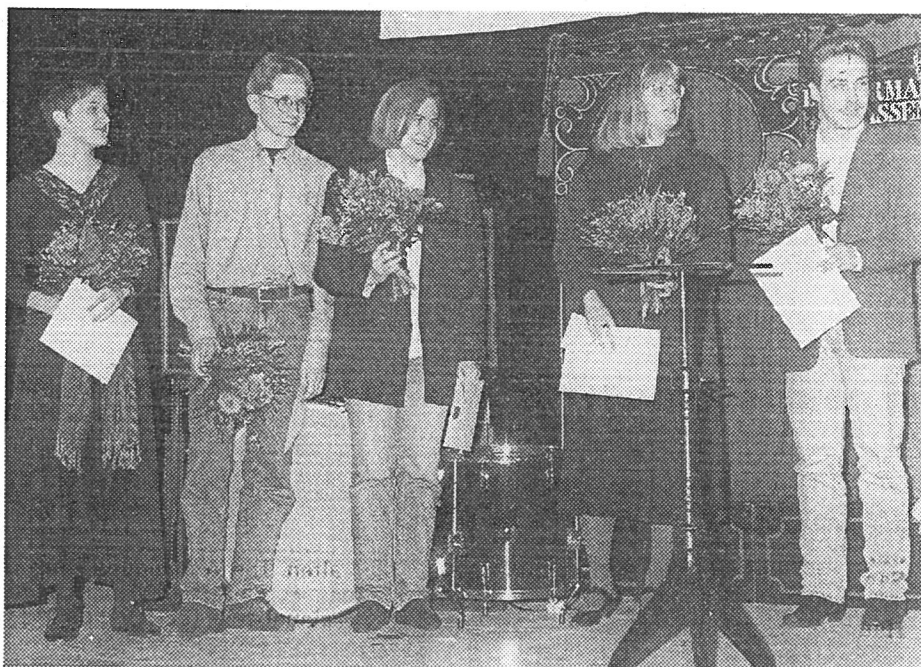
Die Theatergruppe des Papiertheater-Museums erhielt gestern abend den Kulturförderpreis 1993 des Main-Kinzig-Kreises.

Auch Anekdoten aus dem Kinzigtal und der Wetterau werden aufgearbeitet. Auch 1994 will die Gruppe wieder mit Planwagen und Pferden durch den Vogelsberg ziehen und Shakespeareschs Hamlet „auf den Boden der Vogelsberger Realität stellen“.