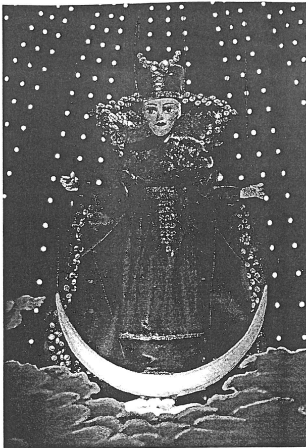
Prinz Rosenrot und Prinzessin Lillienweiß, Die Prinzessin und

Eine Liebeserklärung, weil es in seriösester Manier eine wohl weltweit einzigartige kleine Bühne hervorhebt, die mit der großen in einem umfänglicheren Zusammenhang steht, als der Titel erahnen läßt. Diese äußerlich aus dem Jahre 1821 und innerlich mit ihren letzten Verfeinerungen aus den Jahren 1995/96 stammende Bühne hat nämlich mit der landläufigen Vorstellung eines Marionetten-Theaters wenig zu tun. Marionetten gibt es zwar, aber sie sind kleine und bewegen sich in einem Papiertheater-Rahmen. So ist es möglich, daß diese phantastische Welt des Papiertheaters des 19. Jahrhunderts mit seinen wunderbaren Dekorationen, von denen auch ein Herr Ponelle noch zehrte, wiedererwacht und Einblick in die Prächtigkeit eines wesentlich begeisterteren Theaterjahrhundert gibt, als das unsrige es ist. Da hat die Phantasie, die Verzauberung, die Außergewöhnlichkeit „Theater“ noch ihren Raum. Da können Menschen nie gesehene Bilder in ihren Alltag tragen. Was auf diesem Theater stattfindet, vermittelt auch das Buch mit seinen guten Texten und ausgezeichneten Bildern (Fotos: Peter Eberts). Die einzelnen Aufführungen werden, bis hin zur spektakulären Zauberflöte in den Dekorationen von F. Schinkel - einem Meisterwerk, das selbst die berlinische Oper unter den Linden in der Regie H. Everdings nicht leisten konnte - dokumentiert: Undine, Genoveva, Doctor Johann Faust, Don Juan,