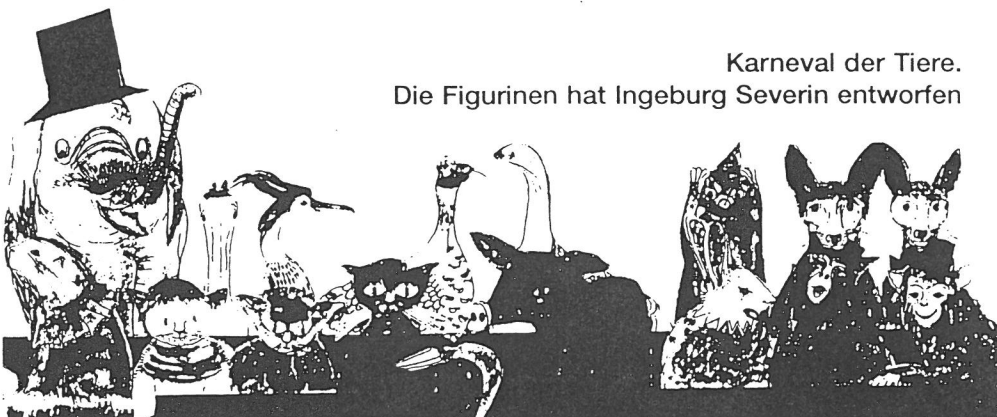
Karneval der Tiere. Die Figurinen hat Ingeburg Severin entworfen