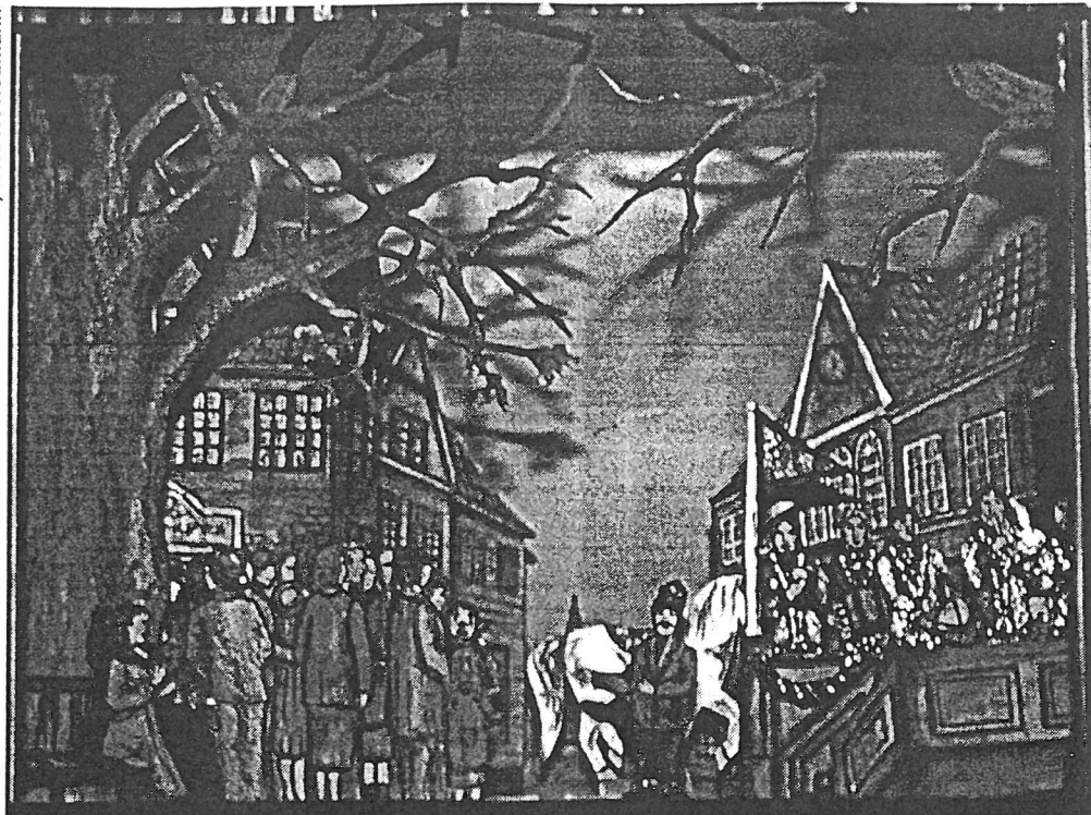
Der Zirkus hält Einzug. Szene aus Mitleid mit den Kindern der Stadt Vaden