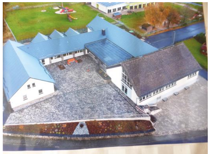
Christliche Gemeinde Mademühlen