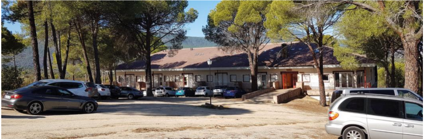
HOTEL Pinos Reales