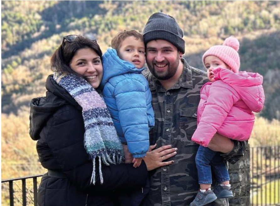
Familie Area Raboso