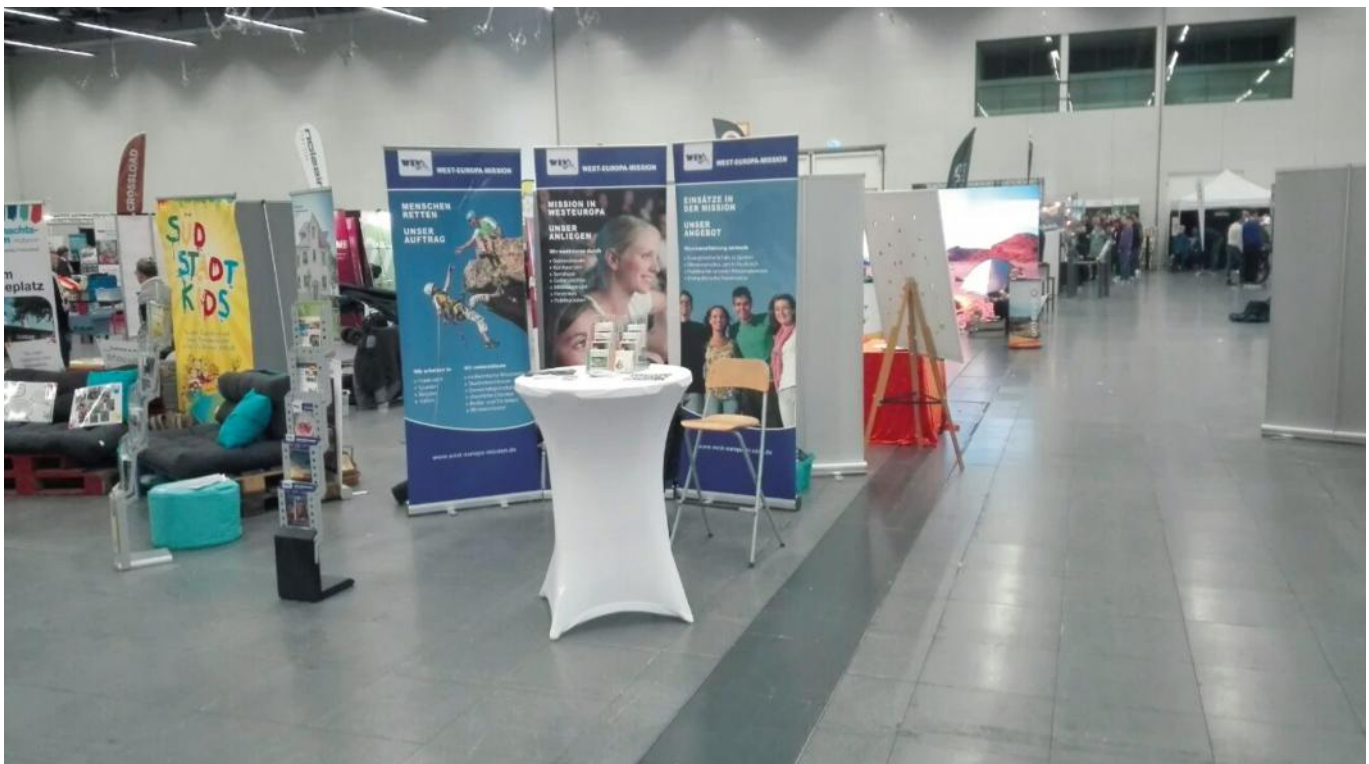
Missionsstand der WEM