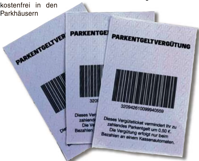
So sehen die Parktickets aus.