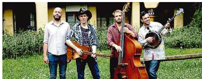
Rodeo FM kommen am 29. November.