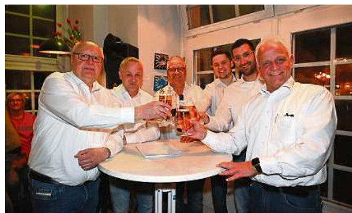
Die Füllis sorgen mit ihren kurzen Zwischenmusik-Beiträgen immer wieder für Stimmung.