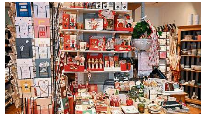
Blick auf attraktive Geschenk- und Dekorations-Ideen.

Kontakt: Haus 38 Wohnen & Schenken, Langgasse 38, 35781 Weilburg, Telefon 06471-1457.