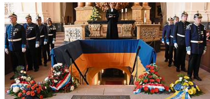
Pfarrer Guido Hepke und Gardisten der Bürgergarde am Eingang zur Gruft.