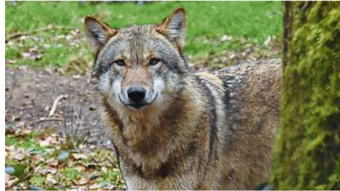
Wo ist Rotkäppchen? Das scheint der Wolf zu fragen.