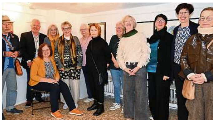
Die Frauen und Männer vom Künstler Forum 24

Da sich der Verein „Weilburger Forum“, dem sich die frühere „Weilburger Künstlerkolonie“ angeschlossen hatte, auflöste, aber die Gruppe der kreativen Frauen und Männer gerne weiter zusammenarbeiten möchte, bildete sich das „Künstler Forum 24 Weilburg“, das dank Bürgermeister Dr. Hanisch nun ein eigenes Domizil hat. Das Stadtoberhaupt hatte sich dafür eingesetzt, dass die Räume dafür