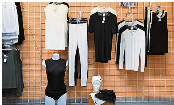
Die neuen Modelle für den Winter.

(red). Mit den kommenden kühleren Tagen wird es immer wichtiger, in der Kleidung ein angenehmes Wohlgefühl zu finden. Im Weilburger