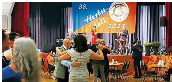
Eine Ansicht des letzten Herbstballs.

(red). Der diesjährige Herbstball des Tanzclubs Blau-Orange Weilburg e.V. findet am Samstag, 16. November, um 20 Uhr in der Weilburger Stadthalle „Alte Reitschule“ statt. Er steht unter dem Motto „All out of the 80's“. Passend dazu wird ein Showprogramm geboten, an dem unter anderem die Show-Formation Funky Shadows aus Merenberg teilnimmt. Für abwechslungsreiche Live-Tanzmusik sorgt die City-Rhythm-Band mit Frank Mignon (Keyboard, Gesang), Anita Vidovich (Gesang) und Stephan Heftrich (Saxophon und mehr).