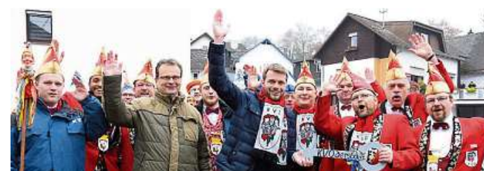
Immer wieder schön: Kampagnenstart in Odersbach.

Im Anschluss an die Rathausstürmung laden die Odersbacher Narren ihre Gäste zu einem Umtrunk in den Roten Hahn der FFV Odersbach ein. Auf das närrische Erscheinen vieler Interessierten freuen sich die Narren vom KVO.