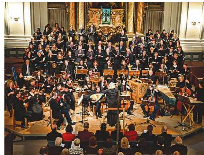
Die Kantorei der Schlosskirche Weilburg.

Karten zu 45, 38, 30 und 16 Euro (ermäßigt 41, 34, 26 und 12 Euro) sind erhältlich beim Verein „Alte Musik im Weilburger Schloss“ e.V., Telefon 06471-4541, Fax 06471-41010, oder per E-Mail unter info@alte-musik-weilburg.de .