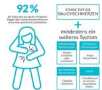
Anzeichen der akuten Porphyrie.

starken, wiederkehrenden Beschwerden den Verdacht der Ärztinnen und Ärzte auf die akute Porphyrie, kann ein Urin-Test Klarheit bringen. Der Nachweis eines speziellen Gendefekts bestätigt die Diagnose.