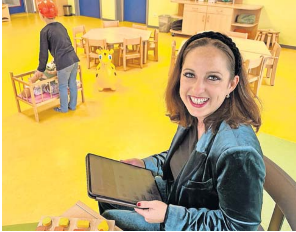
Eine Vielzahl von Online-Funktionen rund um das Thema Betreuungsplatz bietet das neue Programm „webKITA“ in Reichelsheim.

„Ich bin mir als Bürgermeisterin der besonderen Verantwortung bewusst, welche daraus erwächst, dass uns die kleinsten Bürgerinnen und Bürger anvertraut werden. Wir arbeiten intensiv daran, dass unsere Kindertagesstätten wunderbare Orte sind, an denen sich unsere Kinder wohl fühlen, sich entwickeln und eine tolle Zeit verbringen können“,