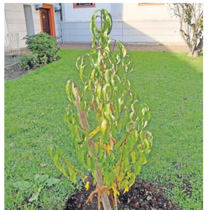
Der kleine Pfirsichbaum.