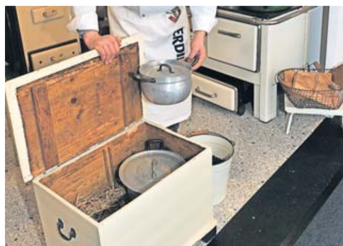
Kochkisten, wie dieses Ausstellungsstück in Hannover, wurden bereits Ende des 19. Jahrhunderts als energiesparende Kochmethode verwendet.

Traditionelle Kochkiste reduziert Energieaufwand