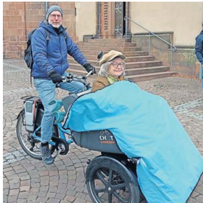
Eine der ersten Rikschafahrten.