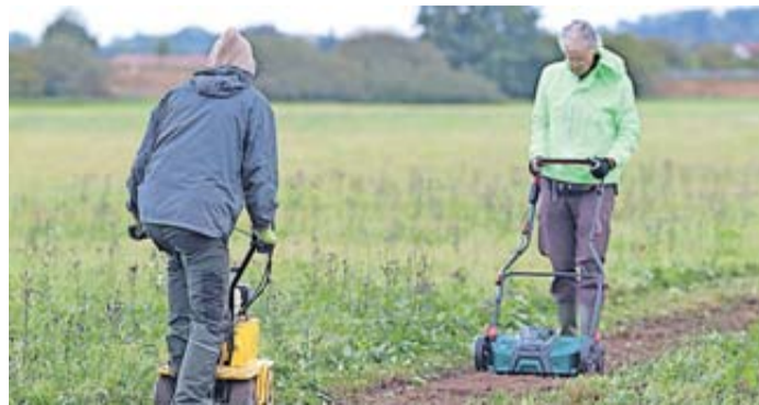
Mit einer kleinen Schälmaschine und einem Vertikutierer wurden die Flächen für das gesammelte Saatgut vorbereitet.

Gestartet wurde mit seltenen Arten der Pfeifengraswiesen, einer Pflanzengesellschaft, welche im Wetteraukreis stark gefährdet ist. Bereits im Laufe des Jahres wurden so-