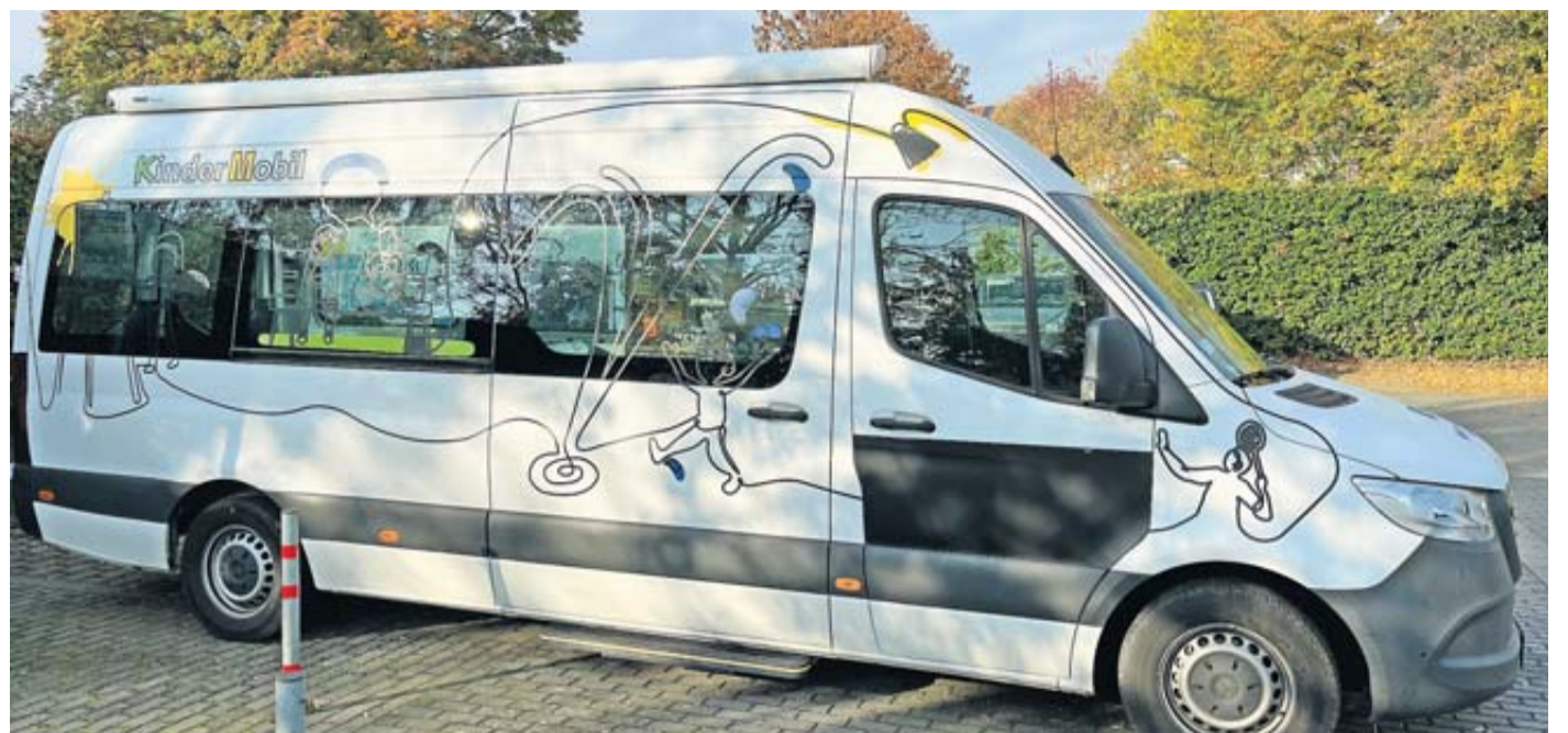
Mit auffälligen Motiven und dem eindeutig zu erkennenden Schriftzug zieht das KinderMobil alle Blicke auf sich.

Anfänglich werden die Treffen online durchgeführt, gemeinsam werden dann die persönlichen Treffen organisiert und besprochen. Auf Wunsch gibt es eine Begleitung von der Diagnosestellung bis hin zur Geburt und auch danach. Betroffene können per E-Mail unter sternenkinder-wetterau@web.de Kontakt zur Gruppeninitiatorin aufnehmen.