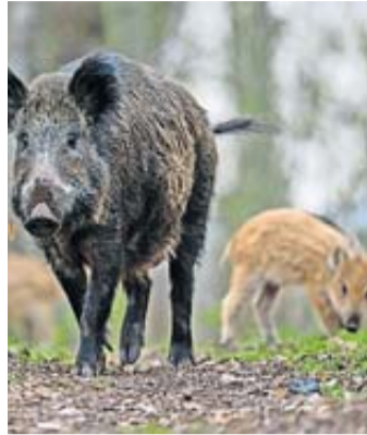
Besondere Vorsicht ist bei Wildschweinemüttern geboten.